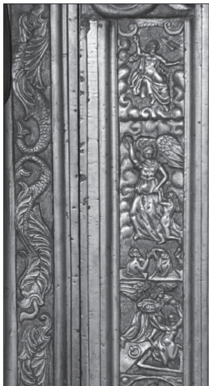
8. Olomouc, katedrála sv. Václava, kaple sv. Stanislava, bronzová vrata vstupu, 1591, detail Posledního soudu