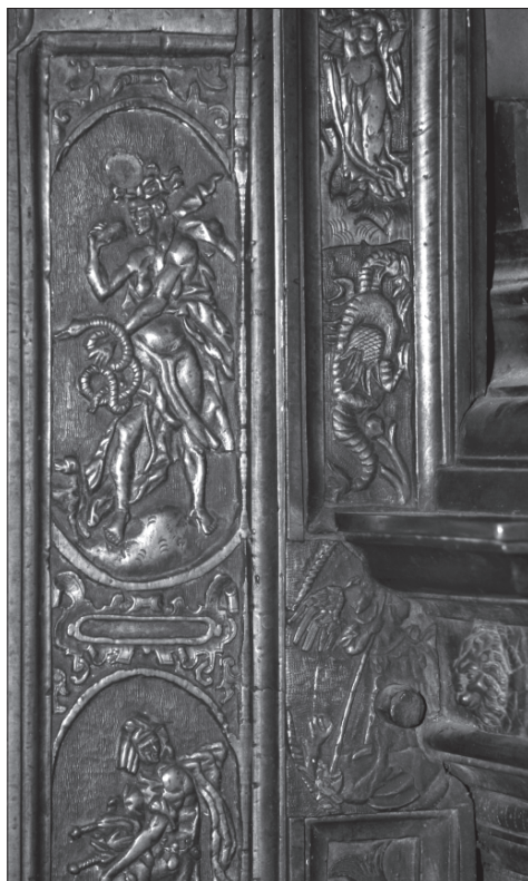
9. Olomouc, katedrála sv. Václava, kaple sv. Stanislava, bronzová vrata vstupu, 1591, detail Závisťi (Hereze) a archanděla Michaela s drakem