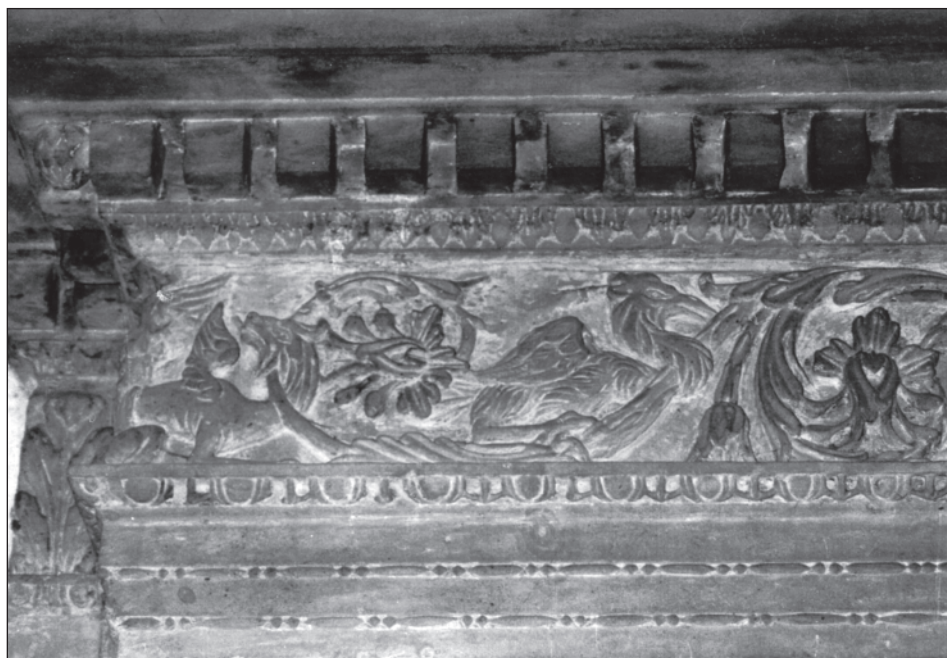
12. Kroměříž, kolegiální kostel sv. Mořice, portál sakristie, 1582, pískovec, detail vlysu