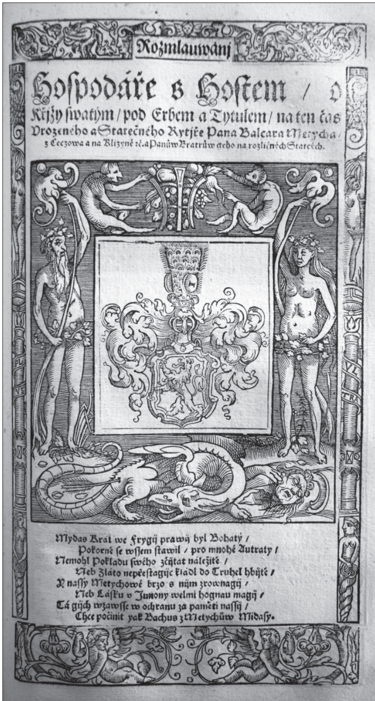
4. Bartoloměj Paprocký z Hlohól, Štambuch slezský , Brno 1609, titulní list knihy Rozmlouvání hospodáře s hostem . Vědecká knihovna v Olomouci