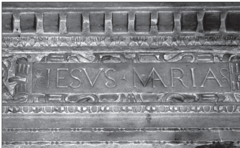
11. Kroměříž, kolegiální kostel sv. Mořice, portál sakristie, 1582, pískovec, detail vlysu