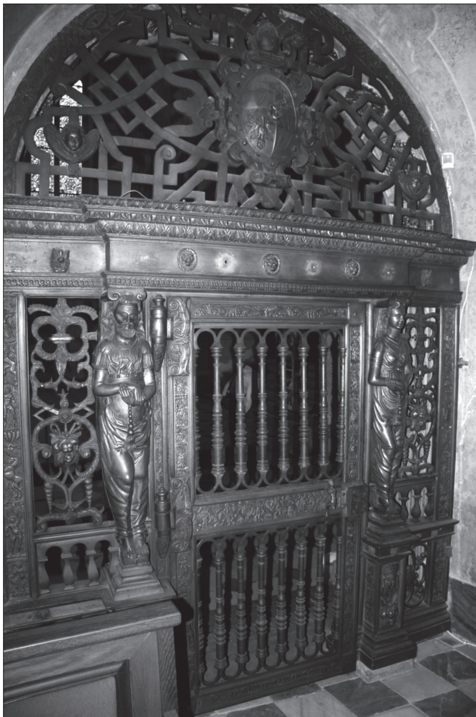
7. Olomouc, katedrála sv. Václava, kaple sv. Stanislava, bronzová vrata vstupu, 1591