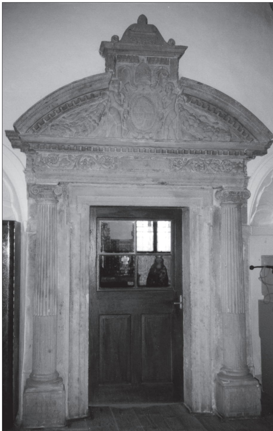
10. Kroměříž, kolegiální kostel sv. Mořice, portál sakristie, 1582, pískovec