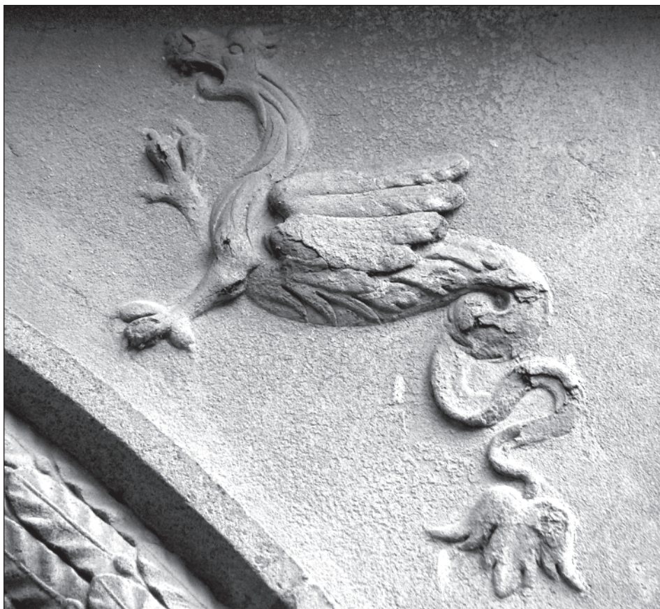
13. Moravský Krumlov, zámek, detail nádvořího portálu, před 1580, pískovec