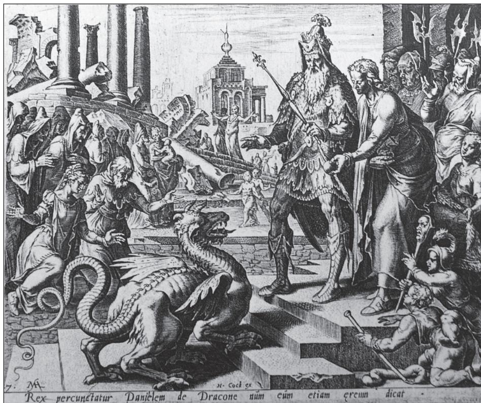
6. Maarten van Heemskerck, Prorok Daniel s babylónským drakem z cyklu apokryfí Knihy Danielovy, 1565, rytina