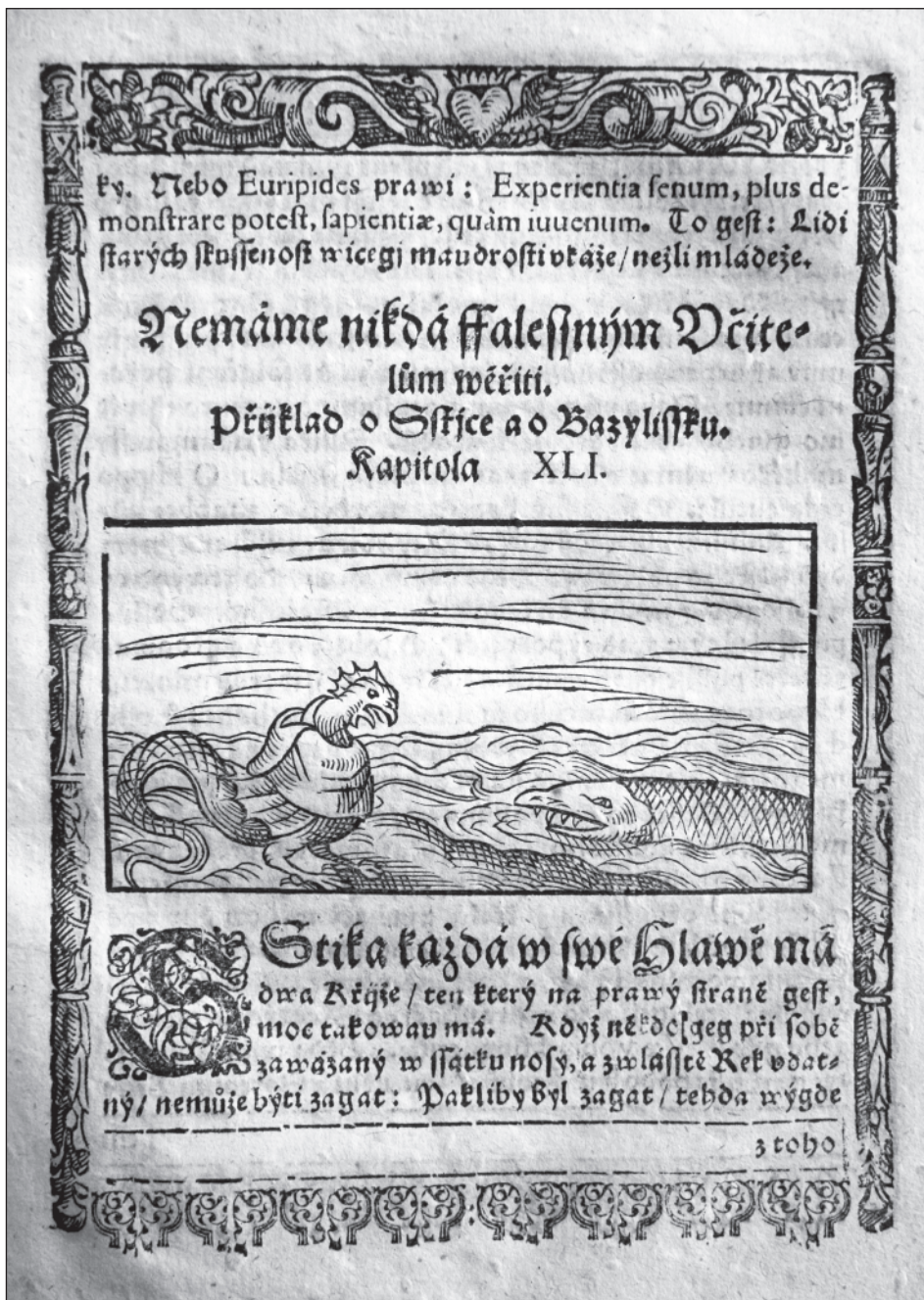
3. Bartoloměj Paprocký z Hlohov, Obora aneb Zahrada, v které rozličná stvoření rozmlouvání svá mají , Praha 1602, dřevorez záhlaví kapitoly XLI. Vědecká knihovna v Olomouci