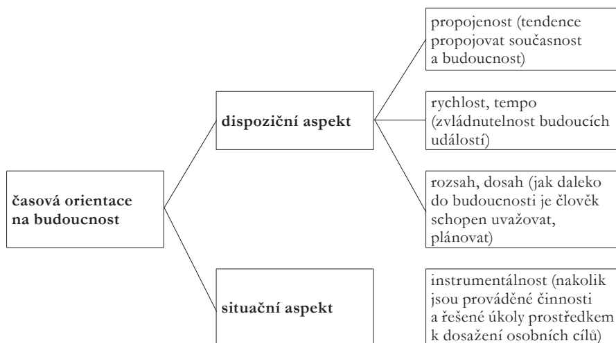
Obrázek č. 1: Struktura časové orientace na budoucnost (modifikované podle Husmanová et al., 2007)

Dispoziční aspekty, které poukazují na stabilnější osobnostní zvláštnosti, ponecháme nyní stranou. Poznamenejme jen, že se dají zjišťovat pomocí diagnostického nástroje FTPT – Future Time Perspective Time (Husmanová, Shell, 2008).