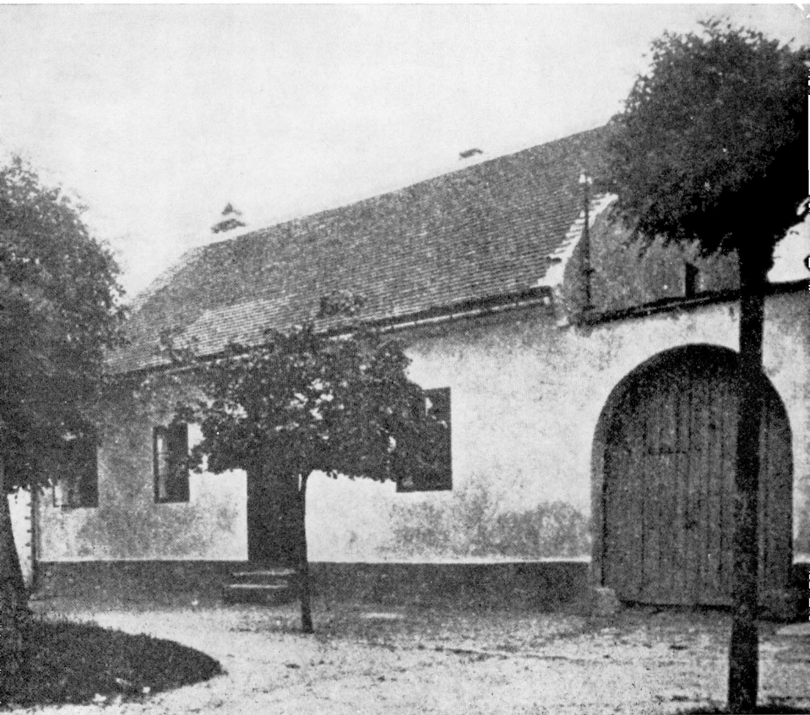
Rodný domek Táboorského v Bystřici p. Hostýnem