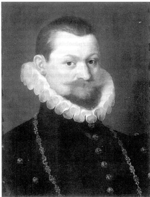
Zdeněk Vojtěch Popel z Lobkovic (Lobkoviczká obrazárna Nelahozeves)

předsedal soudnímu jednání nad viníky porážky v bitvě u Breitenfeldu. Lobkovic tehdy vydal dva rozsudky smrti, vykonané později na Staroměstském náměstí. 100