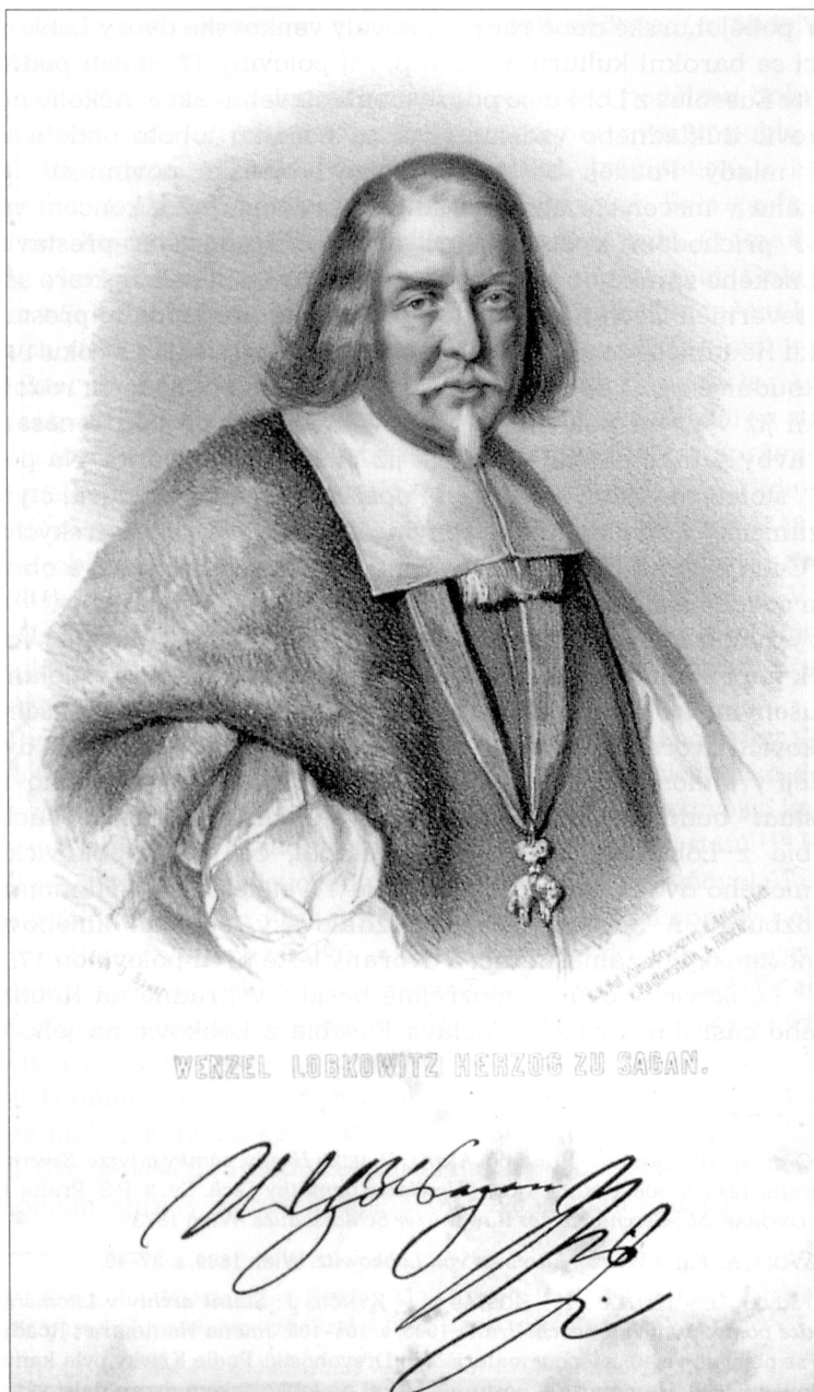
Václav Eusebius z Lobkovic (Lobkowiczská obrazárna Nelahozeves)