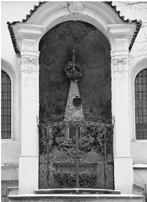
Obr. 4: Zachariáš Zimmer, Poslední soud , nástěnná malba v kapli Brauenbergů při kostele sv. Štěpána, Praha-Nové Město, 1739.