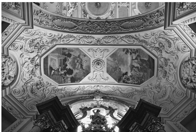
Obr. 3: Jan Ezechiel Vodňanský, Alegorie panenských ctností, kaple sv. Barbory, kostel sv. Ignáce, Praha-Nové Město, 1741.