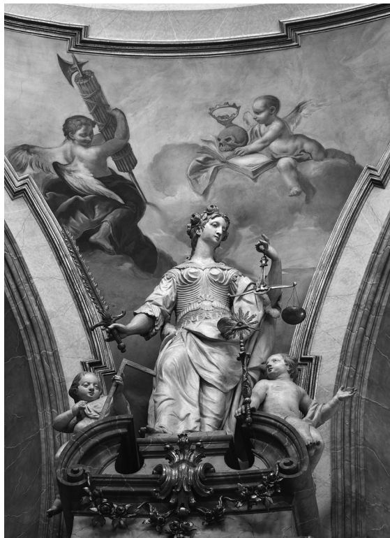
Obr. 9: Tobiáš Süssmayer (sochy) – František Karel Palko (malby), Justitia, kostel sv. Mikuláše, Praha-Malá Strana, asi 1757–1760.