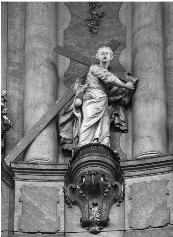
Obr. 8: Tobiáš Süssmayer, Alegorie Blahoslavenství, kostel sv. Mikuláše, Praha-Malá Strana, před 1756.