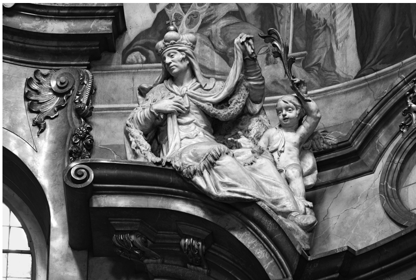
Obr. 10: Richard Jiří Prachner – Ignác František Platzer, Sv. Ludmila, nástavec oltáře Navštívení Panny Marie, kostel sv. Mikuláše, Praha-Malá Strana, asi 1760–1762.