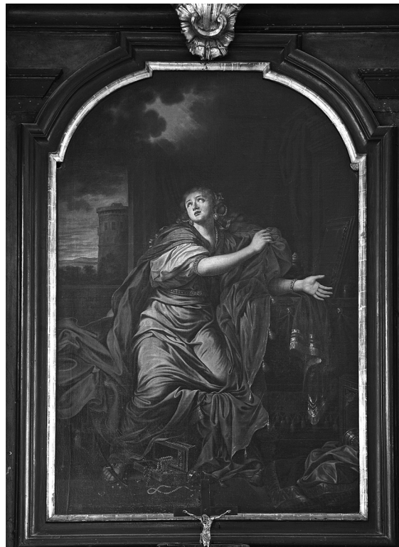
Obr. 5: Anton Smichaeus, Sv. Maří Magdalena , kostel sv. Petra na Poříčí, asi padesátá léta 18. století.

kteřá byla ohlašována v devadesátých letech 18. století a k jejíž realizaci pro Jahnovo úmrtí již nedošlo. 6