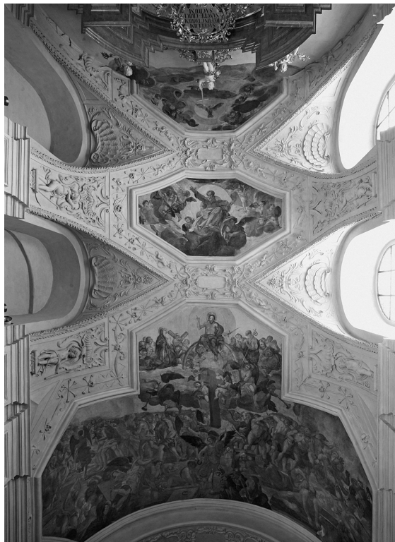
Obr. 2: Jan Jakub Stevens ze Steinfelsu, Poslední soud, tzv. Dušičková kaple, kostel sv. Ignáce, Praha-Nové Město, kolem 1685.