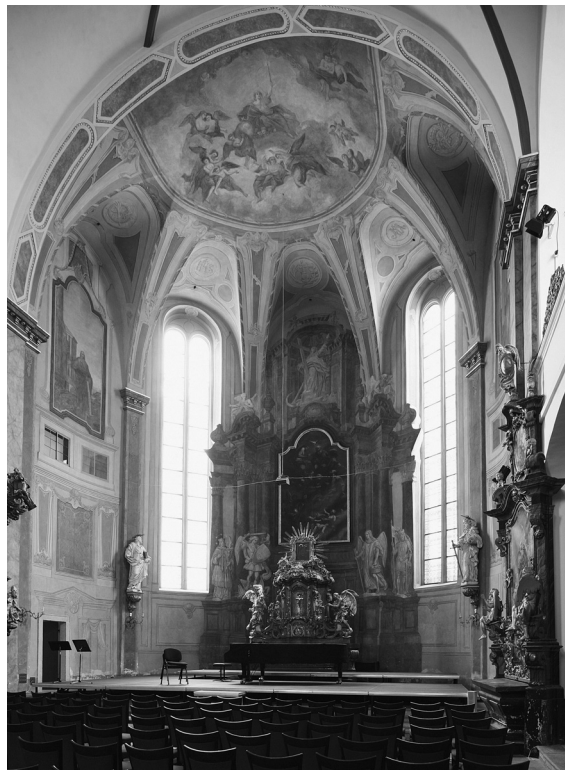
Obr. 6: Michael Václav Halbax (oltářní obraz) – Josef Hager (nástěnné malby), presbytář kostela sv. Šimona a Judy, Praha-Staré Město, kolem 1700 (obraz) – 1773 (nástěnné malby).