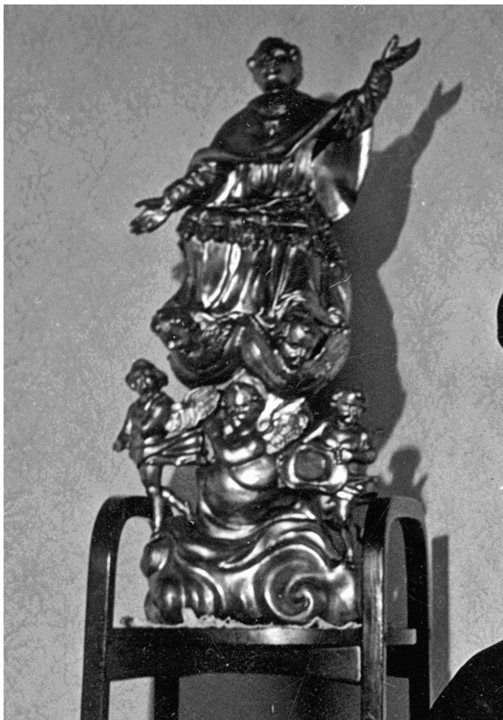
Abb. 3: Hl. Karl Borromäus, Bozzetto 1728 (?).

nem Elfenbeinkorpus, eine Schenkung Josefs II. aus der Kaiserlichen Schatzkammer. 8 Zu Ehren des heiligen Karl wurden Opfergaben in Form von zwei Frauenfiguren und ein silbernes Herz angebracht. 9