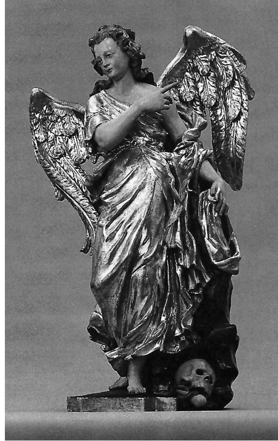
Abb. 6: Lorenzo Mattielli – Atelier, Engel des Neuen Testaments, 113 cm, cca 1738, Budapest, Magyar Nemzeti Galeria.

Den Altar zierte ein Werk von Gran aus den Jahren 1736–1737. Bezüglich der Abbildung der Heiligen herrscht bis zu den heutigen Tagen Uneinigkeit. Die neuere Literatur gibt die hl. Elisabeth von Portugal an, aber in älteren Quellen und der Literatur schreibt man nur über den Altar der heiligen Elisabeth. 60 Der ursprüngliche Maler des Bildes sollte Francesco Solimena sein. Da Neapel nach dem Jahre 1734 nicht mehr zur Donaumonarchie gehörte, wurde sein Auftrag nicht realisiert und an Dani-