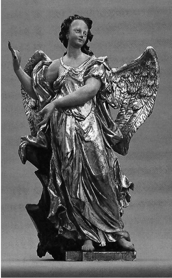
Abb. 5: Lorenzo Mattielli – Atelier, Engel des Alten Testaments, 111 cm, cca 1738, Budapest, Magyar Nemzeti Galeria.

Den Altar zierte ein Werk von Gran aus den Jahren 1736–1737. Bezüglich der Abbildung der Heiligen herrscht bis zu den heutigen Tagen Uneinigkeit. Die neuere Literatur gibt die hl. Elisabeth von Portugal an, aber in älteren Quellen und der Literatur schreibt man nur über den Altar der heiligen Elisabeth. 60 Der ursprüngliche Maler des Bildes sollte Francesco Solimena sein. Da Neapel nach dem Jahre 1734 nicht mehr zur Donaumonarchie gehörte, wurde sein Auftrag nicht realisiert und an Dani-