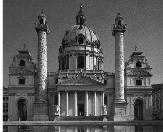
Abb. 2: Die Vorderseite der Karlskirche.

jener Zeit an, da Constantinus der grosse, und erster christlicher Kayser denen Christglaubigen erlaubt aller orten öffentliche Kirchen aufzurichten. Er selbst erbauete etweliche zu Rom: Helena, seiner Mutter nach Zeugnis Zomeni Lib. 8 C. 8 erbauete deren 30 in den Heil. Land, ja es wurden solche nach und nach allen Welt-Teilen aufgerichtet, Wem aber wurden sie gewidmet? Wem wurden sie geheiligt? Wem? Nicht mehr einem Jupiter oder Mars, nicht mehr einer Venus oder Diana, nicht mehr dergleichen erdichteten Gottheiten, sondern dem alleinigen wahren Gott Himmels und der Erden und gar recht, dan gleichwie der Tempel ein Haus ist des Opfers und der Anbetung, niren anderen aber ein wahres Opfer eund Anbetung, dan allein dem wahren Gott zur Erzeugung Steiner allerhochsten, ungebundenen und unumschränkten Oberrschaft über alle Creaturen gebuhret, also kann und soll auch niemanden mit Recht dan dem wahren Gott allein im Tempel, ein Haus des Opfers ein Haus der anbetung erbauen werden. Nulli Son otinum: schreibt Heil. Augustinus Lib. 20 contra faustum Manichaiten: ! Sed ipsi Deo Sanctorum quam vir in memoriam Sanctorum Altaria construimus. Wir tun keinem Heiligen, sondern dem Gott Dreieiligen selbst, obwohl zum Gedächtnis deren Heiligen Altare errichten oder Tempel erbauen, darum sie auch eigentlich Gottes-Häuser