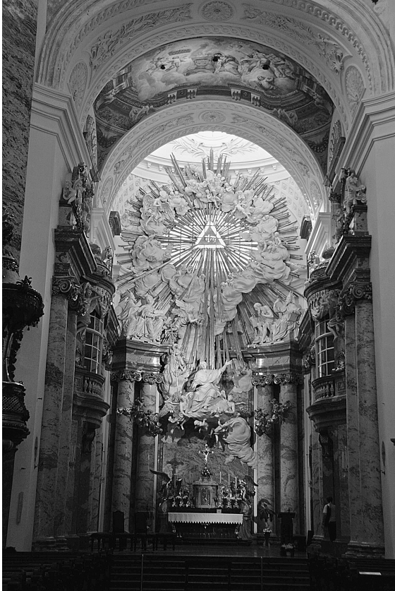
Abb. 4: Ferdinand Brokoff und Wiener Atelier, Hauptaltar der Karlskirche, Stuck, Marmor, vergoldetes Holz, Kunstmarmor, 1729–1730.

Ehren des heiligen Wenzel vorausgenommen: „ Sub olea pacis a palma virtutis conspicua orbi regia Bohemiae corona “. 12 Mit dem gesamten Theo-Karl-Programm korrespondiert das Fresko von Johann Michael Rottmayer in dem ersten Gewölbefeld. Im Albrecht-Kodex blieb eine Zeichnung mit einem ganz anderen Inhalt erhalten, 13 als das ausgeführte Gemälde trägt. Ursprünglich hat Albrecht die Humilitas-Allegorie vorgeschlagen, die vor der Allegorie der Weisheit kniet, die mit der linken Hand auf das apokalyptische Lamm mit sieben Siegeln zeigt. Später wurde der Entwurf geändert. Die Weisheit hält ein aufgeschlagenes Buch in der Hand, in dem steht: