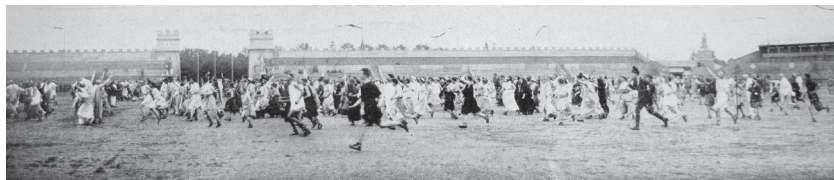
Vítání marathónského posla.