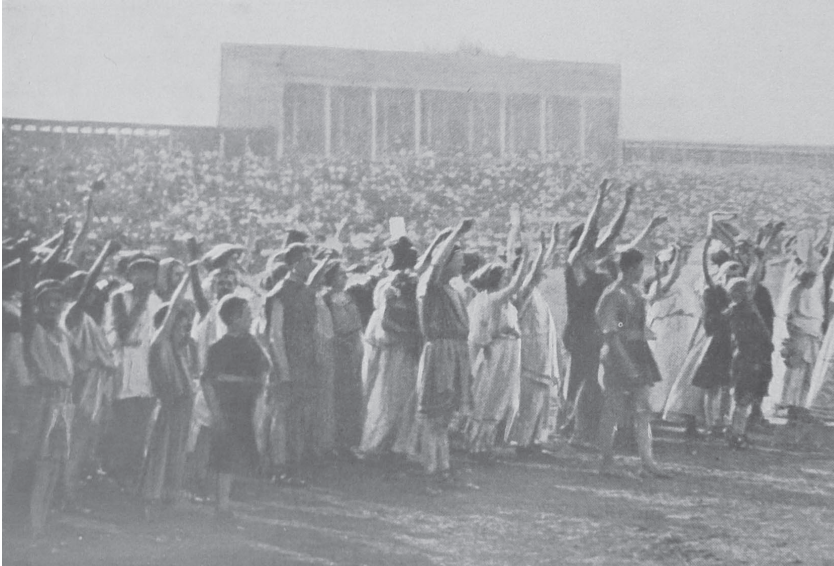
Loučení lidu s vojáky.