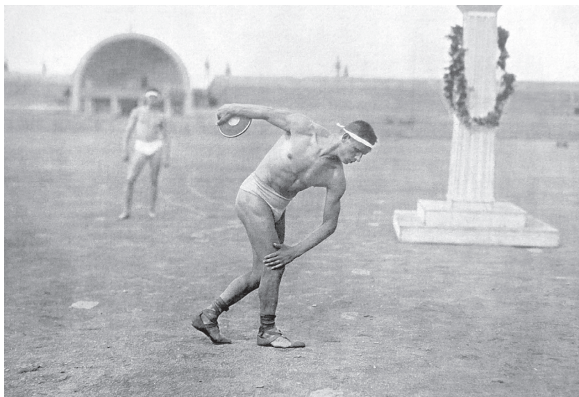
Hod diskem.