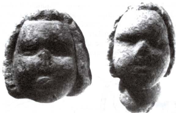
obr. 2: Hlavičky maltských sošek, vápenec 4. tis. př. Kr., Hypgeum Hal Saflieni, Malta

dost, od Kateřiny Emmerichové po Bernadettu Soubirousovou. U dalších méně výjimečných žen, se kterými žijeme, vidíme při intimním pozorování, jak se jistěji intuitivně rozhodují v životních situacích, kde logické myšlení „mužského“ typu zaostává či selhává.