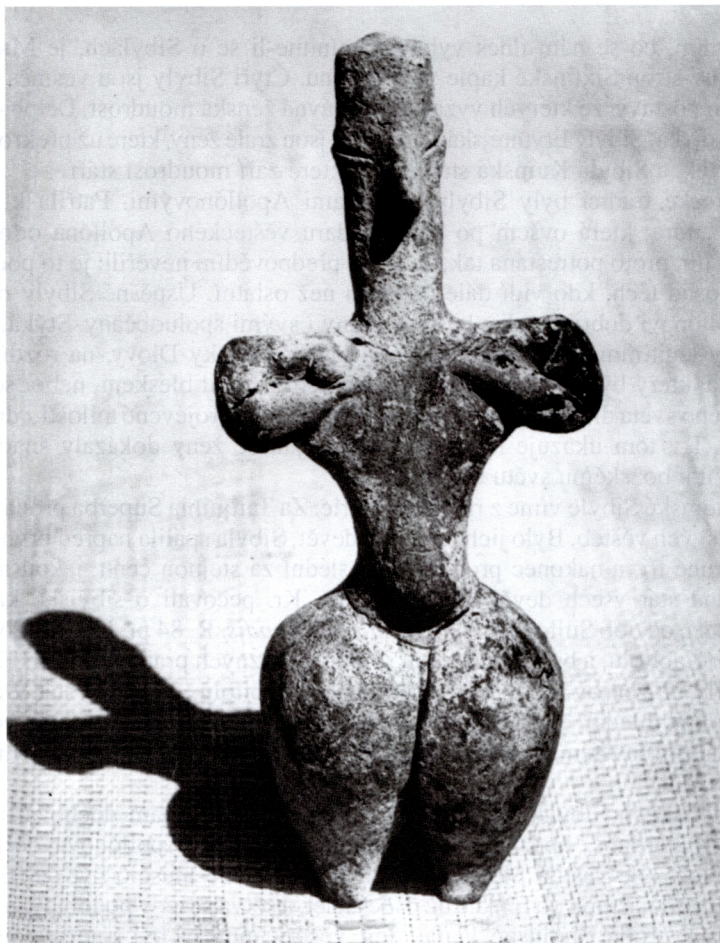
obr. 1: Raně neolitická hlíněná soška ženy z Nea Nikomedia (sev. Řecko) 6. tis. př. Kr., Muzeum Veroia

Podnes dochovány jsou sebrané Sibiyské věštby, jejichž nejstarší zápisy bývají obvykle datovány klasickými filology do 3. stol. př. Kr., a které byly doplňovány až do pozdní antiky, tzv. Chrésmoi Sibylliakoi .