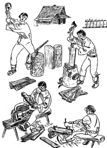
Obr. 7. Postup výroby šindele na Valašsku. Kresba J. Kobzáně.