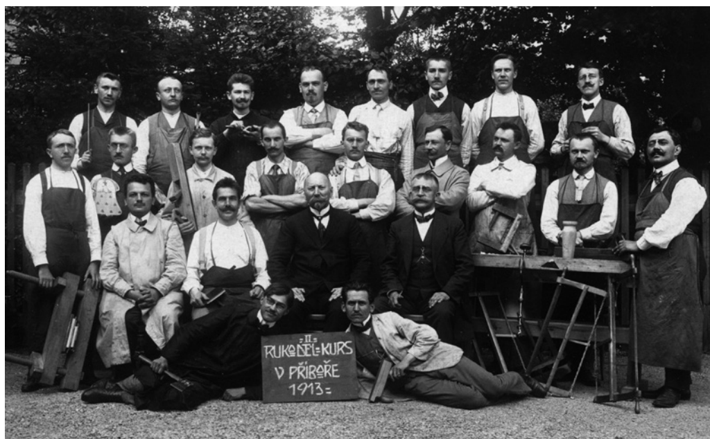
Obr. 2. Frekventanti II. rukodělného kurzu v Příboře 1913.