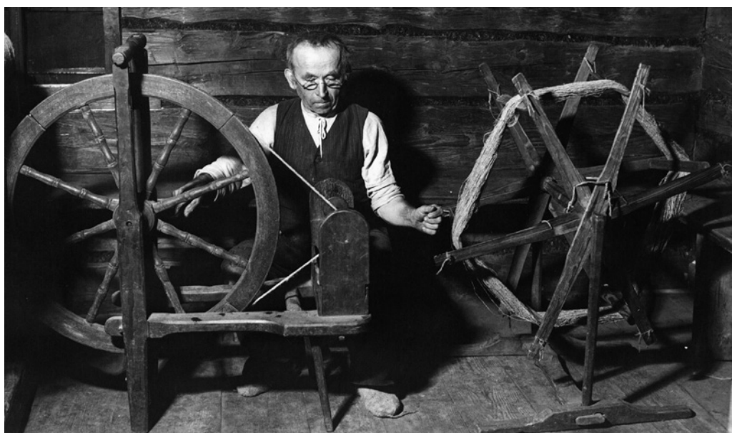
Obr. 13. Převíjení příze na špulíři. Fotoarchiv Muzea regionu Valašsko, Vsetín.