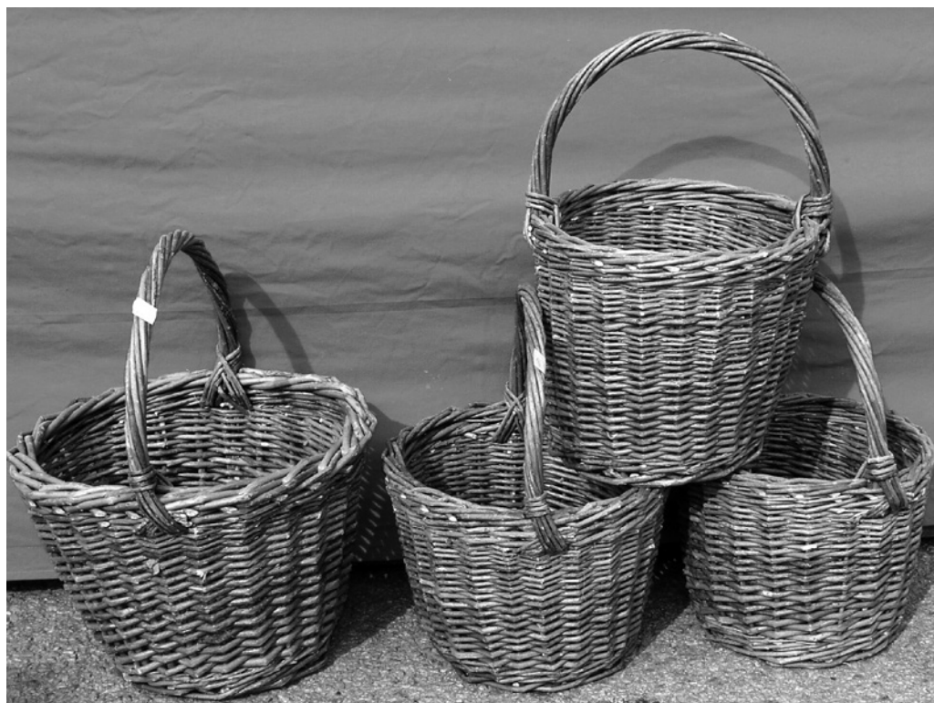
Obr. 5. Košíky z neloupaného proutí. Kunštát. Foto M. Válka, 2007.