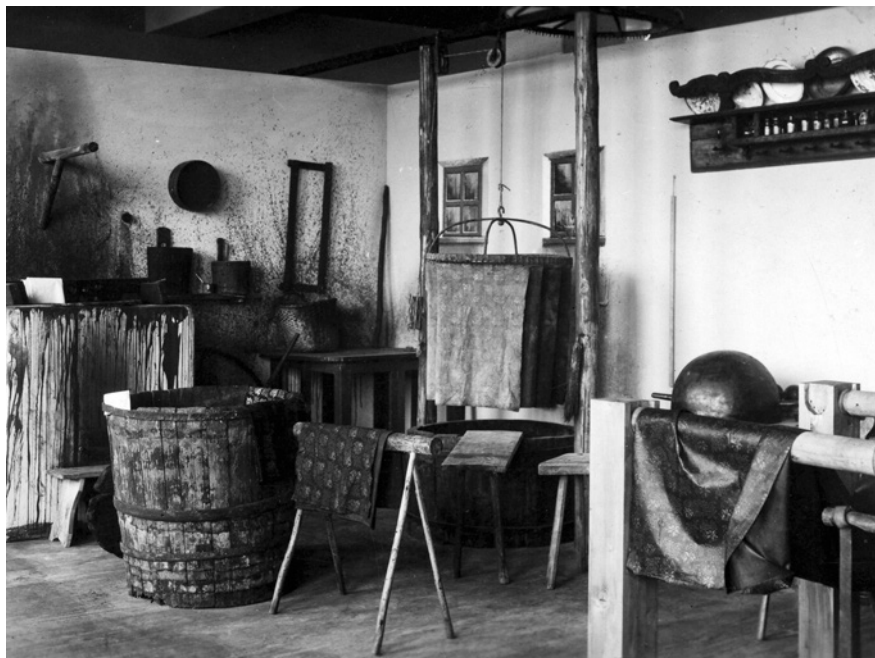
Obr. 15. Modrotiskařská dílna s kypou a ráfem (korunou). Rekonstrukce v muzejní expozici. Fotoarchiv Ústavu evropské etnologie FF MU, Brno.