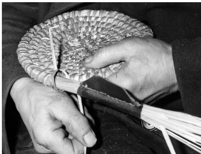
Obr. 3. Pletení ošatky ze slámy spirálovou technikou.