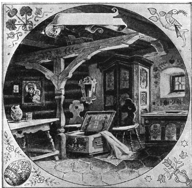
Obr. 1. Idealizovaná světnice s lidovým nábytkem z Turnovska. Kresba Jana Prouška z r. 1890.