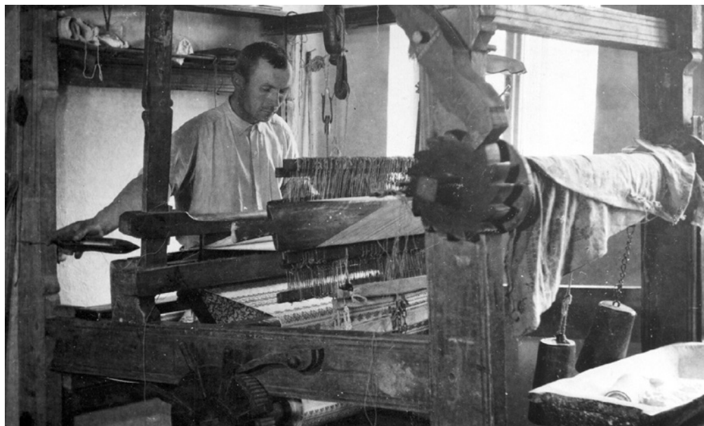
Obr. 14. Tkadlec při práci na tkalcovském stavu.