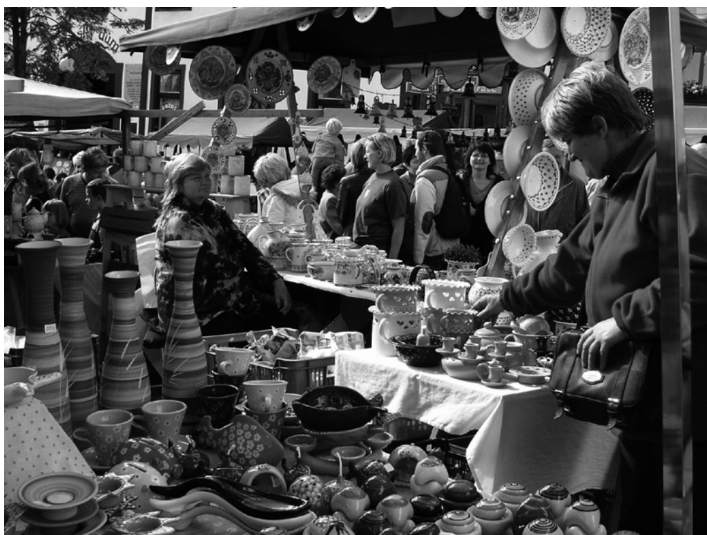
Obr. 11. Hrnčířský jarmark v Kunštátě na západní Moravě. Foto M. Válka, 2007.