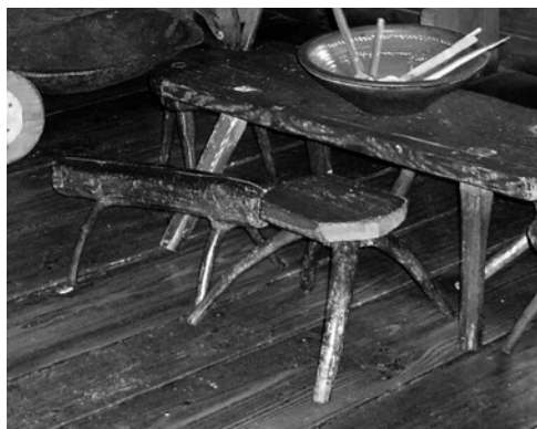
Obr. 8. Stoličky ze samorostu v karpatské jizbě. Etnografické muzeum v Krakově.