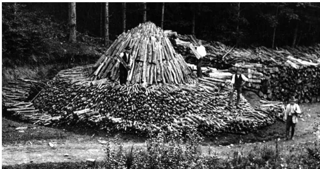
Obr. 10. Zakládání milíře k pálení dřevěného uhlí.