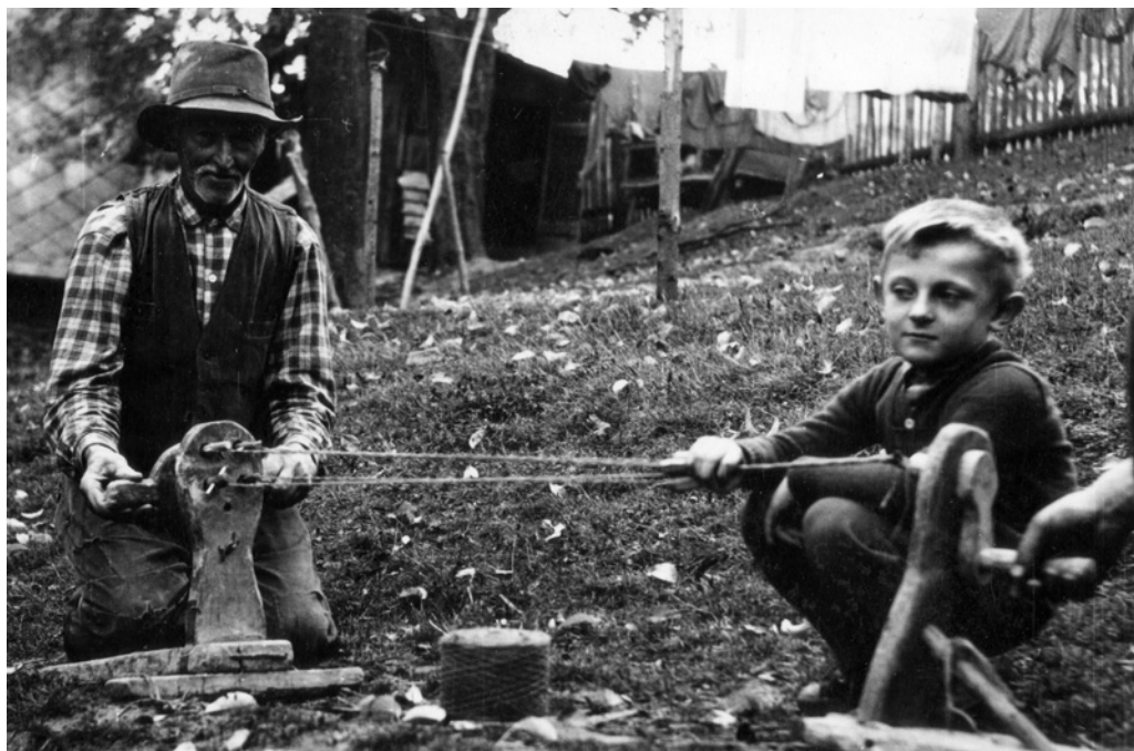
Obr. 12. Stáčení provazu na provaznickém vozíku.