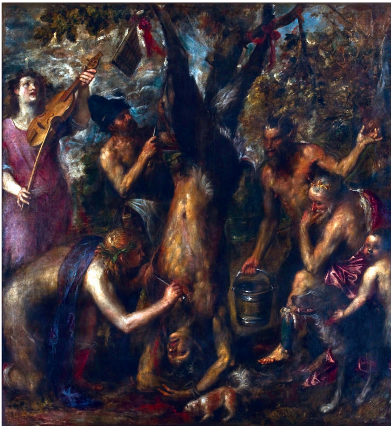
3 – Tiziano Vecellio zv. Tizian, Apollo a Marsyas , po 1550. Kroměříž, Arcidiecézní muzeum

podánilo dohledat jedinou stopu výměny názorů, v níž se Zdeněk Kudělka vytříbeným stylem, svérázně proloženým osobními poznámkami, vyrovnává s ikonologickou metodou. [Příloha 1] Kudělkův dopis lze vnímat jako komentář a doplnění staršího konferenčního vystoupení, zejména ve vztahu k možnostem ikonologického zkoumání architektury. 13 Zároveň naznačuje možnost budoucí spolupráce při výuce v brněnském Seminári, což pro Neumanna, toho