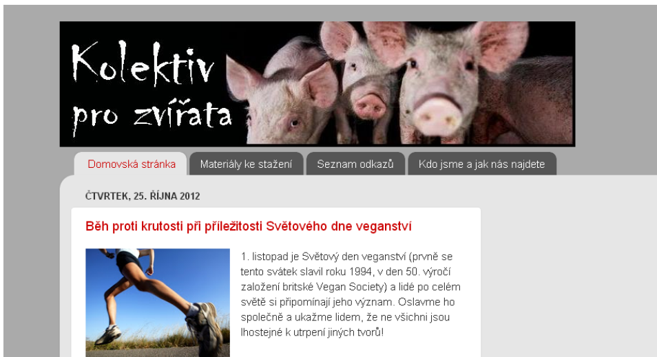
Obrázek 6. Webové stránky Kolektivu pro zvířata.

Zvolenými webovými stránkami pro ilustraci využití tohoto prostředku jsou webové stránky organizace Kolektiv pro zvířata (KPZ). Několik freeganů z výzkumného vzorku v této organizaci působí a webové stránky přímo vytváří. Analyzované stránky KPZ můžeme označit jako webové nebo blogové. Blog může sloužit jako vlastní provokativní deník (Byron & Broback, 2006). Pro odlišení od specifických blogů jednotlivců používáme označení webové stránky. Webové stránky KPZ jsou dostupné na http://kolektivprozvirata.blogspot.cz/ a jejich printscreen je k nahlédnutí na obrázku 6.