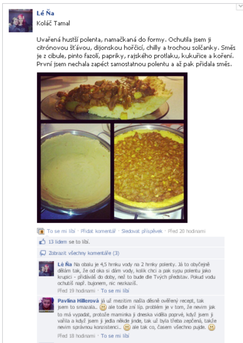
Obrázek 7. Veganská kuchařka na Facebooku.

Zdroj: http://www.facebook.com/groups/124454671803/