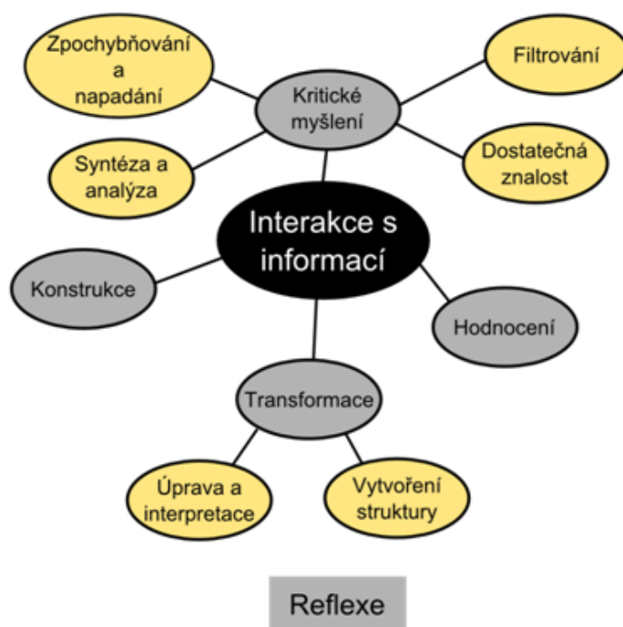
Obr. 3 Interakce s informací (Markless and Streatfield, 2007, s. 31)