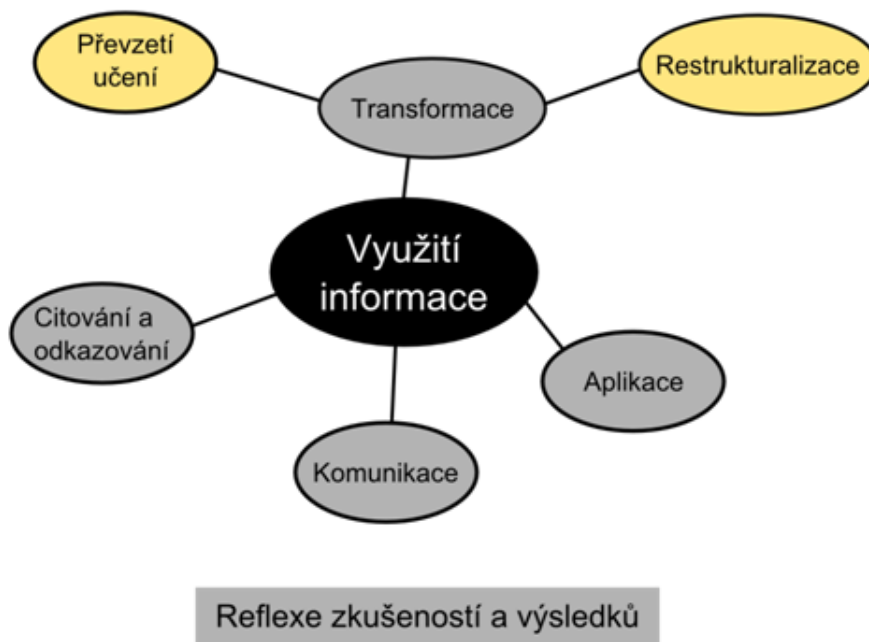
Obr. 4 Využití informace (Markless &amp; Streatfield, 2007, s. 32)

Obrázky 2, 3 a 4 představují to, co studenti vidí, když kliknou na příslušné políčko z obrázku 1. Těmito obrázky není předepsána žádná cesta; když je student na začátku projektu, může se podívat na obrázek 2 a rozhodnout se, že nejlepším způsobem, jak začít, bude vytváření sítě. Když klikne na vytváření sítě, získá několik nápadů na to, koho může oslovit a jak může pracovat s vrstevníky. Stejně tak může student začít u definování problému. Tento bod je opět naplněn činnostmi, nápady a radami, jak analyzovat problém.