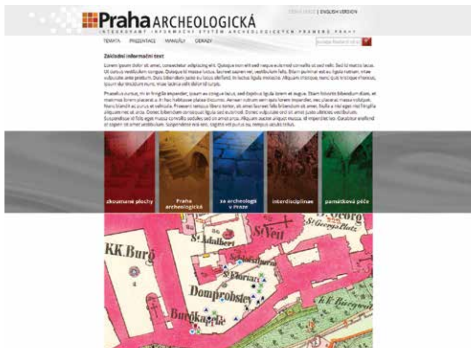
Obr. 7. Homepage projektu s ukázkou mapového zobrazení přehledu realizovaných analýz interdisciplinárního výzkumu. Styl zobrazení 1:1 000. Mapový podklad stabilní katastr ČÚZK. Abb. 7. Homepage des Projekts mit einer Probe wie die Übersicht der im Rahmen der interdisziplinären Untersuchung durchgeführten Analysen auf der Karte dargestellt werden. Darstellungsstil 1:1 000. Kartenvorlage stabiler Kataster des Tschechischen Instituts für Landesvermessung und Kataster.

prezentaci hodnot s archeologickým kontextem v centrální části města, jako jsou tzv. významné archeologické plochy na území Pražské památkové rezervace obsahující dosud výrazněji nepoškozené archeologické kontexty, případně v opačné poloze plochy, které již postrádají antropogenní nadloží, tedy místa s odstraněnou archeologickou vrstvou (sklepy, suterény novostaveb, podpovrchové dopravní stavby aj.). Doplněním k údajům o povaze a stavu archeologických hodnot budou údaje o skladbě kulturních památek a památkově chráněných území. Data této sekce vychází nebo jsou přímo přejímána z oborových databází vytvářených nebo spravovaných pracovišti Národního památkového ústavu prostřednictvím mapové služby.