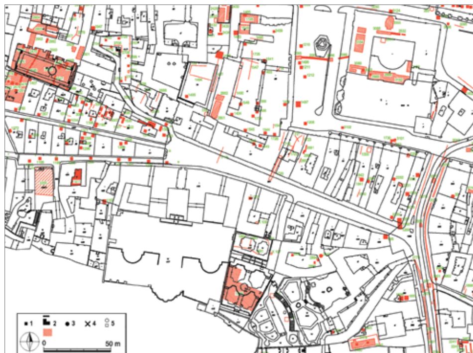
Obr. 3. Zobrazení prostorových dat MADB podle P. Starce (2009). Snímek z listu 242 (výřez). Abb. 3. Darstellung der Raumdaten der MADB nach P. Starce (2009). Aufnahme von Blatt 242 (Ausschnitt).

Východiskem pro vytvoření MADB v prostředí IIS_APP bylo rozhodnutí, že základní koncepce původního projektu L. Hrdličky bude v maximální možné míře respektována. Shodně jsou pojaty základní typy sond (bod, linie, plocha) a přesnost jejich lokalizace. Otázka evidence třetího – tedy vertikálního – rozměru, která měla v původním projektu zřejmě slabiny vzhledem k možnému subjektivnímu přístupu k evidovaným hodnotám, byla dořešena zavedením kategorie výškových referenčních bodů. Ty umožňují evidovat jak rozpětí základních kulturních horizontů (v detailu závislém na subjektivním rozhodnutí autora výzkumu), tak jejich přesné prostorové umístění.