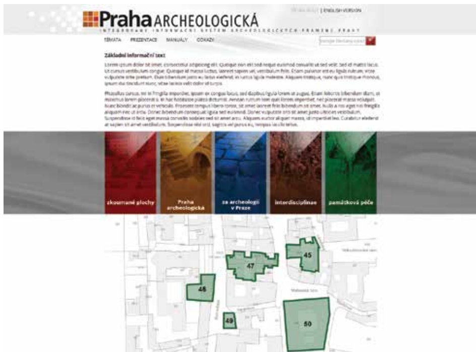
Obr. 6. Homepage projektu s ukázkou mapového zobrazení archeologicky významných ploch (přejetá data NPÚ). Styl zobrazení 1:1 000. Datový podklad (digitální katastrální mapa Prahy) © Institut plánování a rozvoje hl. m. Prahy.

Abb. 6. Homepage des Projekts mit einer Probe wie archäologisch bedeutende Flächen auf der Karte dargestellt werden (vom Nationalinstitut für Denkmalpflege übernommen Daten). Darstellungsstil 1:1 000. Datenunterlage (digitale Katasterkarte von Prag) © Institut für Planung und Entwicklung der Hauptstadt Prag.