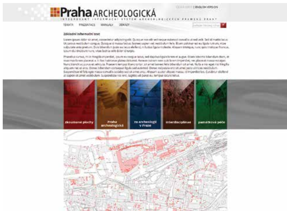
Obr. 5. Homepage projektu s ukázkou mapového zobrazení ADB. Styl zobrazení 1:1 000. Datový podklad (digitální katastrální mapa Prahy) © Institut plánování a rozvoje hl. m. Prahy.