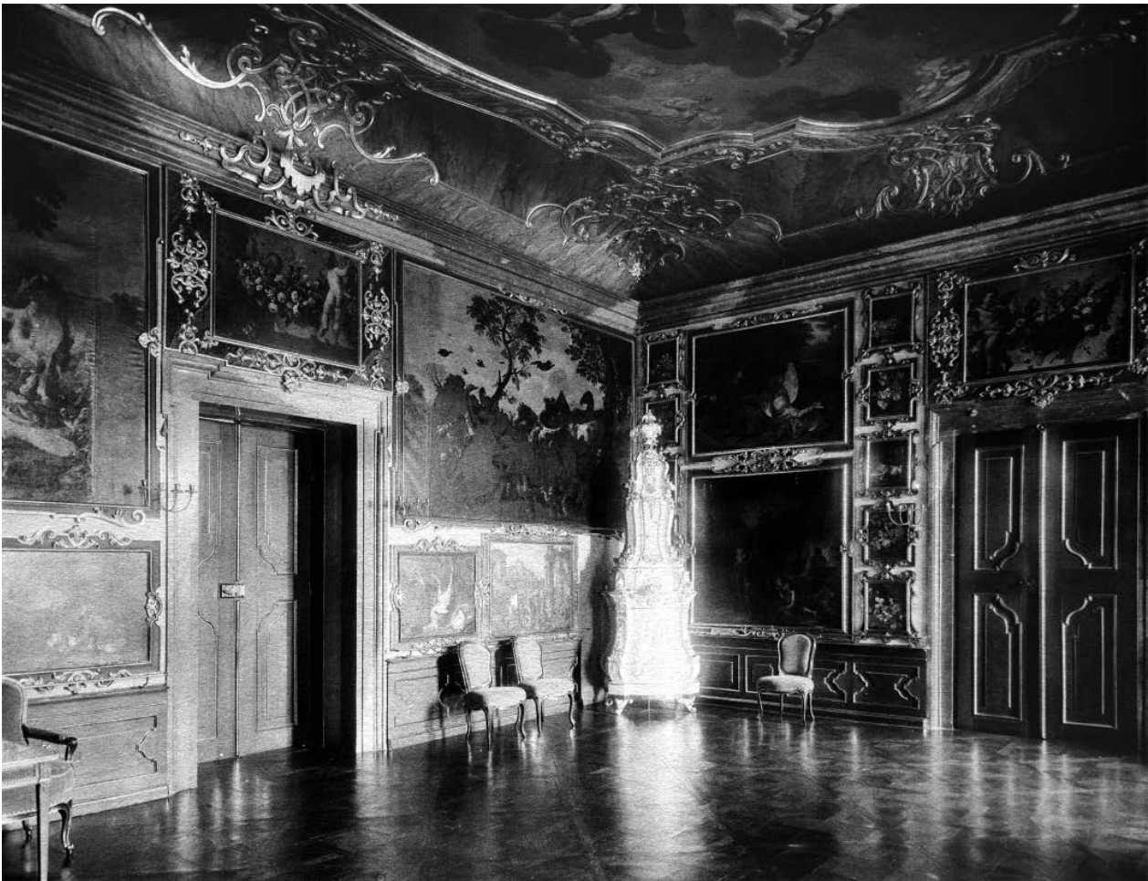
7 – Gemäldegalerie auf Schloss Feldsberg, Stand von 1913