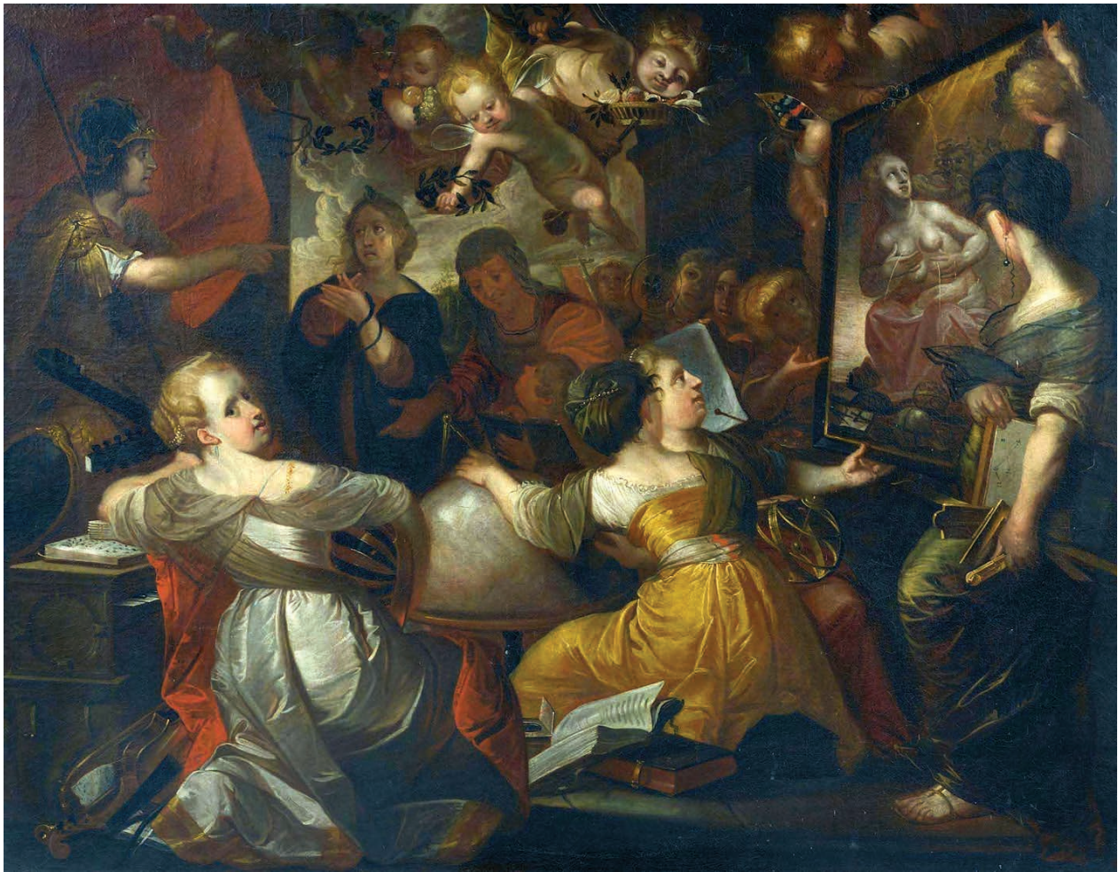
10 – Johann Hulsmann – Kopie 17. Jh., Minerva als Beschützerin der sieben freien Künste , um 1630, 2011 Auktion Koller Zürich