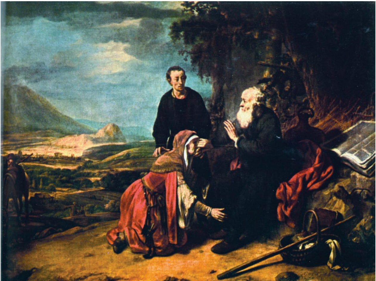
9 – Gerbrandt van den Eeckhout, Der Prophet Eliseus und die Sunamitin , 1664. Budapest, Szépművészeti Múzeum