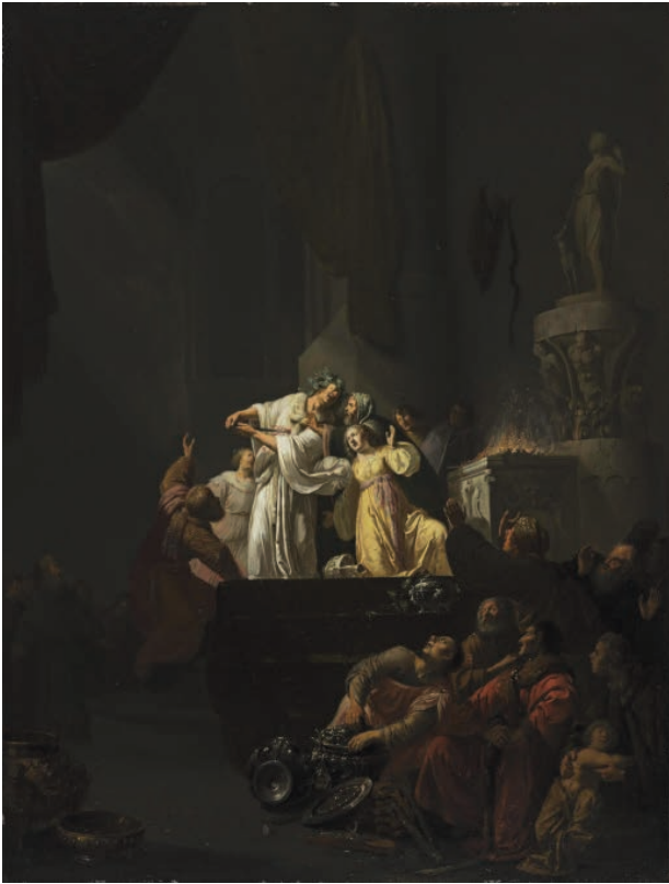
12 – Willem de Poorter, Koresos und Kallirhoe , 1635. Poughkeepsie, NY (USA), The Frances Lehman Loeb Art Center