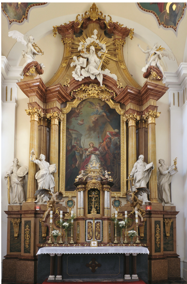
4 – Tomáš Schweigl a Ignác Günther, výzdoba hlavního oltáře , 1773–1783. Vidnava, kostel sv. Kateřiny

z roku 1753 pozlatit výzdobu stěn hostinských pokojů kláštera kvůli „ vyhnutí se deformitě “). 24 Smysl pro řád, symetrii a formální jednotu obecně představoval jedno z klíčových kritérií hodnocení kvality umělecké výzdoby v 18. století a podobným argumentům se tak příznačně dostávalo sluchu i za zcela změněných podmínek v době josefinských reforem a na začátku 19. století, kdy úředníci a státní účtárny opakovaně reagovali na podobné obavy z „deformovaného“ sakrálního prostoru v mezích možností s relativním pochopením a vstřícností. 25 Připomeňme rovněž, že řád, rovnováha a jednota byly v estetice 17. a 18. století pojmy úzce spjaté s kategoriemi harmonie a vznešenosti a že schopnost vnímat je byla považována za do značné míry distinktivní percepční dovednost. Ta byla výsadou spíše urozených a vzdělaných, neboť k jejímu osvojení vedla cesta skrze specifické formy výuky a studium například teorií sloupových řádů či perspektivy. Je tak patrné, že žadatelé z řad farního i řádového kléru komunikovali s představiteli státních úřadů prostřednictvím totožného pojmového aparátu používaného k definici a porozumění onoho vyššího estetického řádu, který byl úzce spjatý s imaginací raně novověkých elit.