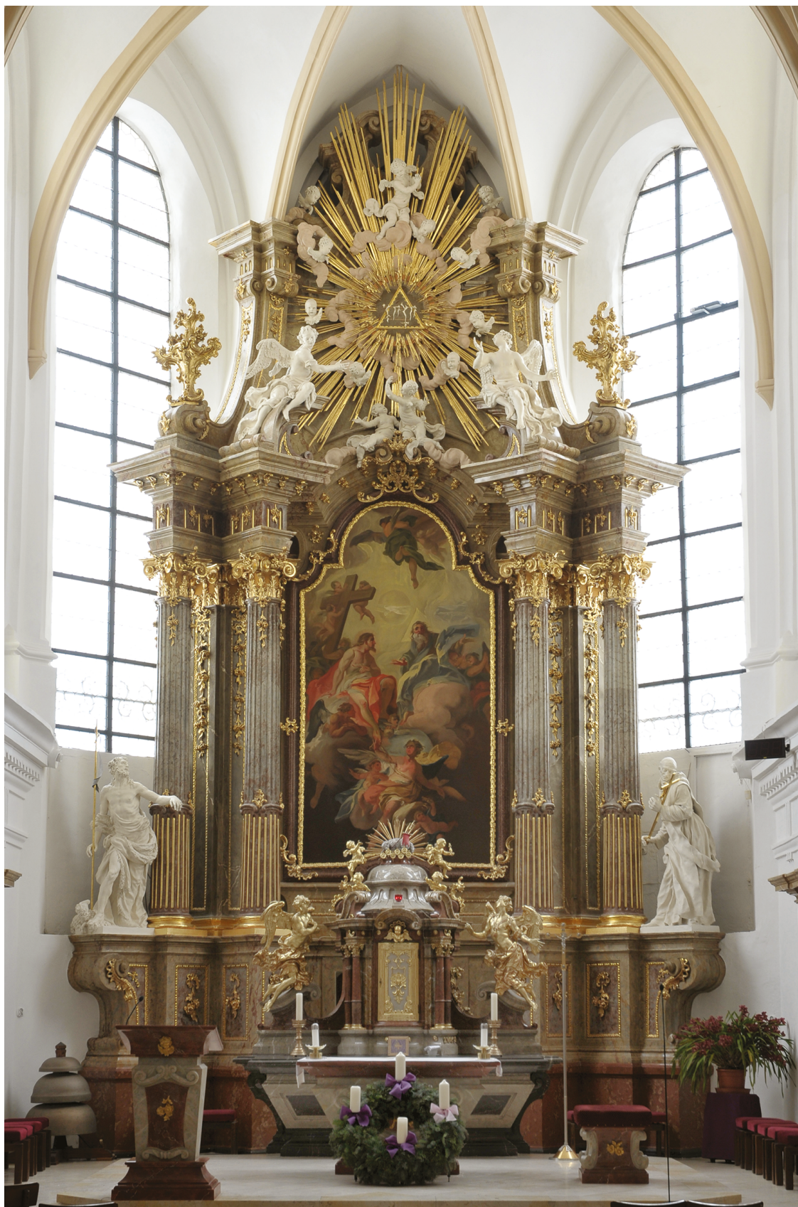
5 – Ondřej Schweigl a Josef Stern (novodobá kopie), výzdoba hlavního oltáře, 1763. Brno-Královo Pole, kostel Nejsvětější Trojice