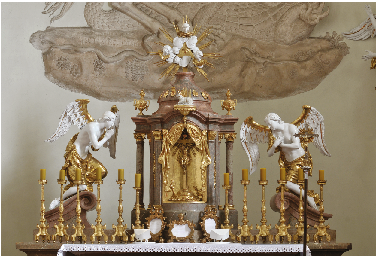
2 – Ondřej Schweigl, sochařská výzdoba svatostánku hlavního oltáře , 1790–1791. Velké Opatovice, kostel sv. Jiří

(1702–1784) o úředním zákazu zlatení oltářů a žádal jej jako investora o intervenci s poukazem na další mecenáše, kterým se v podobných případech podařilo vyjednat s úřady výjimky. Podle jeho vyjádření bylo do plátkového zlata do té doby investováno 3 000 zlatých a po získání úředního dobrozdání bylo vydáno v následujícím roce za zlatení a mramorování dalších bezmála 350 zlatých. 12 Povolení investic do drahocenného materiálu za více než 200 zlatých (jedna kniha s plátkovým zlatem přišla v padesátých a šedesátých letech přibližně na čtyři zlaté) bylo nicméně poměrně výjimečné. Takto vysoké částky většinou signalizovaly záměr zlatit architekturu oltářů i dřevěné sochy ve velkých plochách, k čemuž se však úředníci stavěli výrazně odmítavě a v řadě případů před ním investory výslovně varovali. Jako určité vodítko jim mohly sloužit rozpočty malířů a pozlacovačů, které bylo zřejmě doporučováno a někdy i explicitně požadováno přikládat k suplikám, neboť úřední rozhodnutí se na ně opakovaně odvolávají a několik jejich exemplářů se i dochovalo v přílohách spisů. Záleželo však přirozeně i na způsobu formulace žádostí. [obr. 1] Zatímco například vydání úředního povolení pro farní kostel v Prostějově z roku 1752 bylo s ohledem na vysokou částku 400 zlatých na výzdobu hlavního oltáře výslovně podmíněno zákazem celoplošného zlatení architektury a soch, v případě hlavní-