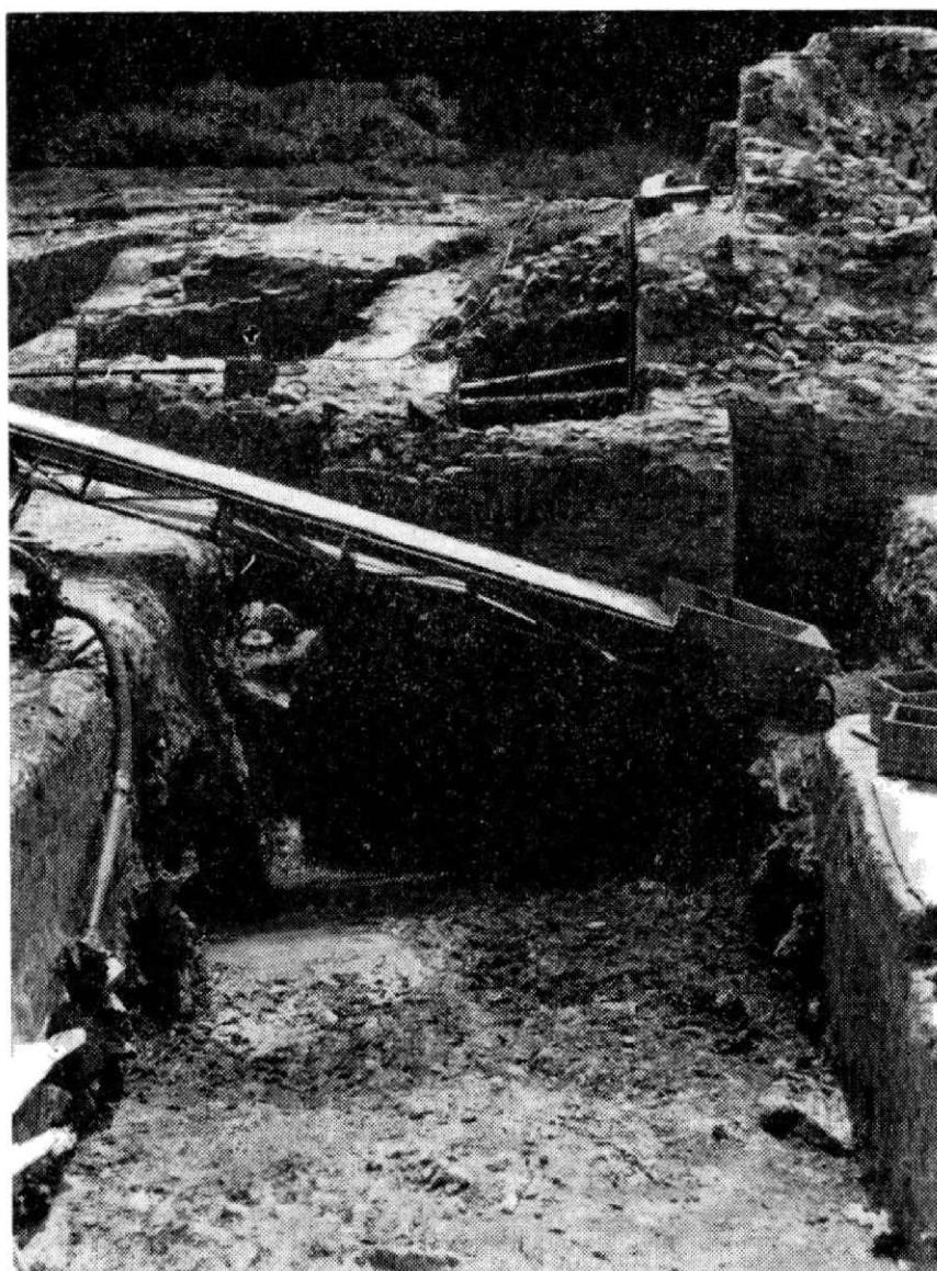
Obr. 3. Mstěnice, tvrz. Celkový pohled na zkoumanou plochu v r. 1967.