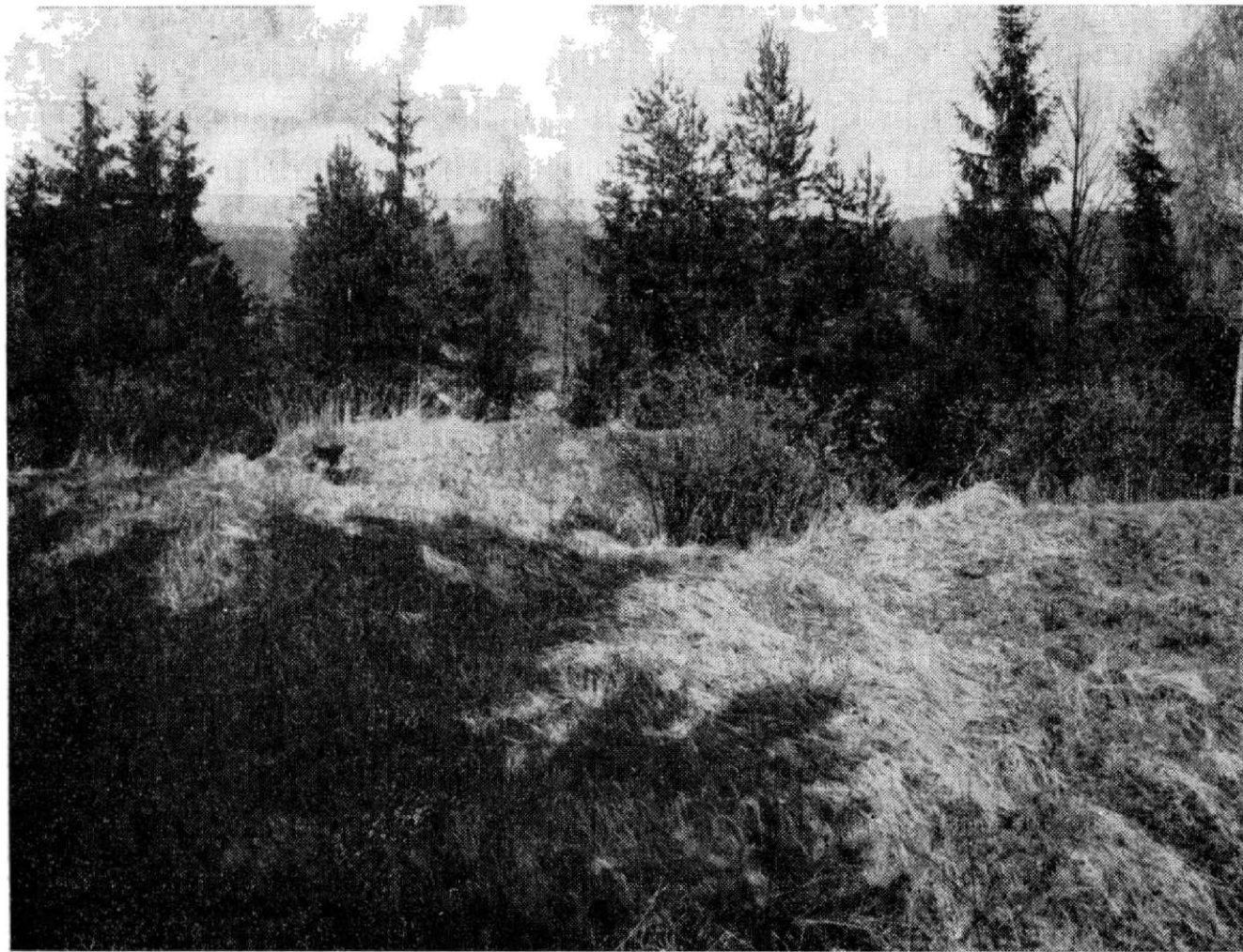
Obr. 2. Mstěnice, jižní hrádek.

Politicky se nižší šlechta projevila především v husitském revolučním hnutí. Z řady dokladů o její účasti připomeňme studii F. Hoffmanna (1967, str. 202 až 218), v níž upozornil na lapkovskou skupinu hrotovicko-budějovickou zapsanou v jihlavských popravčích zápisech. Členy této družiny byla rovněž řada