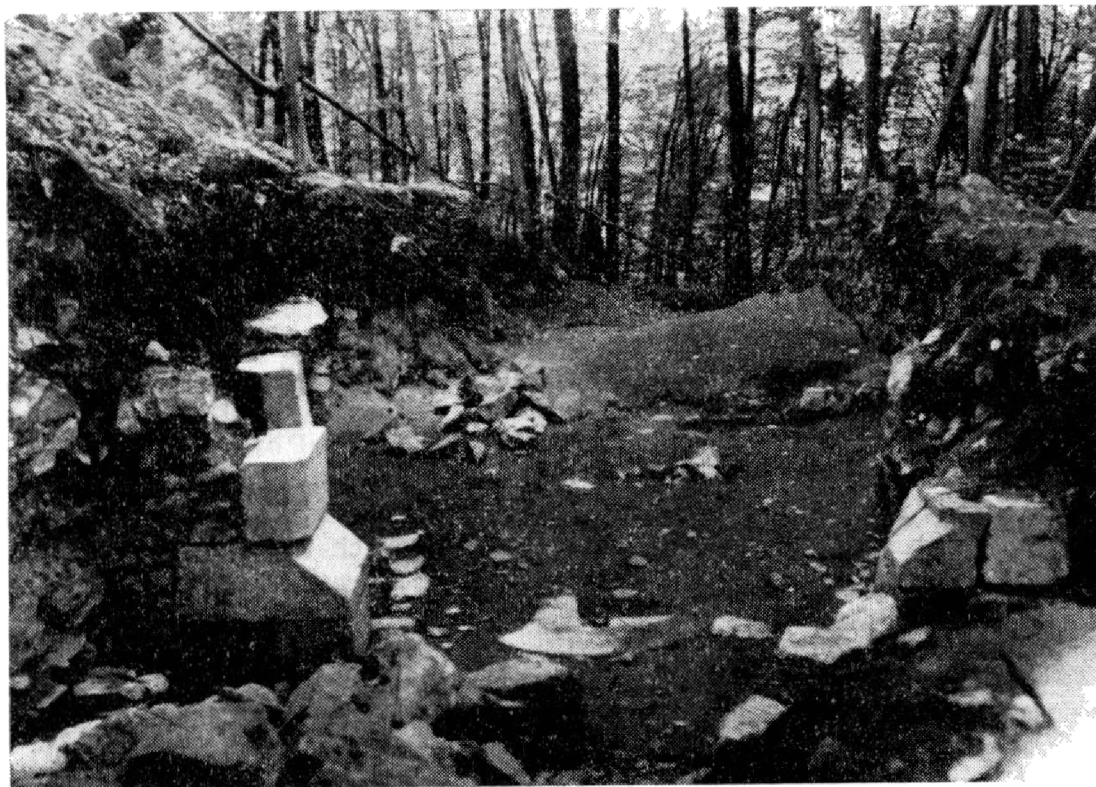
Obr. 4. Odkryv hradní brány – pohled od východu.

né časové zařazení dále potvrzují numismatické nálezy z areálu hradu. mj. též unikátní víčko schránky na brakteáty. 20