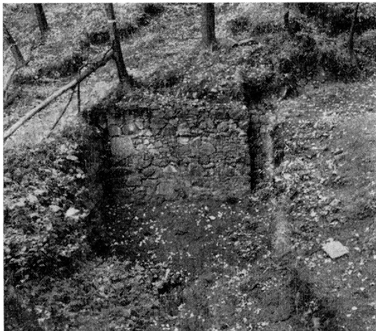
Obr. 3. Odkrytý pelopiliř parkánové zdi pro bývalý most.

i sídelních objektů, dále na východ. S podhradím byl hrad spojen ještě jinou, dnes dobře patrnou cestou, vedoucí přímo podél šíje ostrožny.