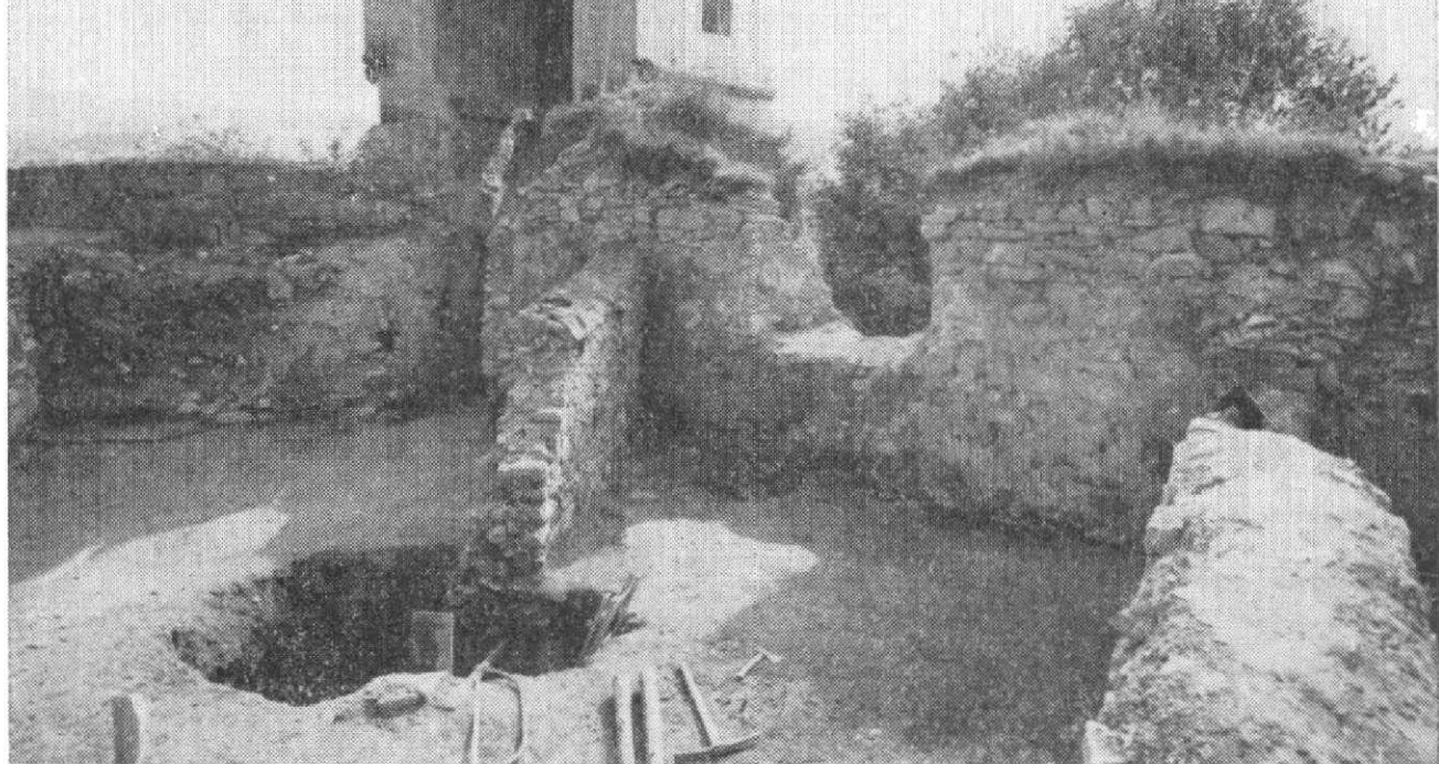
Obr. 2. Pohled na odkrytou část přízemí obvodové zástavby na jižním okraji hradního areálu, v pozadí diagonální věž opevnění, vpředu místo destrukce klenby suterenního traktu.

verní části areálu vlastního hradu odkryla základy nároží velké stavby pravděpodobně čtvercového půdorysu (věž?) a další sonda na předhradí zachytila část okrouhlé věže. V první sondě byla nalezena keramika z pol. 13. stol., což představuje zatím nejstarší horizont osídlení hradní ostrožny.