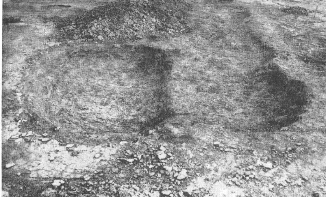
Obr. 1. Palonín. Objekt 100.

bou specifické hrnčířské výroby. V roce 1977 se zkoumala usedlost hrnčíře na jihozápadním okraji náměstí datovaná do 14.—poč. 15. stol., kterou tvořil obytný dům, pec na pálení keramiky a rozsáhlé střepiště v zahradách (Goš 1980). Na parcele byl před založením města postaven ve 2. pol. 13. stol. zahloubený dům se šikmým vstupem. V roce 1980 se podařilo v zahradách města zachytit dvě rozsáhlá střepiště, další výrobní objekty na malé ploše nebyly patrné.