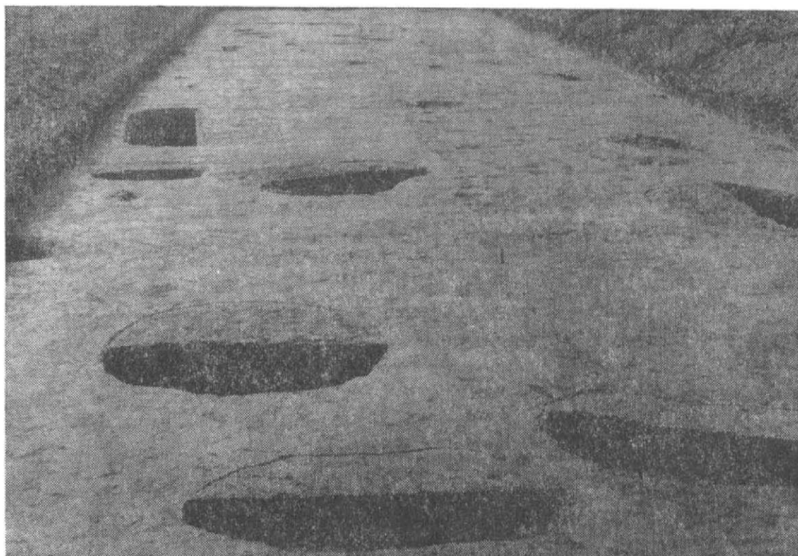
Obr. 3. Mohelnice. Část sídliště s jámami na zpracování tuhy.

V domovém půdorysu a zástavbě vsí došlo na severní Moravě v průběhu 13. stol. k výrazné diskontinuitě vývoje, v keramice, která je další výraznou skupinou hmotných památek sledujeme plynulý vývoj od doby slovanské až do pozdního středověku. Ve střední době hradištní se v domácnostech používaly jen nižší baňaté hrnce vyrobené podomácky z hlíny silně promíšené tuhou. Teprve na počátku mladší doby hradištní se výrobní sortiment rozšířil o zásobnice, mísy, nádoby s válcovitým hrdlem aj. Nádoby již vyráběli specializovaní řemeslníci, do hlíny se i nadále přidávalo velké množství tuhy. Grafitová surovina se získávala v ložiscích u Svinova, transportovala na sídliště do Mohelnice, zde se drtila a mísila do keramické hmoty. Výzdoba nádob byla velmi jednoduchá, tvořily ji vodorovné žlábký a šikmé vrypy, pouze zásobnice měly