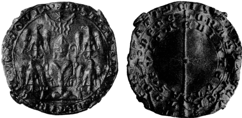
Obr. 4 a 5. Hradec Králové, Hořická ul. Poutní odznak s vyobrazením sv. Stanislava nalezený v obj. 74C, avers a revers.