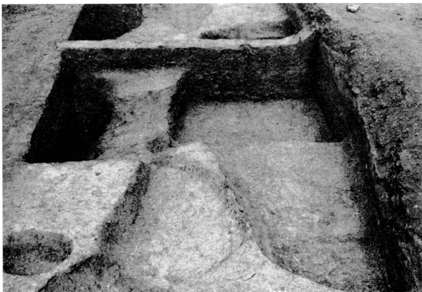
Obr. 3. Hradec Králové, Hořicka ul., objekt 74C. Pohled od J.

Z popisu na aversu a reversu a ze srovnání s dosud známými existujícími díly shodného ikonografického typu se jednoznačně potvrdilo, že máme před sebou čtvrtý exemplář poutního odznaku s vyobrazením sv. Stanislava, krakovského biskupa Stanislava Szcepanského. Text i obraz poutního odznaku se úzce vztahují k legendě o mučednické smrti sv. Stanislava. V době přípravy našeho příspěvku byl vydán sborník Peregrinationes s článkem A. Zurka (1995, 335), v němž je uveden nález poutního odznaku v Sobótce ve Slezsku. Ke čtyřem stávajícím exemplářům z česko-moravského prostředí přibyl pátý, zatím jediný známý příklad z dnešního území Polska. U prvních dvou, pocházejících původně z českých soukromých sbírek, neznáme ovšem místo původu resp. nálezu (dnes v Národním muzeu). Třetí poutní odznak shodného typu byl objeven při archeologickém výzkumu v roce 1973 v Černé Hoře v okrese Blansko. Publikoval naposledy Z. Měřínský (1990, 139–141) a W. Mischke (1985, 17). Řadu českých exemplářů zatím uzavírá náš poslední nález z Hradce Králové.