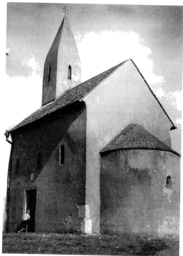
Obr. 1. Kostol sv. Michala v Dražovciach. Pohľad z juhozápadu na ostrožskú lokalitu s kostolom.