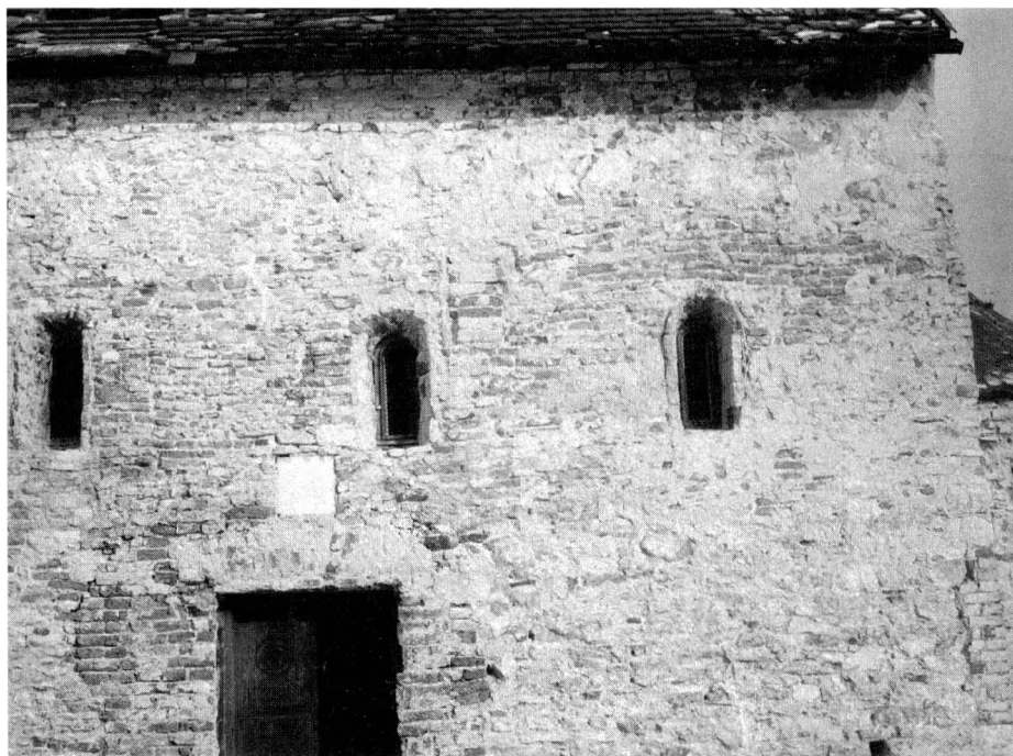
Obr. 3. Časť južnej fasády po odstránení omietok.