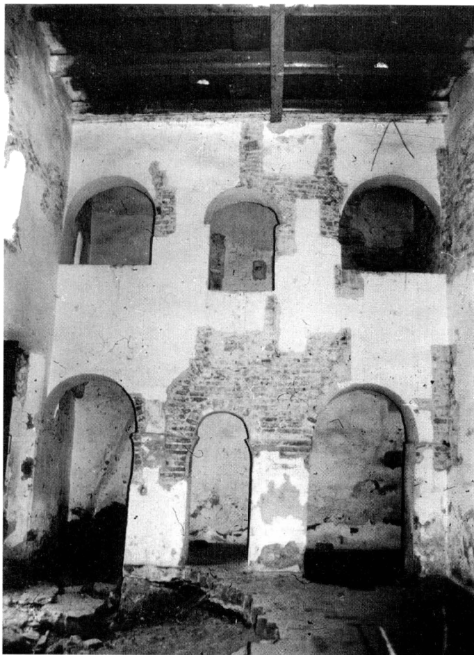
Obr. 5. Pohľad na emporu počas výskumu.

rozperné oblúky, preväzujúce murivo empory so západným múrom lode. Prístup na ňu bol zrejme obdobne ako dnes dreveným rebríkovým schodišťom v juhozápadnom poli.