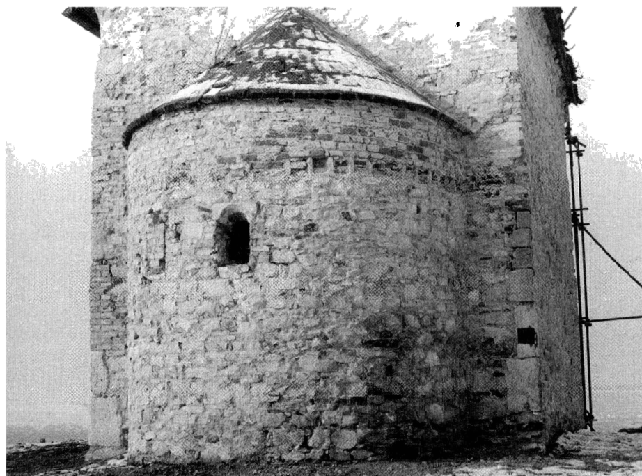
Obr. 4. Apsida po odstránení omietok.