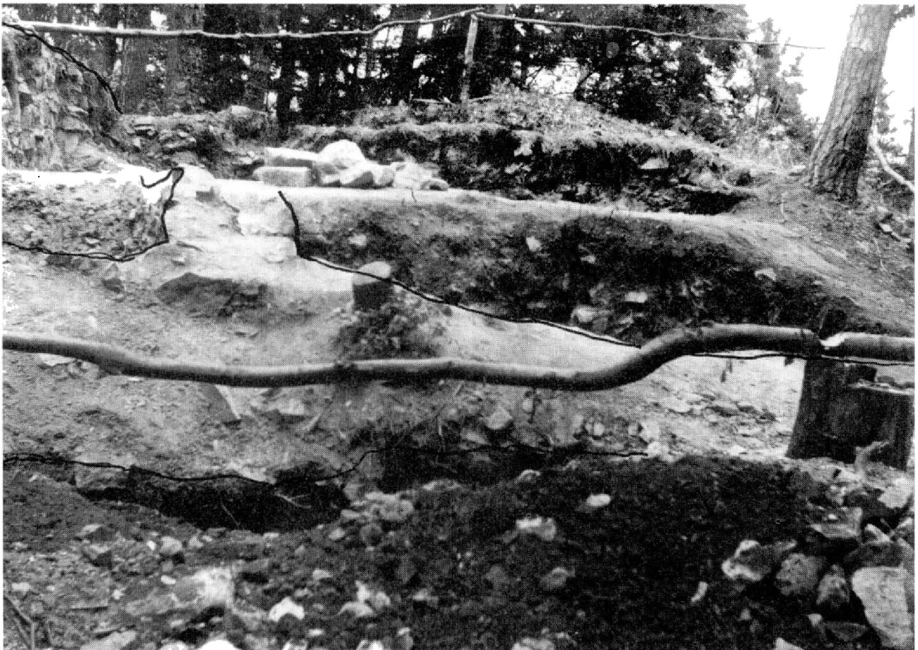
Obr. 2. Banská Štiavnica – Staré mesto, okr. B. Štiavnica. Výskum obytnej veže s prístavbami na Polohe 1.

Na začiatku banských prác v štiavnickej oblasti bolo, aj keď nie silné, banícke združenie s rovnoprávnymi členmi (Marsina 1990, s. 18). Takto sem prichádzajúce a tu pracujúce komunity si zakladajú trvalé sídla pri výstupoch žíl na povrch. (V budúcnosti bude potrebné overiť vzťah poľnohospodárskeho zázemia Banskej Štiavnice v tomto, prípadne i staršom období, pretože banícka a hutnícka práca v tom čase mala sezónny charakter.) Budúci archeologický výskum bezprostredne susediacich osád s Banskou Štiavnicou – Banská Belá, Štiavnické Bane, Banská Hodruša – môže potvrdiť existenciu osídlenia v ich terajšom intraviláne už na prelome 12. a 13. stor. Koniec-koncov dve z uvedených osád (Banská Hodruša, Banská Belá) predstavovali v počiatkoch stredoveku súčasť chotára Banskej Štiavnice. Takýmto spôsobom farský kostol Panny Márie na Starom zámku sústredoval veriacich z viacerých banských osád, a preto aj existencia dvoch pomerne veľkých románskych stavieb od polovice 13. stor. tu nie je prekvapením.