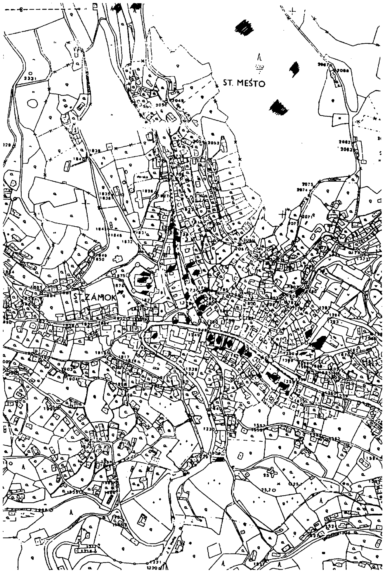
Obr. 1. Banská Štiavnica – pôdorys mesta s vyznačením skúmaných objektov, resp. areálov (PÚ, SBM, AÚ SAV). Kresba – autor.