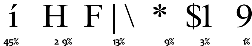
Tab. 1. Bmínské poháry.