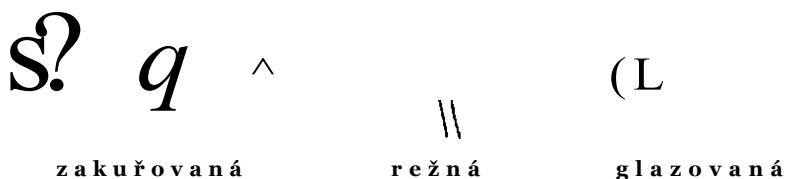
Tab. 3. Mísy: zakuřovaná keramika, režná keramika, glazovaná keramika.

Tvarově nejpestřejší je skupina glazované keramiky. Pokud lze sledovat tvary hrnců jsou soudkovité, jeden torzovitě dochovaný tvar se blíží kulovitému (s uchem). Okraje