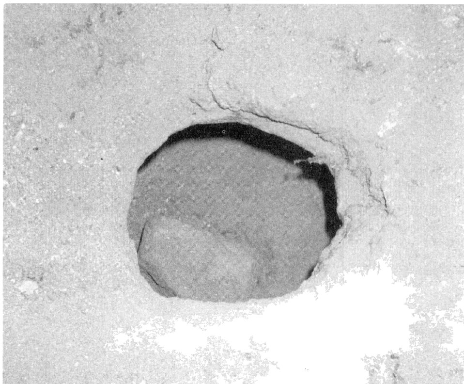
Obr. 2. Cheb, keramická akustická nádoba s proraženým dnem a dodatečně zazděným hrdlem.

Podrobnější zpracování pozapomenutých akustických nádob, zaznamenaných J. E. Woclem v minulém století ve zdivu rotundy sv. Kříže na Starém Městě pražském (Wocel, 1865) prokázalo, že jde patrně zatím o nejstarší aplikaci těchto nádob v Čechách, pocházející zřejmě již ze 12. století (Dragoun 1994).