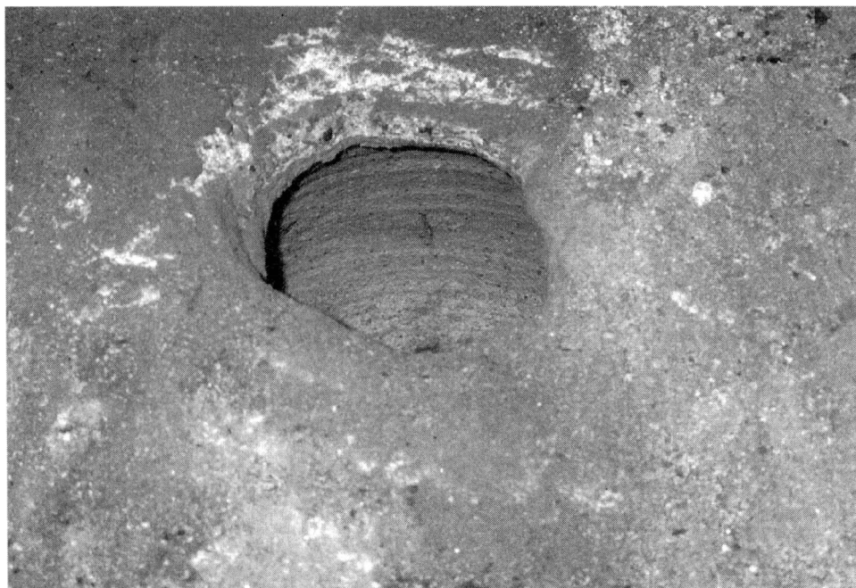
Obr. 1. Cheb, kostel minoritského kláštera, keramická akustická nádoba s proraženým dnem v klenební kápi presbytáře.

Ozvučnicové nádoby byly v Čechách v novější době nejprve zjištěny v klenbě presbytáře kostela sv. Bartoloměje v Pošné, o. Pelhřimov. Nález byl publikován v r. 1957 (Petr, 1957), avšak ještě dlouho poté byl zřejmě považován za jakousi marginální kuriozitu, neboť v syntetických pracích, v nichž byl kostel v Pošné jinak způsobem adekvátním jeho významu zastoupen, nádoby zaznamenány nebyly, přestože tvoří integrální součást stavebního organismu (Kuthan 1977, 229–230; Poche a kol. 1980, 142–143). Rozměrná akustická nádoba osazená ve zdivu, nikoli v klenbě, byla brzy na to nalezena při archeologickém výzkumu kostela zaniklého benediktinského kláštera na Ostrově u Davle (Špaček, 1963). Další ozvučnice byly zaznamenány až poměrně nedávno v klenbě presbytáře v kostele sv. Havla v Myšenci (Varhaník–Zavřel 1989), na nález jednotlivé ozvučnice v kostele Zvěstování P. Marie v Dobrušce upozornil J. Fröhlich (1990), dále byly ozvučnicové systémy zjištěny v kostele sv. Martina ve Vrchotových Janovicích (o. Benešov) a v kostele sv. Vojtěcha v Jílovém (Jesenský 1995)*.