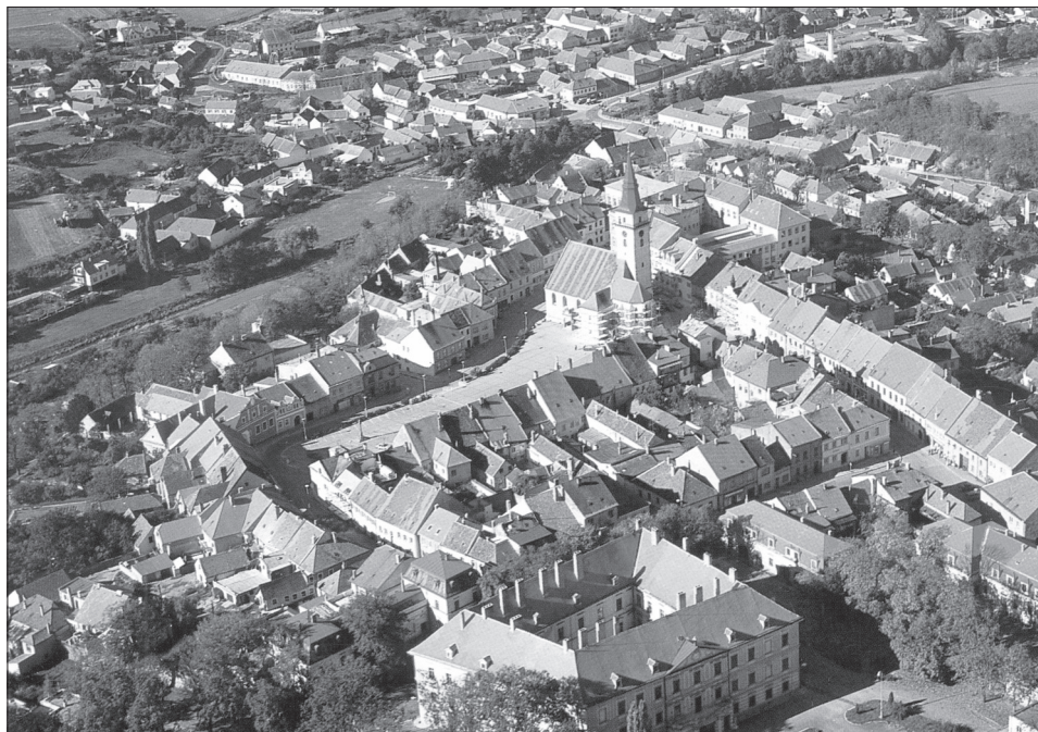
Obr. 4. Letecký pohled na městské jádro od jihovýchodu, v popředí zámek, v pozadí Podolí.