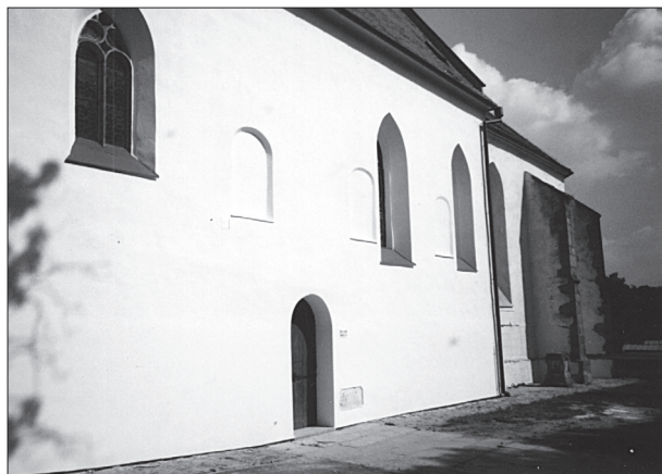
Obr. 2. Románská loď kostela sv. Jakuba od jihozápadu.

Lothara III. v roce 1132 (Novotný 1913, 621). Zdálo by se, že jemnické úřední knížátko od Pešiny převzal jeho současník Bohuslav Balbín, ale ten s odvolávkou na ony Třebíčské anály dal pohřbít Jaromíra v Třebíči v roce 1138, ovšem předtím ho ještě nechal klášter obdařit neznámou (českou?) vsí Jiřín (Balbín 1687, 105). Podle odlišnosti údajů se proto zdá, že Balbín neopisoval, ale zároveň by to bylo možné, kdyby oba měli k dispozici dvě rozdílné verze análů. Na rozdíl od V. Novotného (1913, 622), který existenci análů zřetelně zpochybnil, L. Hosák (1955, 84) se za ně postavil a názor na ně mezi historiky kolísá (srov. Wihoda 2000, 100; Fišer 2001, 67). Není účelem problém rozřešit, pokud je to vůbec možné, ale pro „jemnický úděl“ je to otázka vpravdě hamletovská. Nicméně oba barokní historici zemského archiváře A. Bočka povzbudili k pokračování v jeho „tvůrčí“ činnosti a jeho falzům podlehl i F. Palacký.