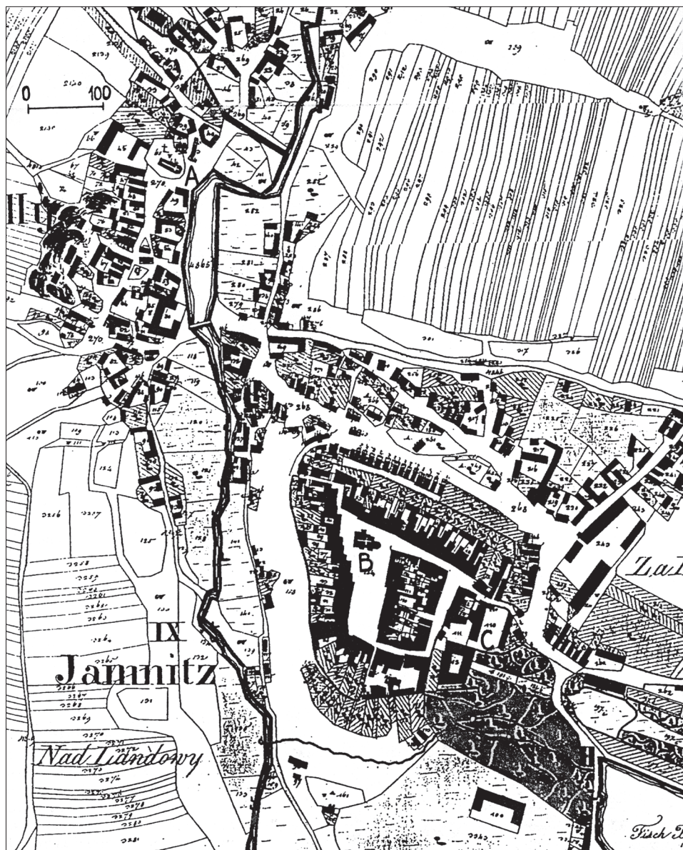
Obr. 3. Situace místní části Podolí s kostelem sv. Jakuba (A), města Jemnice s kostelem sv. Stanislava (B) a zámek (bývalým hradem – C) na mapě stabilního katastru z r. 1824. Publikoval K. Kuča (1997).

I když Jemnice ve 12. století neměla význam úředního centra, již v první třetině dosáhla úrovně lokálního střediska. Svědčí o tom stojící věž, součást románské rotundy, jejíž základy