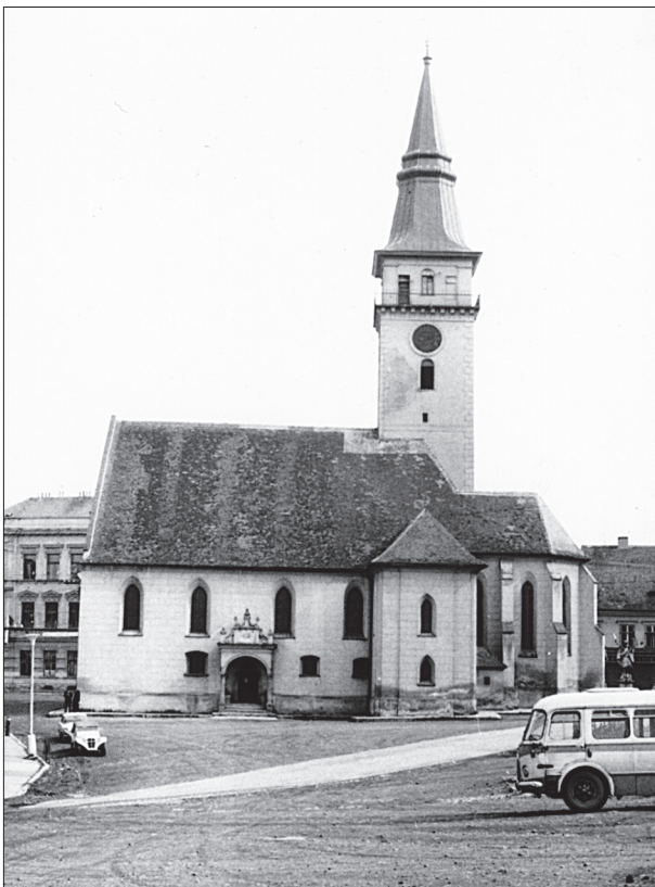
Obr. 7. Farní kostel sv. Stanislava od jihu v roce 1969.

ale přesto naplňují představu kastelu inspirovaného pravidelnými francouzskými hrady (Plaček 1996, 185; 1997, 201; Koběrská–Macek 1997, 99, 114). Krom toho nic nenasvědčuje románskému původu jemnických hradeb, pro jejichž stavbu okolo roku 1227 mimo onu listinu prostě není jiného dokladu. Vždyť i mnohem významnější Znojmo v roce 1226 vymezoval jen příkop a kamenné hradby se stavěly v průběhu velké části 13. století (Razím 2003, 21). V Brně, jehož zděné opevnění patří k nejstarším, vznikla hradba do poloviny 13. století (Procházka 2000, 122–124). Naproti tomu nálezy v jemnickém hradním parkánu vypovídají o existenci jemnické hlavní hradby, s parkánovou zdí hradu svázané, ve 14. století. O existenci hradby v roce 1327 nepřímo vypovídá velké privilegium krále Jana Lucemburského, v němž se hovoří o městských věžích (CDM VI, 254, č. 325).