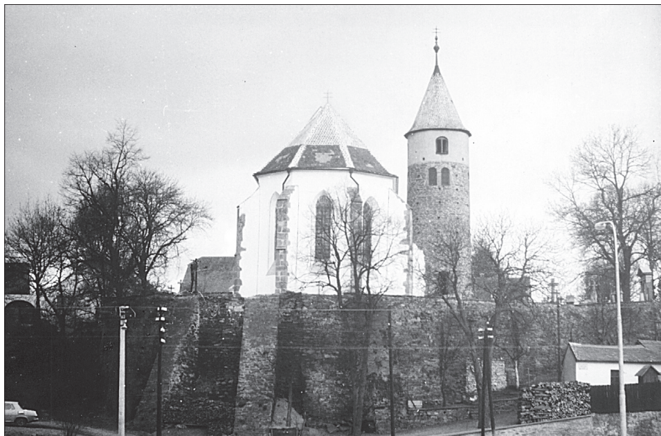
Obr. 1. Kněžiště kostela sv. Jakuba a věž rotundy v prostoru předpokládaného dvorce v Podolí při pohledu od Želetavky v roce 1970.