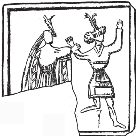
Obr. 9. Sv. Alžběta Durynská (?) s postiženým. Kachlový reliéf, konec 15. století, Praha, Staré a Nové Město (kresebná rekonstrukce).

Abb. 8. Hl. Elisabeth von Thüringen mit einem Behinderten. Kachelrelief, Ende 15. Jahrhundert, Třešť, Stadt.