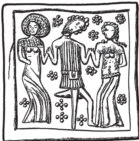
Obr. 10. Sv. Alžběta Durynská s pomocnicí a postiženým. Kachlový reliéf, kolem 1500, Landštejn, hrad.

Abb. 9. Hl. Elisabeth von Thüringen (?) mit einem Behinderten. Kachelrelief, Ende 15. Jahrhundert, Prag, Alt- und Neustadt (Zeichenrekonstruktion).