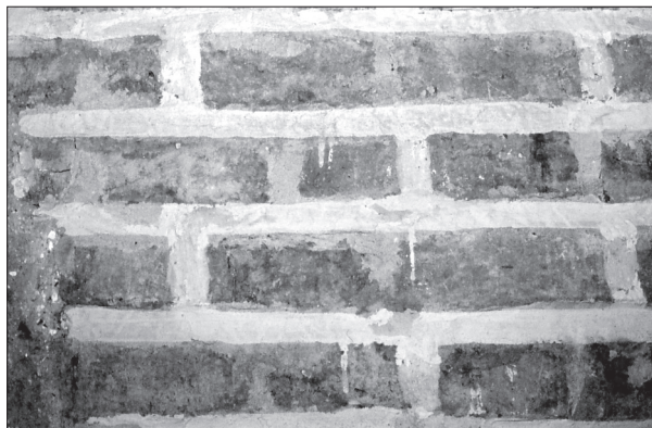
Obr. 12. Šamorín, linková sieť namalovaná na murive.

Abb. 12. Šamorín, auf dem Mauerwerk aufgemaltes Liniennetz.