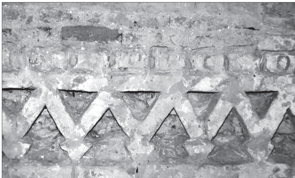
Obr. 7. Šamorín, podstrešný vlys.

Abb. 6. Malá Mača, Fund eines Frieses an der Südwand des Schiffes.