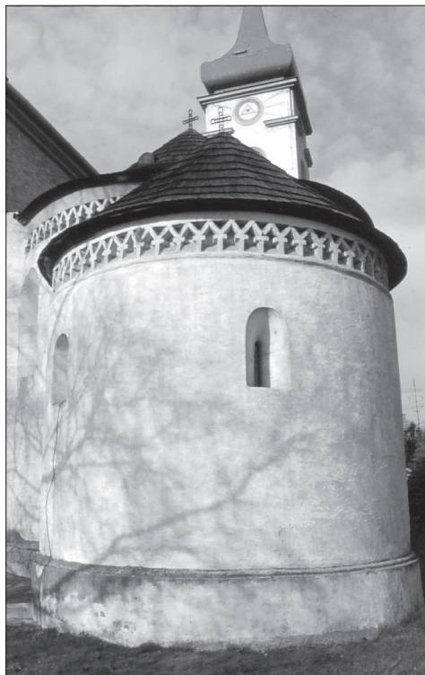
Obr. 3. Křižovany, apside.