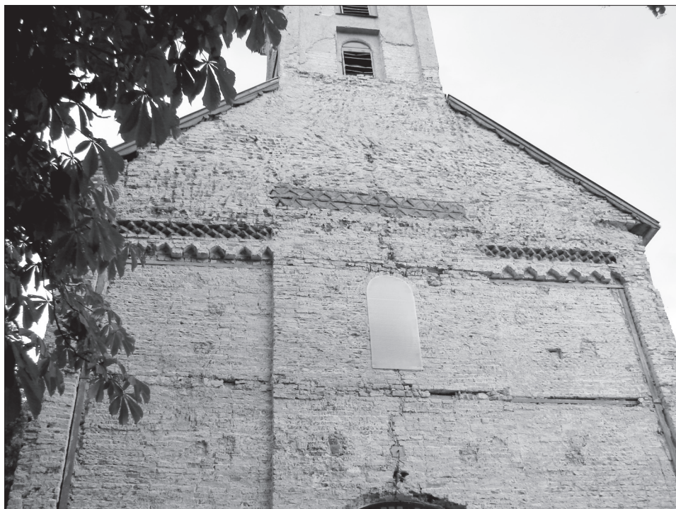
Obr. 4. Velká Třina, západná fasáda.