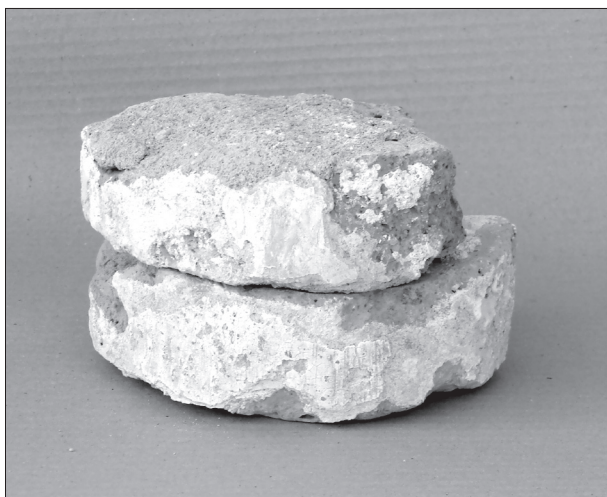
Obr. 9. Šivetice, nález tvaroviek.