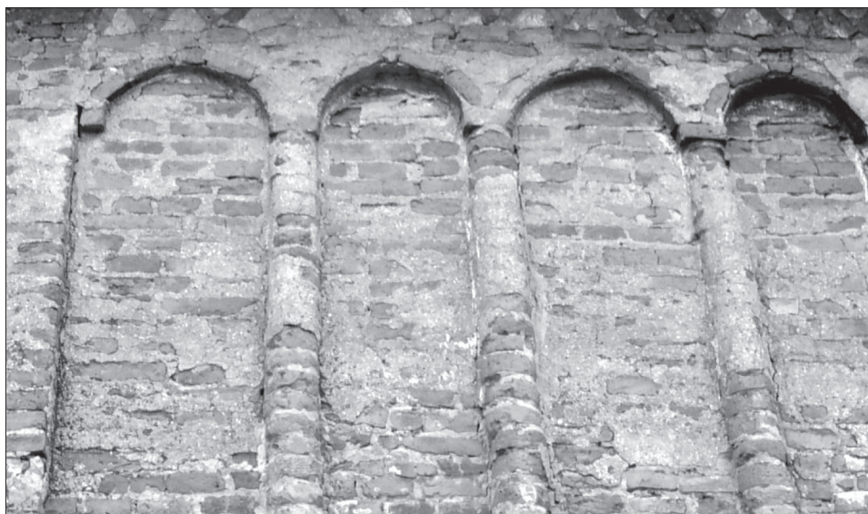
Obr. 2. Čierny Brod – Hegy, južná stena. Abb. 2. Čierny Brod – Hegy, Südwand.