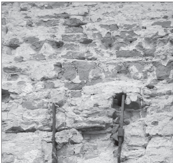
Obr. 6. Malá Mača, nález vlysu na južnej stene lode.

Abb. 6. Malá Mača, Fund eines Frieses an der Südwand des Schiffes.