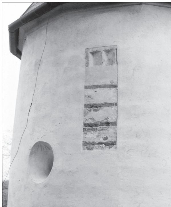
Obr. 13. Dechtice, apside. Foto autor.

Abb. 12. Šamorín, auf dem Mauerwerk aufgemaltes Liniennetz. Foto Verfasser.