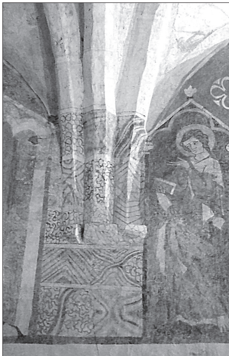
Obr. 11. Šamorín, rebrová klenba v presbytériu. Abb. 11. Šamorín, Rippengewölbe im Presbyterium.