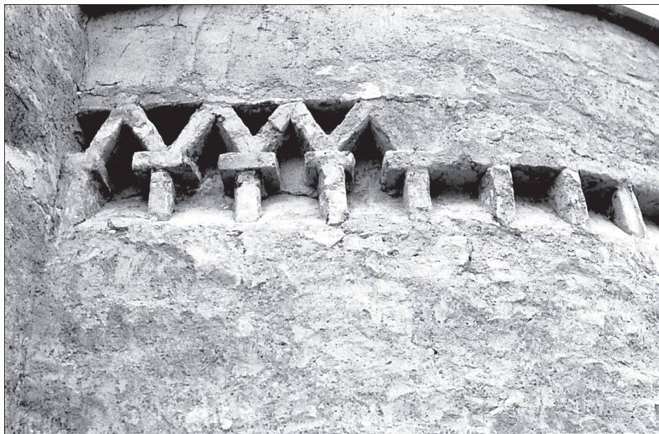
Obr. 5. Dražovce, apside.