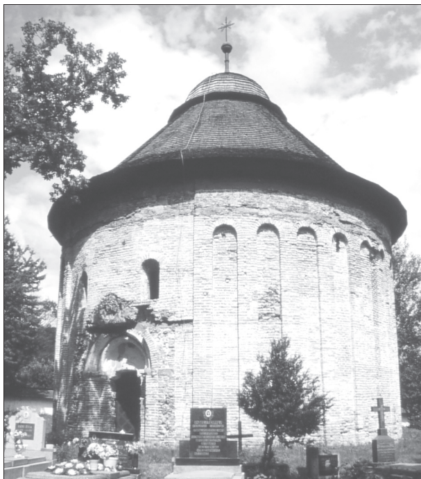
Obr. 8. Šivetice, rotunda.