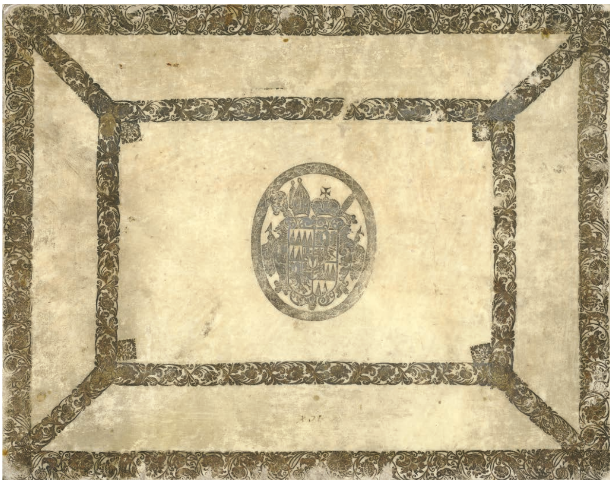
4 – Květná zahrada – grafické album, výzdoba pergamenového pokryvu. Vědecká knihovna v Olomouci