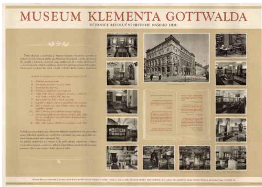
Obr. 3: Plakát Museum Klementa Gottwalda. Učebnice revoluční historie našeho lidu (autor neuveden, nakladatelství Orbis, 1955). Národní muzeum, Sběrka Muzea dělnického hnutí, H11P-91.

bojovníka, s nimiž se může většina pracujících ztotožnit. Nejen běžné zaujetí vizualitou barvy a textu, ale právě kompozice scény a výběr aktérů, oslovuje potencionální návštěvníky výstavy – masy pracujících. Plakát z produkce národního podniku pro průmysl grafický a nakladatelství Melantrich 56 byl využit nejen pro kampaň ve veřejném prostoru, ale i na obálku 8. svazku Aktualit v obrazech . 57 Dopad propagace volně prodejným tištěným médiem je zřejmý, když zjistíme, že jeho 6. svazek téhož roku byl věnován vítězství našich hokejistů na MS ve Stockholmu. V 70. a 80. letech je motiv Čumpelíkova dělníka použit na plakátech či předmětech k výročí LM. Bohužel, i když i v dalších letech vznikaly kvalitní autorské předlohy, většinou pro politické plakáty, tak MKG se tímto směrem nevydalo.