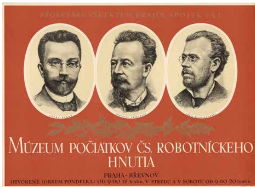
Obr. 1: Plakát Múzeum počiatkov čs. robotníckeho hnutia (autoři Jaroslav Kaiser a Jindřich Koukolský, nakladatelstvím Svoboda, 1953). Národní muzeum, Sbířka Muzea dělnického hnutí, H11P-309.

části článku jsou konkrétní znaky aspektů propagandy součástí rozboru plakátů.