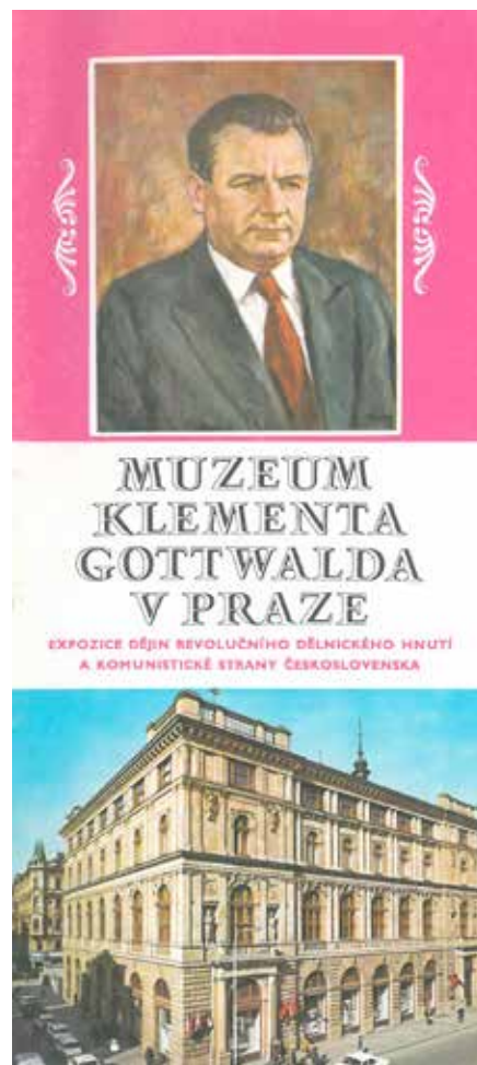
Obr. 2: Brožura Muzeum Klementa Gottwalda v Praze. Expozice dějin revolučního dělnického hnutí a Komunistické strany Československa. Praha: ORBIS, nedatováno (po 1974).

MKG, muzeum dějin KSČ a revolučních bojů čs. lidu (po roce 1974 upraveno na dějin revolučního dělnického hnutí), zaniklo k 31. lednu 1990. Ovšem díky zachování většiny jeho fondů v rámci jednoho celku, lze průběžně v dostatečném časovém odstupu pracovat s artefakty i archiváliemi v novém kontextu a zároveň poznávat koncepci a vývoj vzorového muzejního pracoviště své doby. Jako ústřední stranické muzeum, instituce podléhající přímé ideové i správní kont-