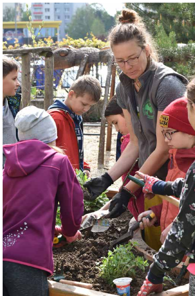
Obr. 5: Vzdelávanie v ekozáhradke.

lektori a odborní pracovníci, mnohokrát v podobe kumulovaných funkcií. Nakoľko SMOPaJ má odborníkov na viaceré oblasti, ako je geológ, botanik, zoológ, paleontológ, archeológ alebo jaskyniar, je schopné poskytnúť pre návštevníkov široký záber vedomostí a najmä skúseností v oblasti prírodných vied. Okrem nich sa na vzdelávaní podieľajú pedagógovia z praxe (múzejný pedagóg, špecialista pre MŠ a 1. stupeň ZŠ), čím zabezpečuje aj metodicky a didakticky kvalitné vzdelávanie.