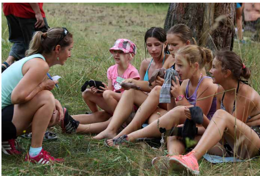
Obr. 2: Poznávanie liečivých bylín čuchom (Foto: A. Lenková, Archív OPAJ).

zážitku a skúsenosti. Kladieme dôraz na možnosť kontaktu s objavovanými predmetmi a javmi, čím návštevníci môžu pochopiť svet vedy ľahšie a zábavnejšie. Rozmanitosť našich rastlín poznávame pomocou živých ukážok, pri ktorých využívame aj iné zmysly (Obr. 2). Pri úlohách poznávame bylinky podľa čuchu, rôzne prírodniny hádame pomocou hmatu. Chuť zase používame pri rozoznávaní zloženia minerálnych vôd alebo poznávanie bylín pri ochutnávaní bylinkových čajov. Tieto zmyslové úlohy a cvičenia využívame nielen pri výučbe zdravých detí, ale aj v prípade marginalizovaných skupín. Ríšu živočíchov spoznáваме od mikroskopických foriem až po naše najväčšie cicavce. Najmä pri vzácných a ohrozených druhoch využívame prácu so zbierkovými predmetmi múzea, ktoré môžu účastníci naživo vidieť, poznávať, a tak sa na príbehu zbierky učiť o ich živote, výskyte, ohrození a ochrane. Oblúbeným medzi všetkými vekovými kategóriami je pozorovanie pomocou mikroskopickej techniky. Prostredníctvom nej demonštrujeme nielen mikroskopické organizmy,