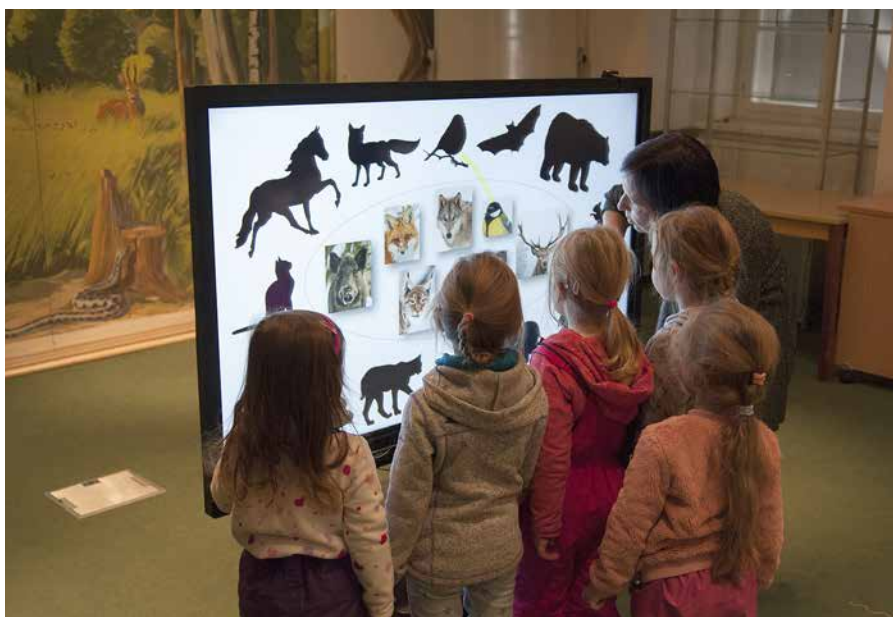
Obr. 1: Práca s interaktívnou tabuľou.

aj celosvetových akcií, ako je napr. Noc múzeí a galérií na Slovensku , Noc literatúry , Dni európskeho kultúrneho dedičstva , Týždeň vedy a techniky a tiež organizuje vlastný Deň otvorených dverí v Archíve OPaJ , Čítanie z archívu a knižnice SMOPaJ a interaktívne čítanie pre deti .