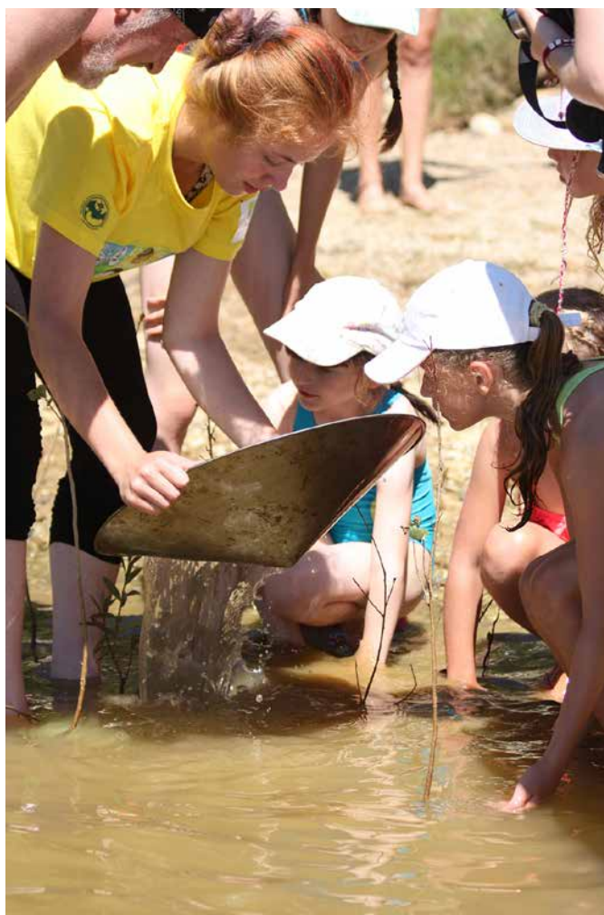
Obr. 4: Ryžovanie zlata počas detského letného tábora – Malí ochránari.