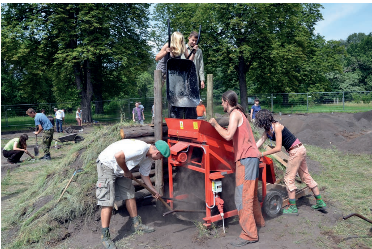
Obr. 6. Břeclav – Pohansko. Severovýchodní předhradí. Využití mechanizace při prosívání antropogenních sedimentů s archeologickými nálezy.

Dokumentace profilů je fotografická a kresebná na milimetrový papír. Pouze v ojedinělých případech je prováděna fotogrammetrická dokumentace profilu, a to