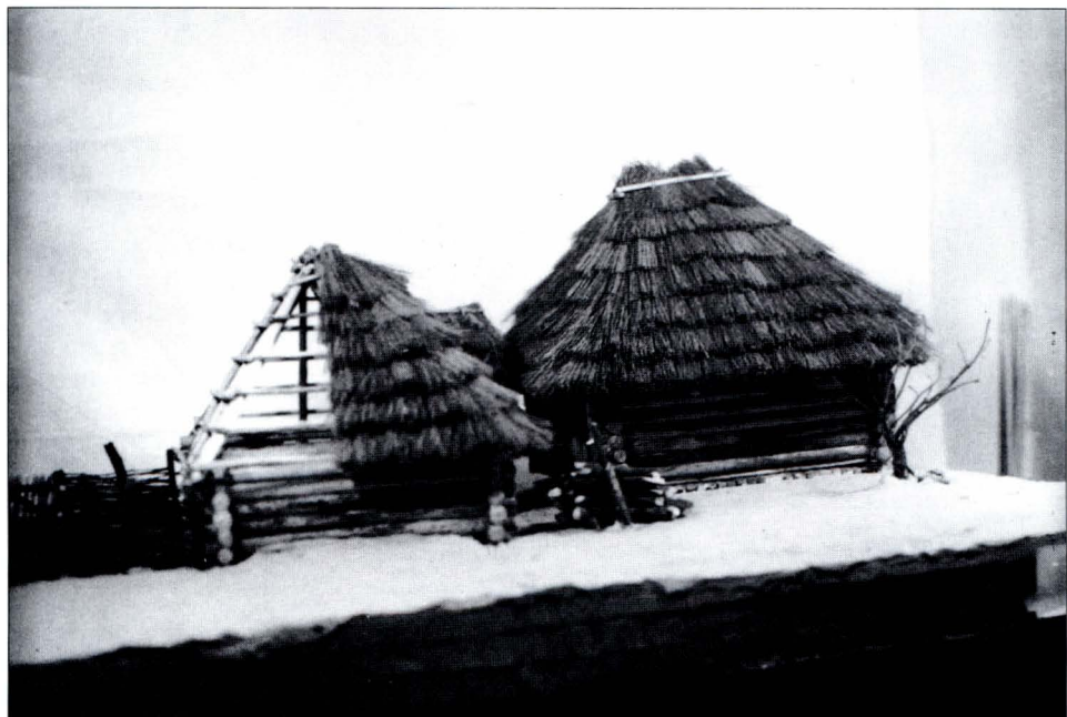
2. A model of the original appearance of one of the settlements in DMV of Kravín (Photo by R. Krajčic).