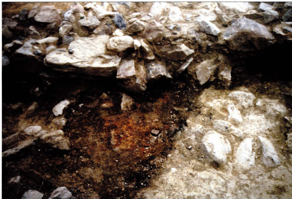
6. DMV of Mstěnice, district of Třebíč: Circular furnace in the water mill.