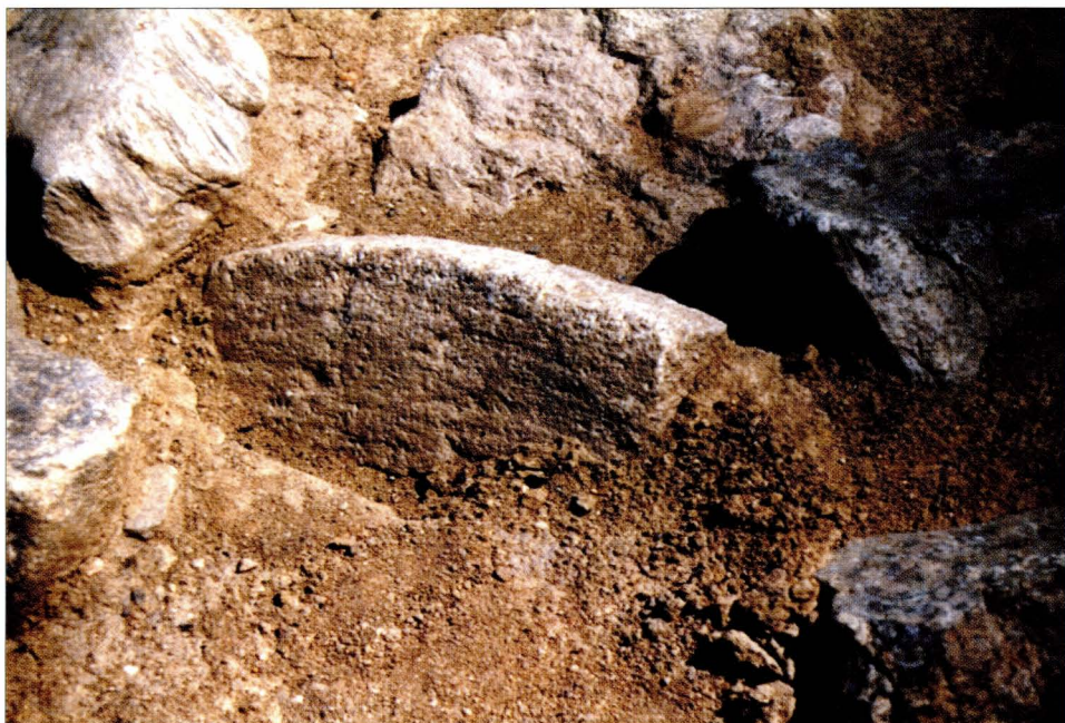
7. DMV of Mstěnice, district of Třebíč: Manual rotary grinder recovered from the water mill.