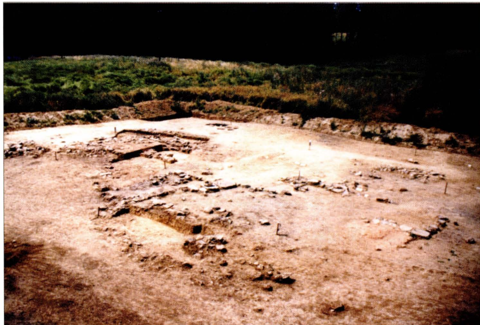
4. DMV of Mstěnice, district of Třebíč: Medieval water mill — an overall view.