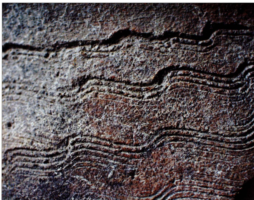
Tab.2:2 Břeclav — Líbivá. Keramika z objektu 89. Detail výzdoby z horizontu III.