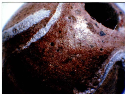
Tab. 3:3 Břeclav — Líbivá. Korálek u objektu 93. Detail.