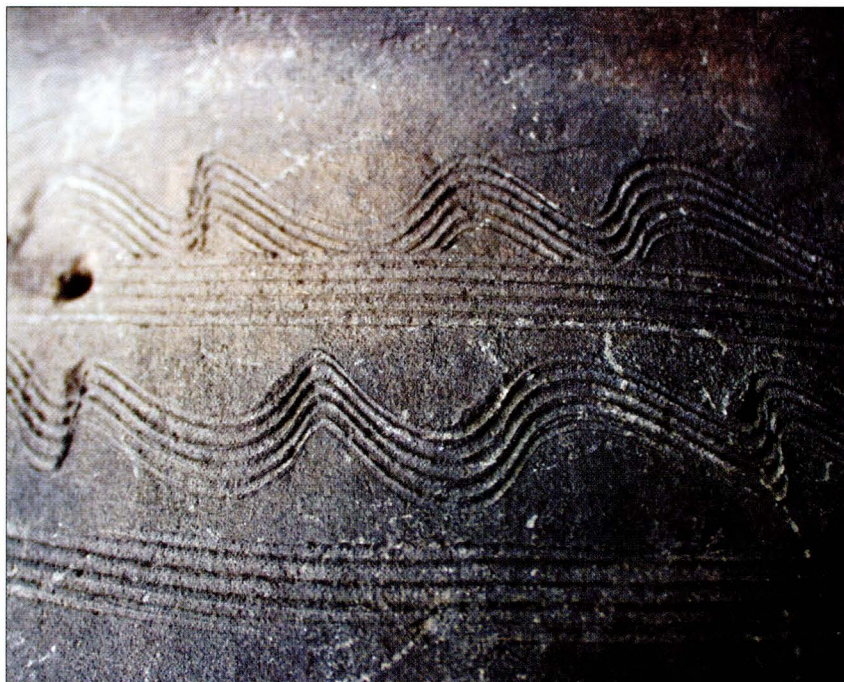
Tab. 2:1 Břeclav — Líbivá. Keramika z objektu 89. Detail výzdoby z horizontu III.