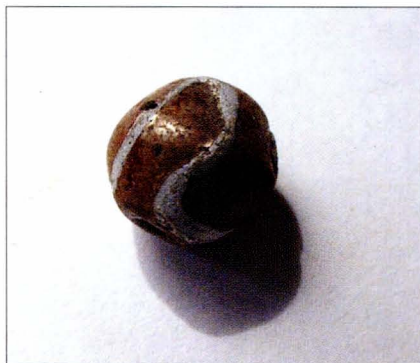
Tab. 3:2 Břeclav — Líbivá. Korálek z objektu 93.