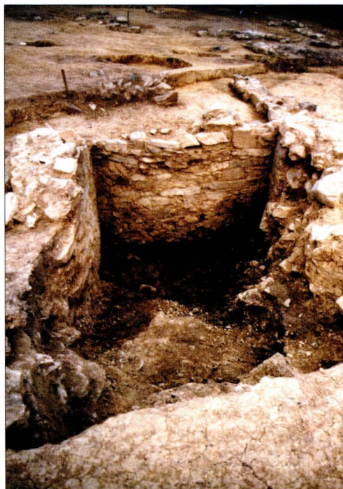
5. DMV of Mstěnice, district of Třebíč: Medieval granary excavated within the area of the water mill.