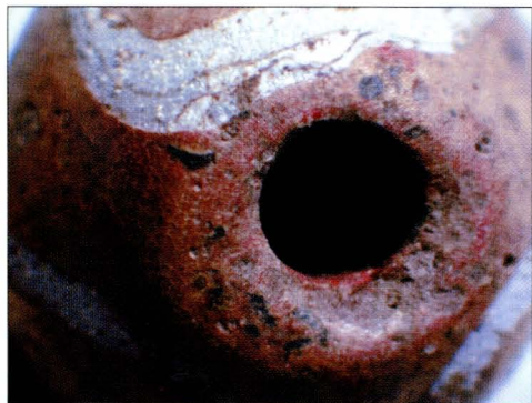
Tab. 3:1 Břeclav — Líbivá. Korálek z objektu 93. Detail.