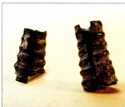
Tab. 3:4 Břeclav — Líbivá. Fragmenty náušnice z objektu 81.