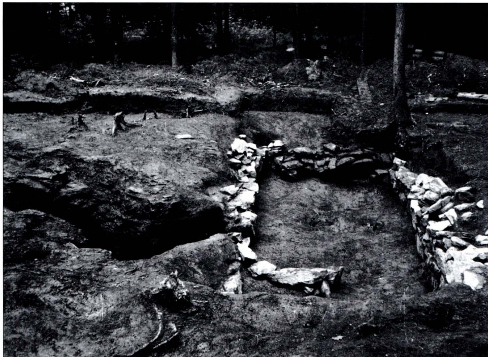
1. DMV of Kravín, district of Tábor: Sunken part of medieval house with relics of fireplace and storage pit opposite to the entrance.