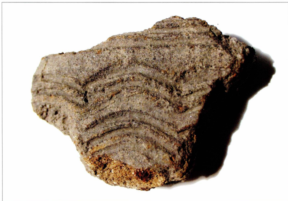
Tab. 1:2 Břeclav — Libivá. Keramika z objektu 39. Detail výzdoby z horizontu I.