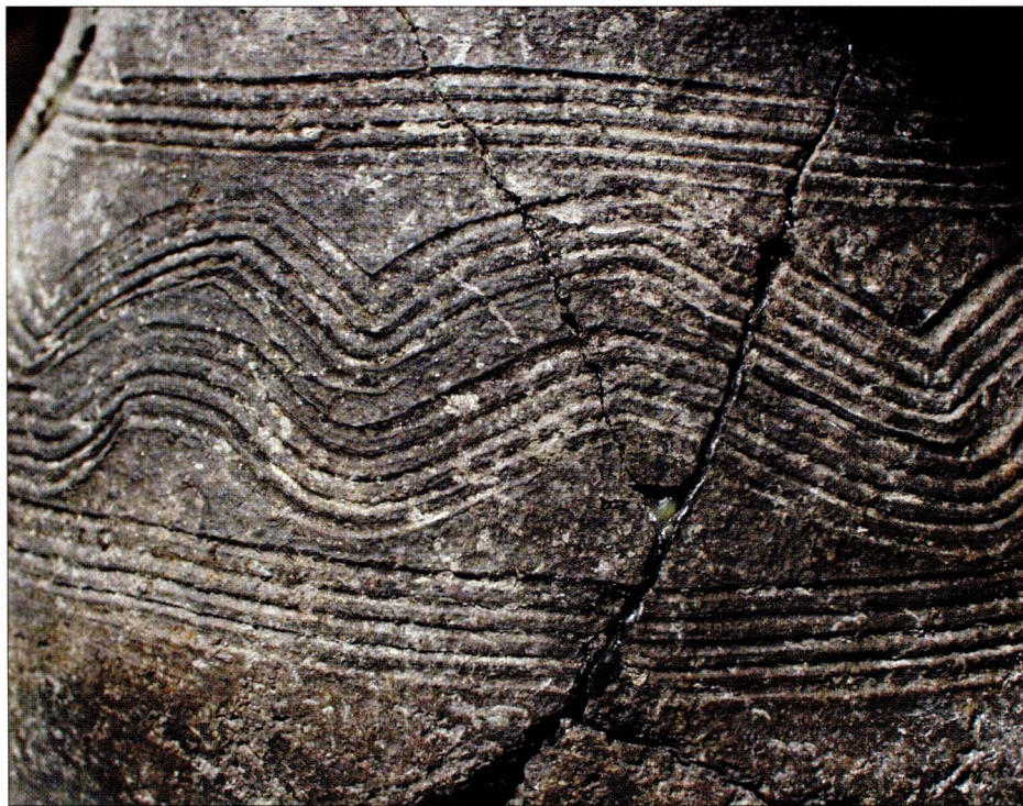
Tab. 1:1 Břeclav — Libivá. Keramika z objektu 39. Detail výzdoby z horizontu I.