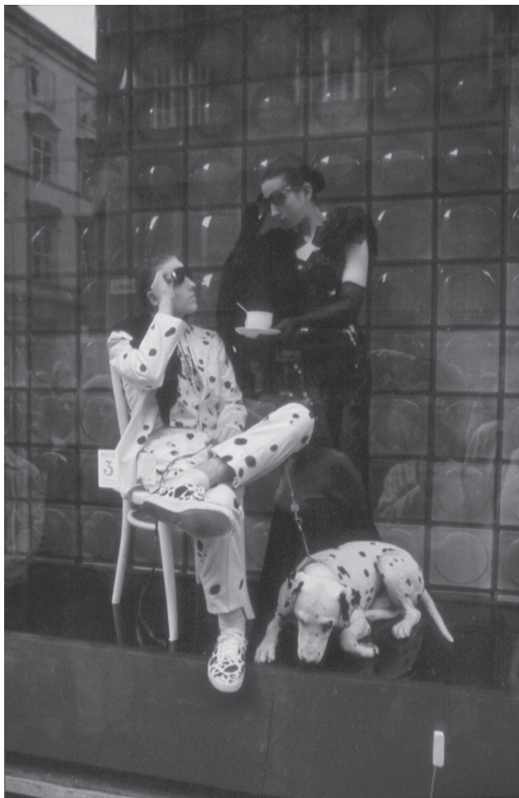
Výlohy – Brno 1990