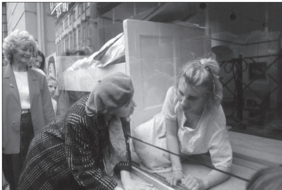
Výlohy – Brno 1990