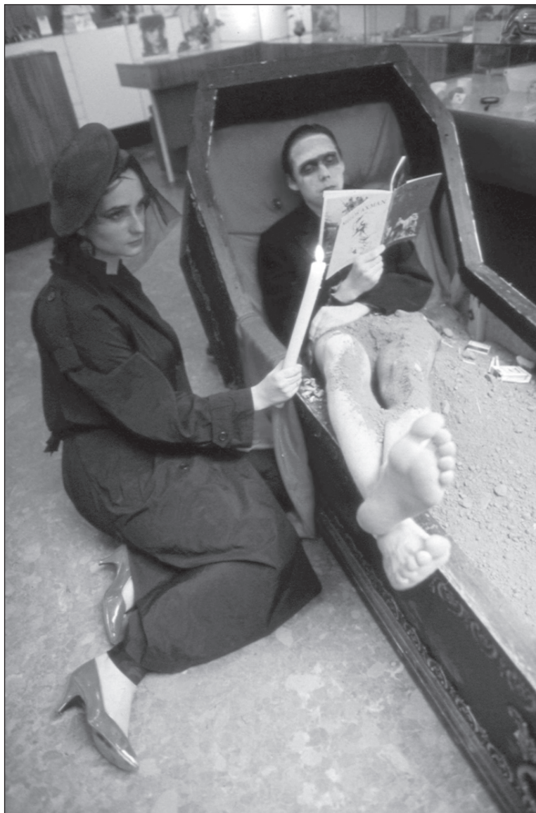
Výlohy – Brno 1990