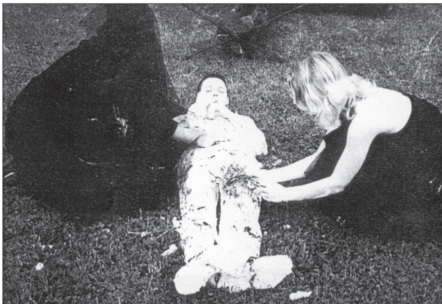
Sen No. 4 – Bardejov 1991