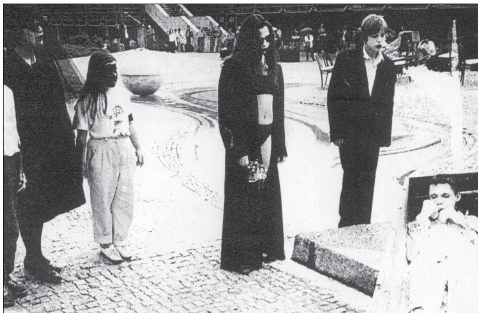
Sen No. 4 – Bardejov 1991 – archiv DHNP