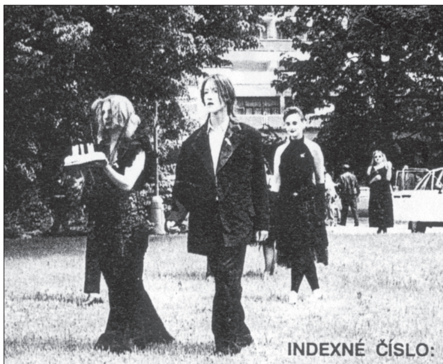
Sen No. 5 – Bardejov 1991 – archiv DHNP