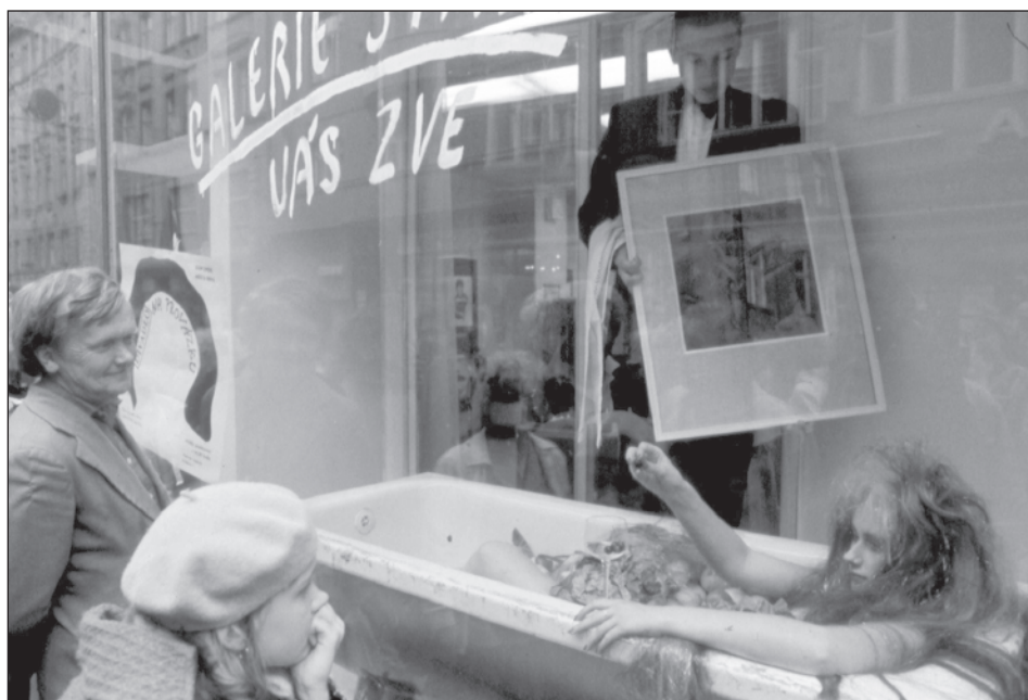
Výlohy – Brno 1990