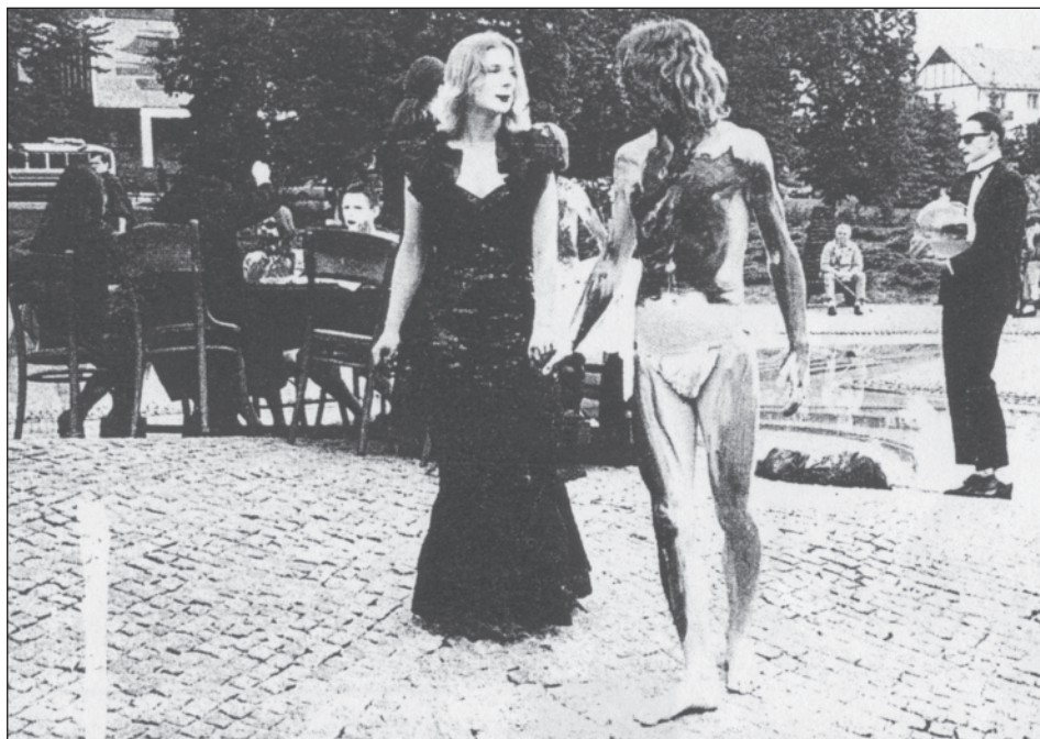
Sen No. 1 – Bardejov 1991