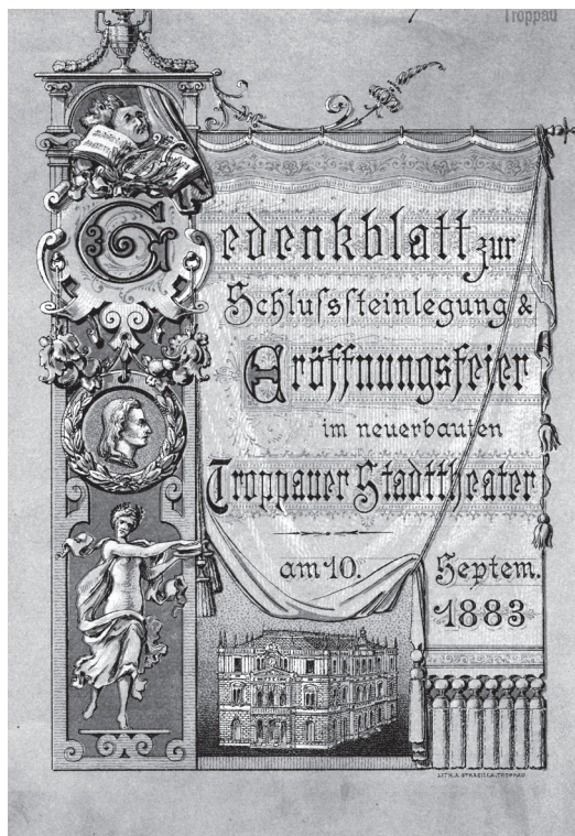
List k otevření divadla – Opava Zemský archiv v Opavě, pobočka Státní okresní archiv Opava, fond Sbirka dokumentárního materiálu (sign. XXIV/16).

však neměla dost peněz, rozhodla se jen pro divadlo prozatímní – das Interimstheater (Ratwitovo, dnešní Žerotínovo náměstí). Divadlo podle projektu začínajícího vídeňského architekta Ferdinanda Fellnera ml. bylo otevřeno 1. ledna 1871 a vešlo se do něj 1400 diváků. Stavební náklady na dřevěnou, ale výstavnou jednopatrovou budovu činily 60 000 zlatých, interiér hlediště tvořil parter a tři pořadí s lóžemi. Divadlo bylo v provozu jedenáct let (1871–1882), do okamžiku, kdy si město konečně postavilo nový reprezentativní dům (Theater auf den Schanzen, Divadlo Na hradbách, dnešní Mahenovo divadlo). Jeho stavba trvala jen půl druhého roku – na jaře 1881 oslovila městská rada vídeňský ateliér Fellner-Helmer a 14. listopadu 1882 se konalo