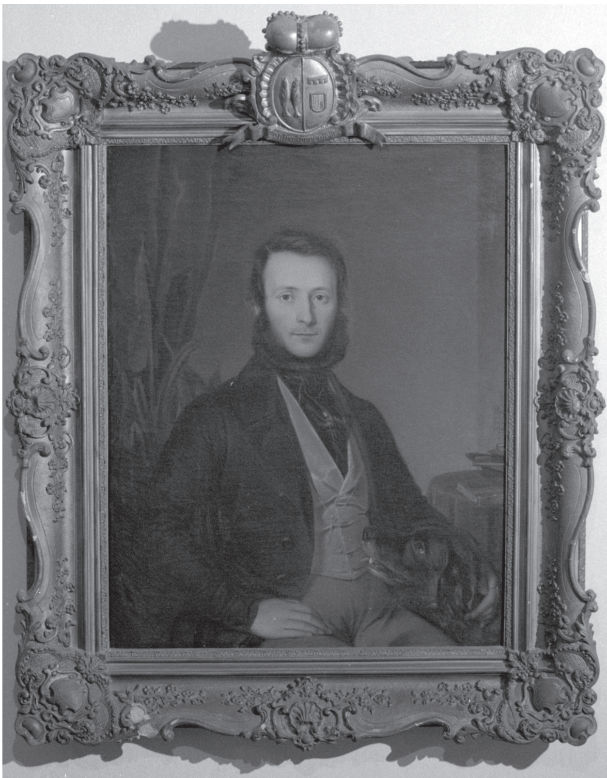
2 – Engelbert Seibertz, Robert starohrabě ze Salm-Reifferscheidtu , 1845. Státní zámek v Rájci nad Svitavou