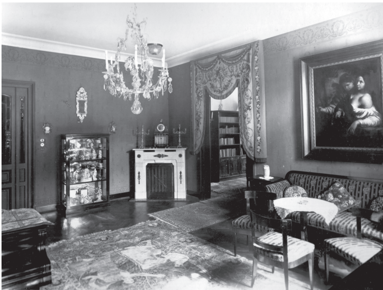
6 – Album fotografií sbírky Elly Trollerové – pohled do interiéru Trollerovy vily v Brně.

Kutalem, 23 nebo obraz s námětem Alegorie malířství , 24 jenž Ladislav Daniel naposledy připsal jihonizozemskému malíři působícímu ve Florencii Liviu Mehusovi (1630–1691). 25 Nejednalo se o systematicky budovanou sbírku, ale spíše o soubor vzniklý příležitostnými nákupy u starožitníků a uměleckých obchodníků, vedenými momentálním vkusem a zálibením sběratelky, využitý při interiérové výzdobě domu. Zmíněné album má charakter obrazového inventáře zachycujícího sbírkové předměty pomocí fotografie opatřené krátkou popiskou. Album navíc obsahuje i několik cenných fotografií interiéru vily manželů Trollerových v Brně s instalovanými sbírkami. [obr. 6] Po smrti Elly Trollerové v roce 1928 přešla umělecká kolekce odkazem na nezletilé děti, zatímco její manžel plnil roli opatrovníka až do doby, než byl dům v období protektorátu odstoupen vystěhovalckému fondu a movité vybavení v roce 1942 zabaveno ve prospěch Německé říše. Několik uměleckých předmětů ze sbírky Elly Trollerové bylo nedávno identifikováno ve fondech Moravské galerie v Brně a navraceno dědicům.