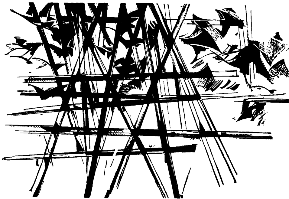
56. Krajina na roháčích, dřevoryt, 1965, č. kat. 631

úlohu i barva a kompozice, vzniká zvláštní napětí, dodávající malbám intenzivní umělecký účín. Lacinovi šlo vždy o zobecnění uměleckého sdělení, obraz mu nebyl jen osobním vyznáním, i když vyrůstal vždy z osobního zaujetí, prožitku nebo citu. Dokládá to dostatečně, do jaké míry Lacina znal a využíval symbolicko-dohodnutých znaků a zvyklostí, ať už vycházely z lidových tradic nebo z vědeckých poznat-