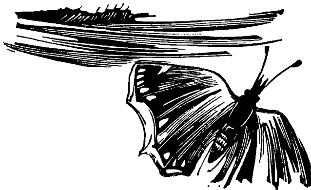
28. Ilustrace k Halasově básni v próze Já se tam vrátím, dřevoryt, 1948, č. kat. 517

i barva, odlesk na vodě, báseň nebo hudební skladba byly inspirací k obrazu, který malíř nikdy nepovažoval za definitivně ukončený. Z něho odvodil obvykle další obraz vyvolávající nové otázky a problémy, protože ani umění nepovažoval za konečné jako život. Definitivně se jeho vlastní dílo uzavřelo teprve smrtí a vstoupilo jako živý odkaz a nesporný přínos do dějin umění našeho století.