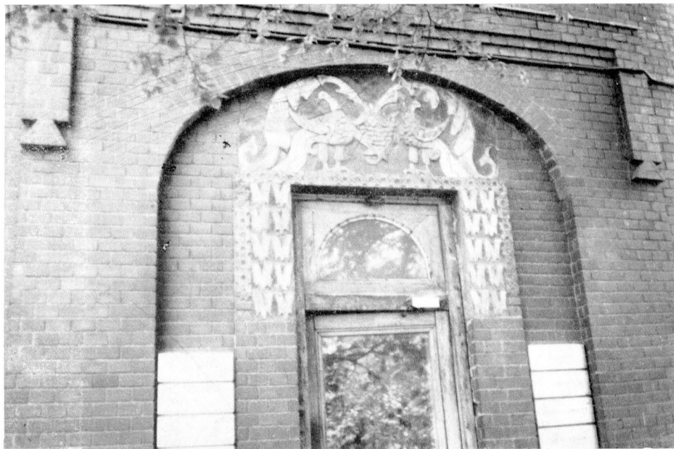
Typický secesní dekor na neogoticky stylizovaném Percovově domě na Sojmonovské ulici v Moskvě. Arch. S. V. Maljutin a N. K. Žukov, 1905—1907. Ke kap. VI. a VII.