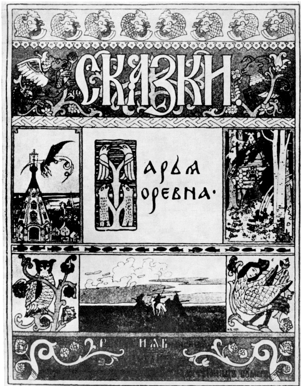
I. Ja. Bilibin, Obálka k ruské lidové pohádce Marja Morevna, 1899. Srov. kap. VI. a VII.