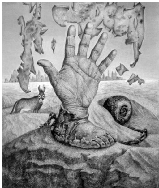
Rukamanohama , 1975

divu, že Věra spolu s Pavlem vytvořili s tak hlubokým pochopením ilustrace k Lermontovovým poémám. Bylo to jediné, co se mi podařilo realizovat z celého edičního návrhu v knize Stesk rozumu (1976). V dobovém pressu uvízly i moje překlady Lermontovových juvenilií. Temná normalizační doba vykrytalizovala v obraze ruky, vyrůstající z vlastní nohy, řetězem připoutané ke šnečí ulitě. Svobodný svět mrakodrapů se ztrácí v namodralé dálce za mořem, k zemi se snášejí útržky dávných plakátů ( Rukamanohama , 1975).