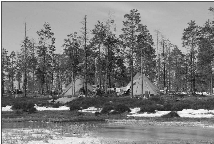
Obr. 2. Jarní tábor v tundře.

v Jamalo-Něneckém AO 6,5% a v Chanty-Mansijském AO jen 1,5% obyvatel hlásících se k těmto národnostem. 6