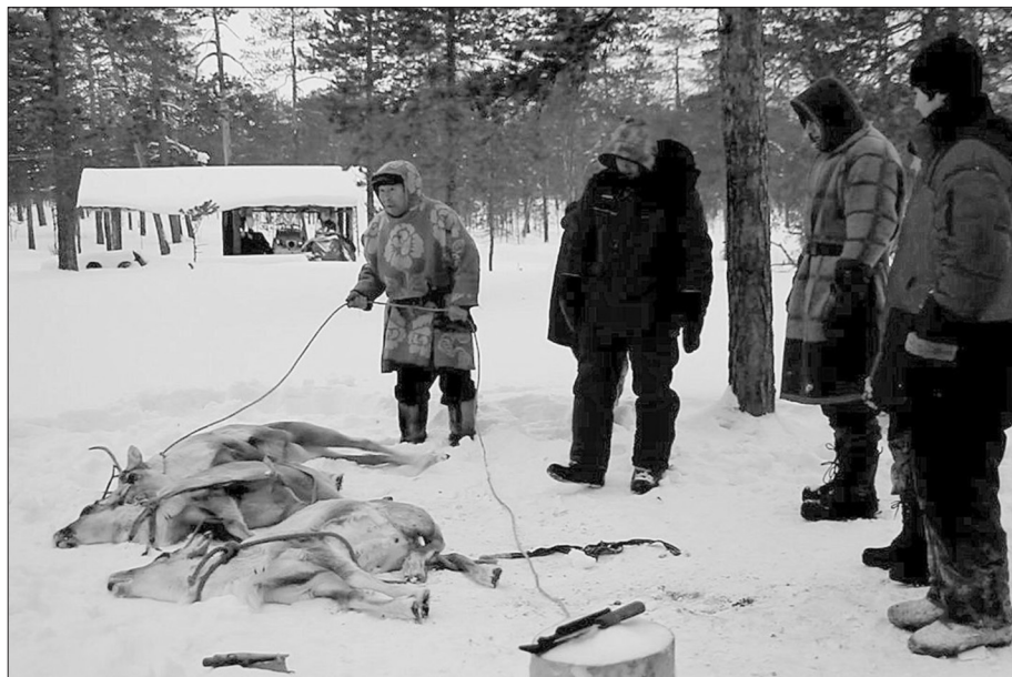
Obr. 4. rituální porážka/oběť sobů v zimní osadě J. Velly.

(nebo uškrcen) a je mu nožem probodnuto srdce. Během jeho posmrtných záškubů jsou prováděny rituální otočky po směru slunce a pronášeny modlitby. Tehdy je duše soba „odesílána“ bohům, zvláště Numovi , kterému patří. Pohlavní orgány jsou zavěšeny za blízký strom a tam ponechány, na strom je dočasně hozen i provaz, na kterém byl sob držen, případně, kterým byl uškrcen. I tomuto aktu je přiřkládán náboženský význam (srov. Pentikäinen, 1996: 171). Na některých jiných stojbišcích rodin, jejichž členové se označovali za křesťany, byli sobi často také pouze střeleni nebo zabiti a bouráni bez jakýchkoliv ceremoniálních; nicméně stejnými lidmi byli někdy alespoň bouráni na tradičně posvátném místě za čumem a obrácení hlavou k jihovýchodu. J. Vella označil takový přístup k sobům za znak úpadku a neblahou předzvěst dalšího osudu tohoto konkrétního stáda.