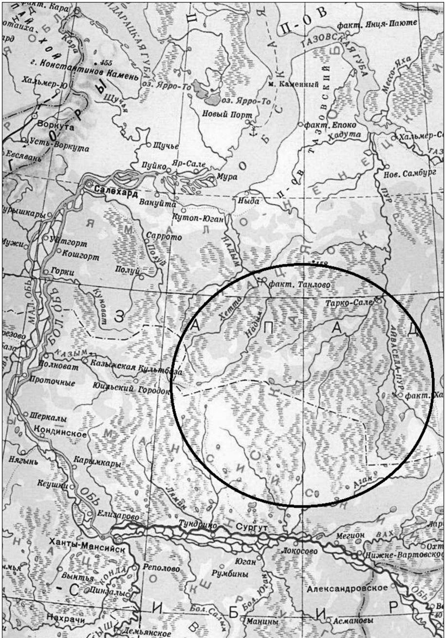
Obr. 1. Oblast obývaná Lesními Něnci.