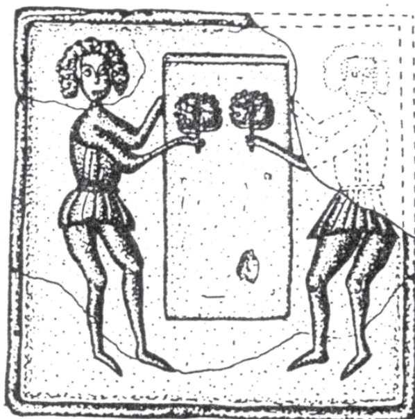
Obr. 4: Zobrazení dvou počesávačů sukna na řádkovém komorovém kachlu z hradu Lichnice z přelomu 15. a 16. století (podle Glosová – Hazlbauer – Volf 1998)

ků, často předmětů běžné denní potřeby, které autor výtvarného díla sám používal a dobře znal. V tomto směru výpověď výtvarných památek výrazně doplňuje archeologické textilní nálezy, které jsou v naprosté většině dochovány v malých fragmentech tmavohnědé barvy a nemohou tak v žádném případě zcela postihnout bohatství a vyspělost textilní kultury (Staňková 1989, 73 – 76).