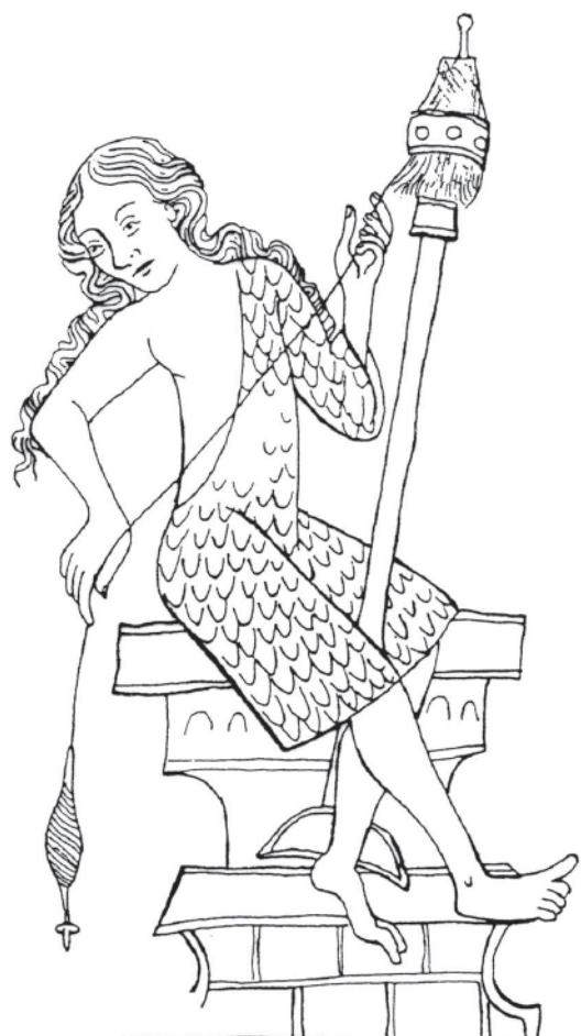
Obr. 1: Eva, předoucí pomocí ručního vřetene a přeslice, vyobrazená ve Velislavově bibli z doby kolem roku 1340 (podle Březinová 1997)

Velkou důležitost má svědectví ikonografických pramenů pro poznání způsobů a možností používání textilií ve středověku. Ve výtvarných dílech se objevují reálná zobrazení dobových textilních výrob-