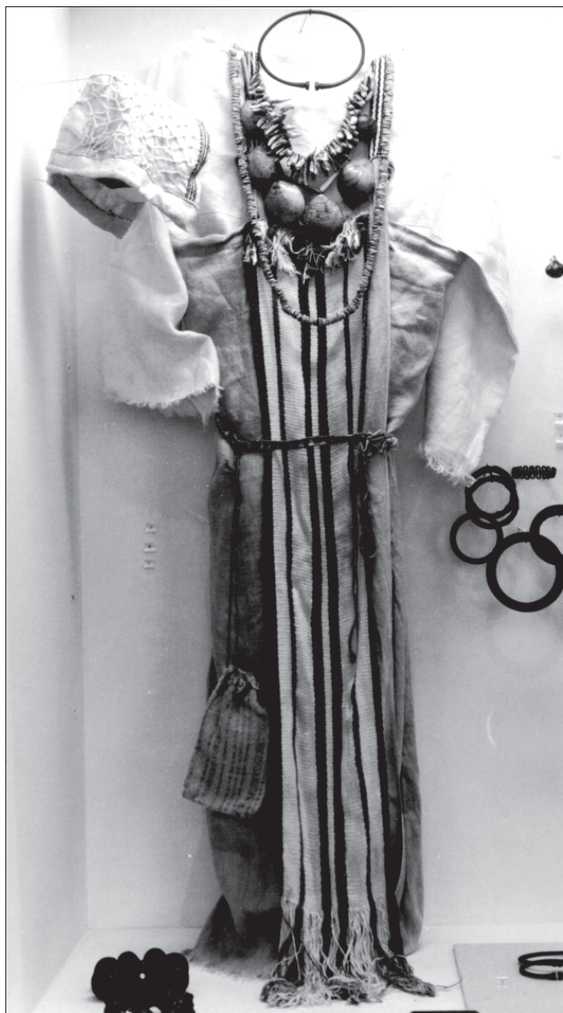
Obr. 6: Rekonstrukce ženského oděvu podle nálezů z doby bronzové (podle Březinová 2000)

na těch méně náročných jako je sprádaní rostlinných a živočišných vláken, tkaní na vertikálním nebo destičkovém stavu, barvení tkanin. Výsledkem takových, několikanásobně se opakujících pokusů je získání zkušenosti, která je velice důležitá a nezbytná jednak pro provádění skutečných vědeckých experimentů, jednak pro naplňování popularizačního a výchovně-pedagogického poslání experimentální archeologie. Do druhé skupiny bychom mohli zařadit experimenty, jejichž cílem je zhotovení pravěkého nebo středověkého oděvu. Jejich provádění je uskutečňováno ve dvou odlišných rovinách. Na jedné straně jsou skutečné rekonstrukce podoby dobových oděvů a jejich součástí, které vycházejí z konkrétních archeologických nálezů. Takových experimentů zatím u nás nebylo provedeno mnoho, jako příklad může posloužit ženský oděv zhotovený podle nálezů z doby bronzové (obr. 6) v Oddíle experimentální archeologie Mamu-