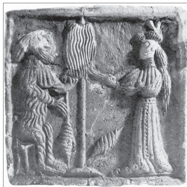
Obr. 2: Sedící lesní muž (ďábel) s přeslicí a s vřeteny s namotanou přízí učí přístojící ženu. Scéna zobrazená na čelní vyhrávací stěně komorových kachlů z 2. poloviny 15. století, sbírka Muzea hl. m. Prahy (podle Richterová 1982)