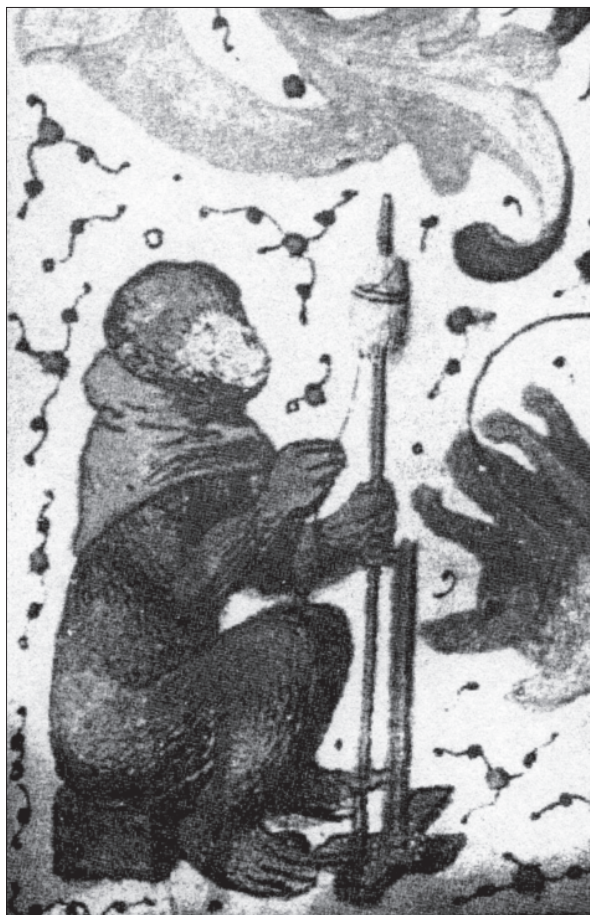
Obr. 3: Vyobrazení lesního (divého) muže nebo opice s přeslicí a ručním vřetenem z okrajové malby Breviaria kláštera Nové Říše, okolo 1480 (podle Richterová 1988)