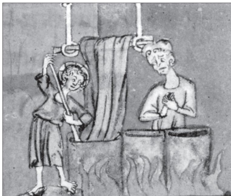
Obr. 5: Barvířská dílna na ilustraci z doby kolem roku 1300, Bodleian Library, MS Selden supra 38, f. 27 (podle Walton 1991)

czka – semeniště; festuce – drasta – tlouk; pannifex – sukennyk – soukeník; textor – tkadlec – tkadlec; pannicida – suknokray – postřiháč; colus – przyesslicze – přeslice; linista – platennyk – pláteník; tornus – cuzel – kužel; sagia – obvazek – přadeno; colofolium – obaslo – obaslo; girta – przyeslen – přeslen; fusum – wrzyeteno – vřeten; filum – nyt – nit; stuppa – kudele – koudele; motaxa – przadeno – přadeno; turnum – skane nyty – skané nitě; trama – vtek – útek; filatorium – nytldnycze – nitěnky; ansa – statywa – držadlo, rukojět; dola – rospinadlo – ?; frixorium – trlycze – trdlíce; liciatorium – wratydlo – vratidlo; radius – czlunek – člunek; stamen – staw – osnova, tkanina; pennale – czyewka – cívka; glomus – klubko – klubko; alabrum – motovidlo – motovidlo; textorium – brdo – brdo; dragma – potacz – vřeten s nití; pecten – ochle – vohle; funseria – zemnye – svazek lnu; girgillum – koleczko – kolečko; trifilia – wygadło – viják; pannus – sukno – sukno; licium – trzyepecz – útek; tela – platno – plátno; contus – bydło – bidlo; substamen – postaw – postav; sutum – syew – šev; spola – czyepy – cípy; sartor – kracyzy – krejčí; sutrix – sswyedle – švadlena; forfex – noze – nůžky; acus – gehla – jehla; digitale – narstek – náprstek; supplícium – czwylink – cvilink; scarlicium – sarlat – šarlat; dupplicium – mittlynk – hrubá látka; recidula – okragek – okraj, lem (Knotková 1994, 11 – 13);