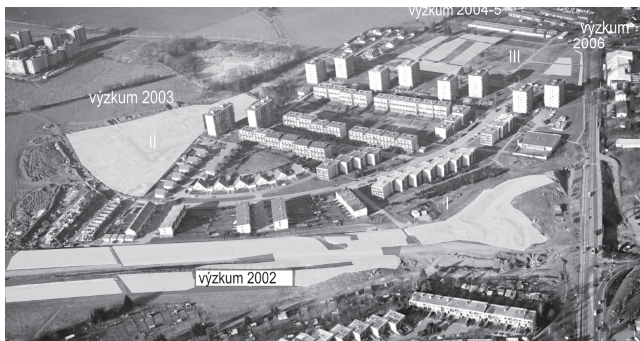
Obr. 3. Jihlava – Staré Hory. Názorné vyznačení ploch archeologických výzkumů v letech 2002 až 2006 na leteckém snímku. Foto D. Merta 2003.