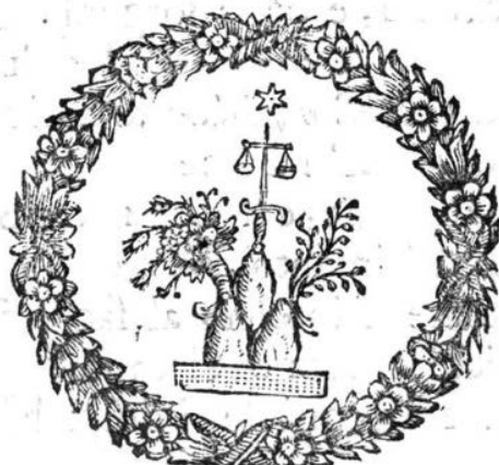
Abb. 2: Vignette mit Wappenemblem Papst Clemens XI. aus dem Libretto Vaticini di pace

Auch die äußere Form des Librettodrucks unterstützt die Aussage des Textes, indem die zentralen Worte – wie Clemente , Pace und Giustitia – durch Kapitälchen hervorgehoben und in der abschließenden Abbildung prägnant verbildlicht werden (siehe Abb. 2).