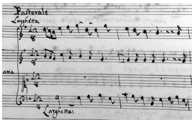
Abb. 5: Ausschnitt aus: Pastoralarie aus der Kantate Amarilli vezzosa , D-MÜs SANT Hs 759 (1713/1714)

Die in den beiden Kantaten enthaltenen Pastoralarien Sempre risuoneranno (siehe Abb. 5) und Quel Pargoletto (siehe Abb. 6) sind in ihrer musikalischen Thematik ebenfalls identisch und unterscheiden sich in den Eingangstakten nur