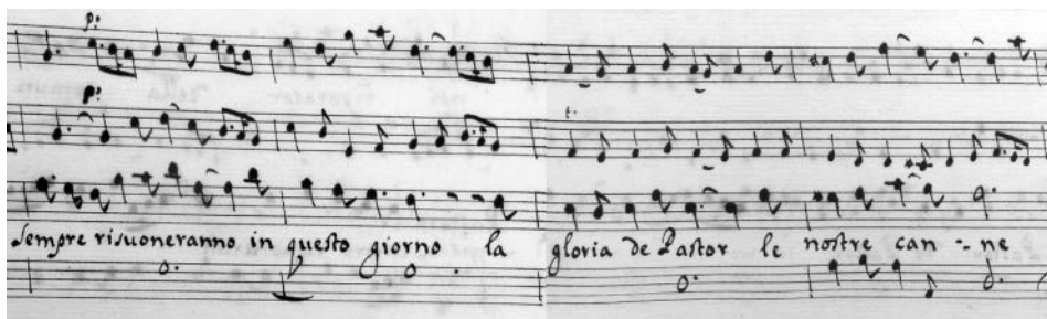
Abb. 7: Ausschnitt aus: Pastoralarie aus der Kantate Amarilli vezzosa , D-MÜS SANT Hs 759 (1713/1714)

Der veränderten Schwerpunktsetzung begegnet Caldara mit auftaktigem Einsatz der Singstimme anstelle des volltaktigen Beginns in Sempre risuoneranno , der verkürzten Silbenzahl mit der Wiederholung des zweitaktigen Anfangsmotivs. Dank der Wiederholung des Wortes nascere erreicht er im letzten Vers des A-Teils ebenfalls elf Silben, was es ihm erlaubt, die Melodie der Vorlage zu übernehmen, zwar um einen halben Takt verschoben, aber in Tonhöhe und Rhythmus unverändert.