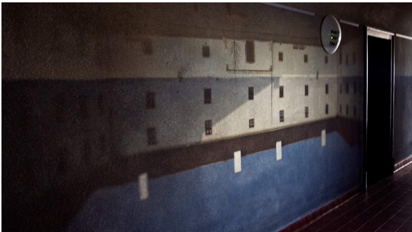
Obr. 3. Oko nádvoří (Petr Nikl).