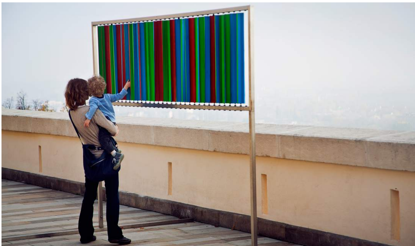
Obr. 1. Větrný display (Dušan Váňa).