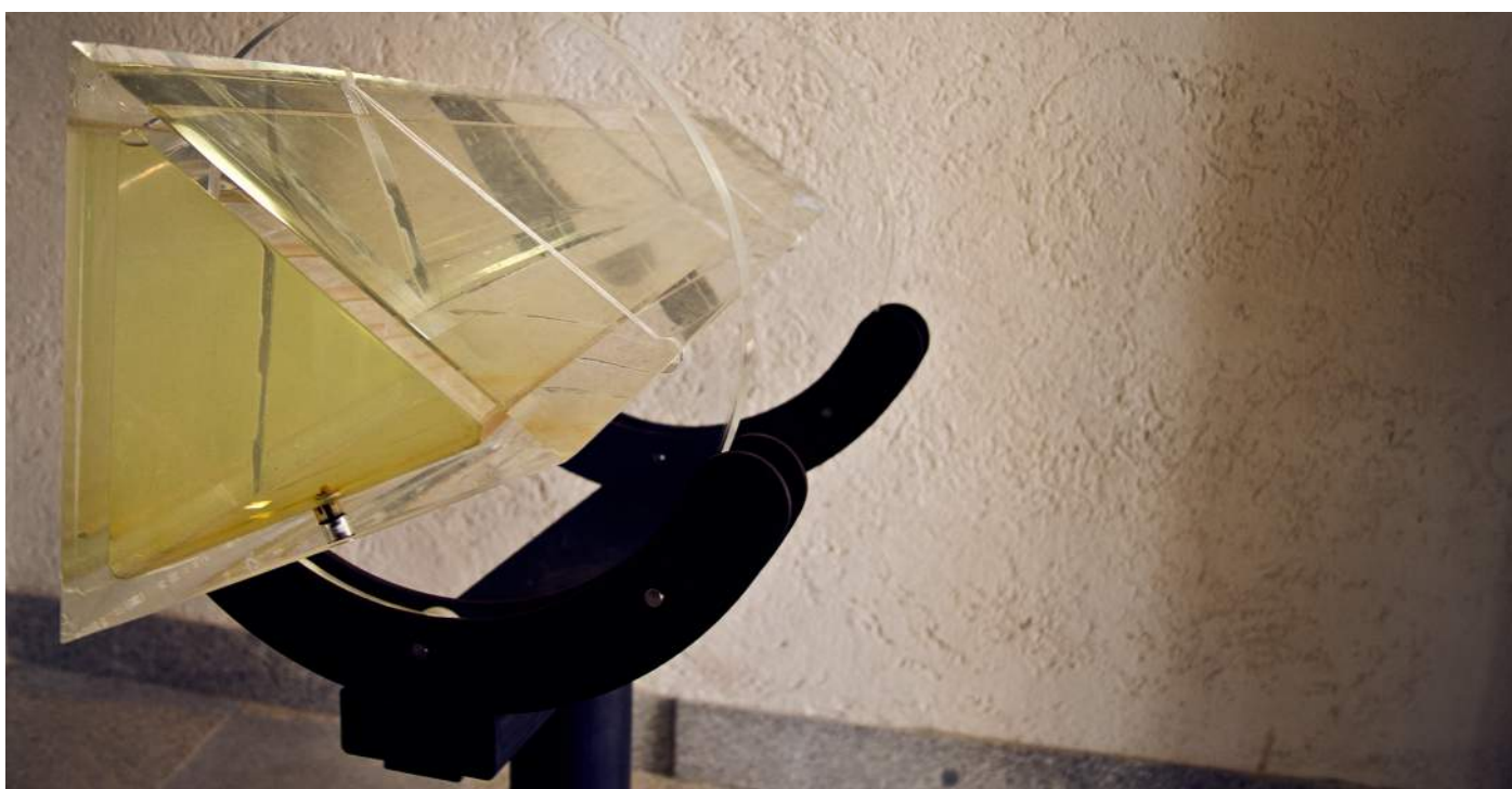
Obr. 2. Prisma a kontrastní kruh (Ueli Seiler-Hugova).