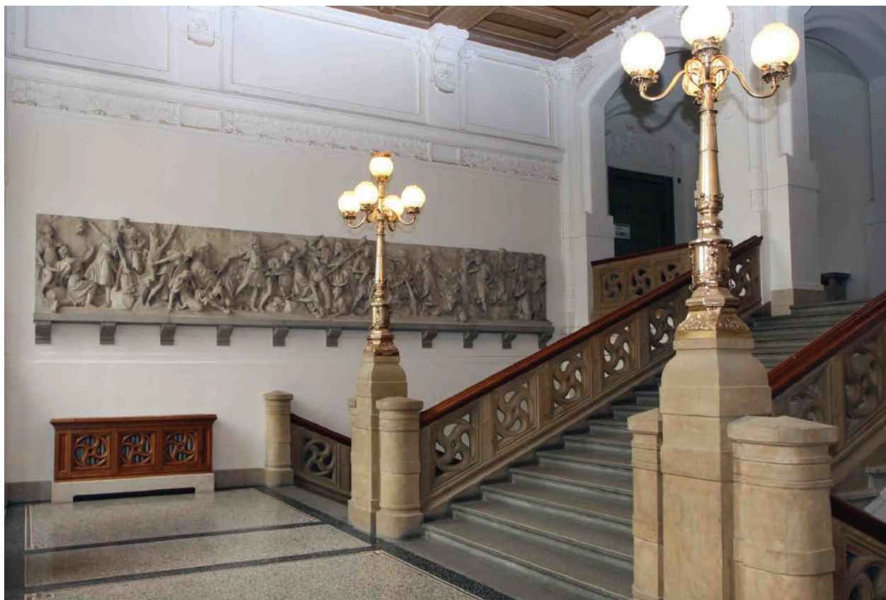
3 – Vojtěch Eduard Šaff, Dívčí válka II. , 1900–1901. Plzeň, Západočeské muzeum

Umělec se již od počátku vlastní práce na díle snažil zvrátit rozhodnutí o provedení díla v kararském mramoru ve prospěch bronzu. Ukazuje se však, že původní schválený rozpočet by nestačil ani na provedení v materiálu již sjednaném. Navýšení příspěvku nebylo akceptováno ani ze strany ministerstva, ani města Plzně. Politická situace byla již zcela jiná než v roce 1897; národností spory se opět vyostřily