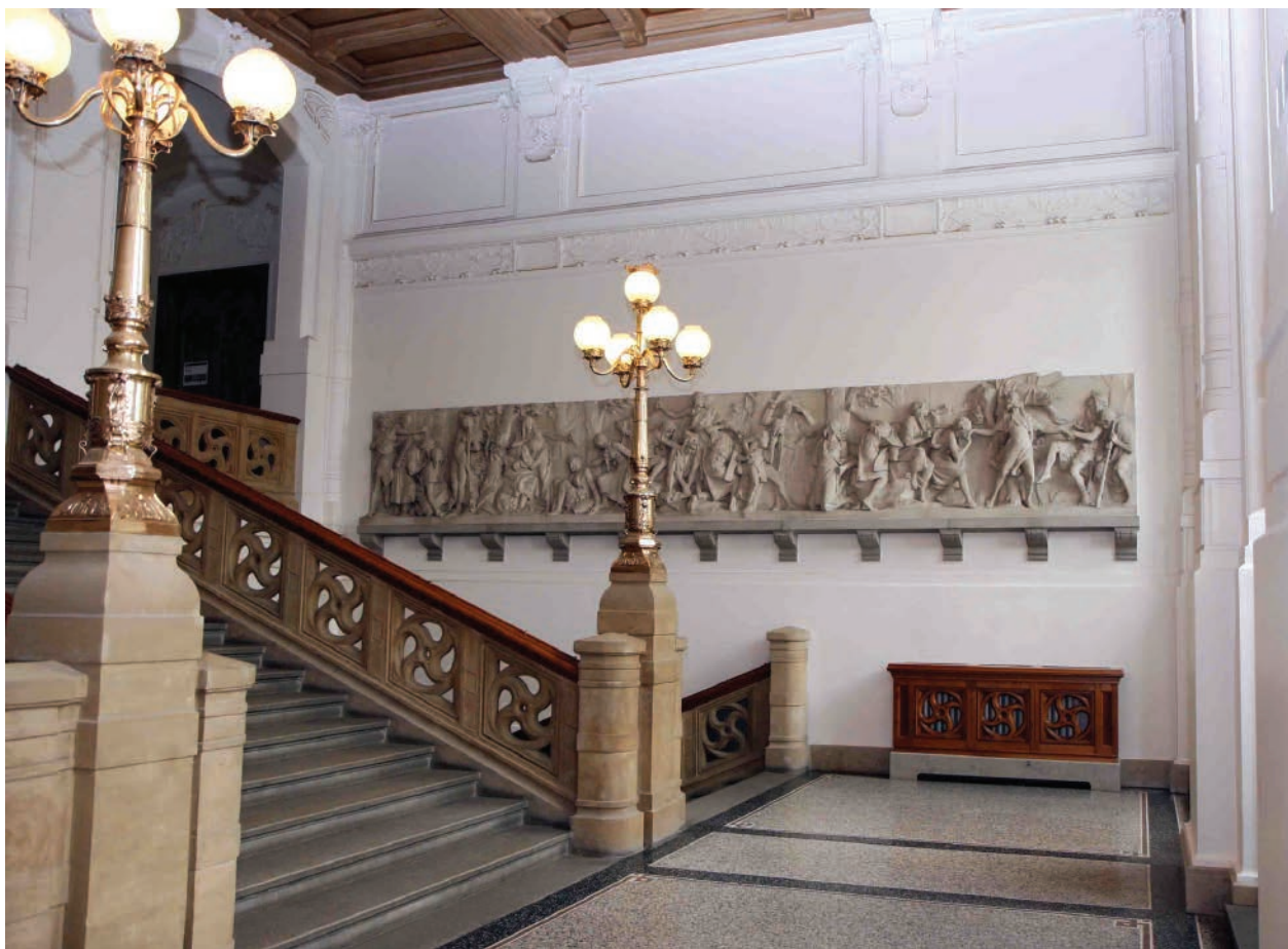
2 – Vojtěch Eduard Šaff, Dívčí válka I. , 1897–1899. Plzeň, Západočeské muzeum

upozornil i na českého sochaře, případně dokonce navrhl či vznesl požadavek, aby ministerstvo kultu a vyučování finančně podpořilo vznik českého reprezentativního uměleckého díla, primárně určeného pro české území. Právě varianta, že taková žádost vzešla ze strany mladočeské reprezentace, se zdá být tou nejvíce pravděpodobnou. Z politického hlediska byl Šaff ideálním kandidátem k poskytnutí takovéto podpory. Patřil k tehdejší mladší generaci umělců, byl českým absolventem Vídeňské akademie umění, poctěným dokonce Římskou cenou, nijak se politicky veřejně neangažoval a navíc dlouhodobě žil a tvořil ve Vídni. I přesto, že se o politiku fakticky nezajímal, stýkal se s řadou mladočeský orientovaných osobností, včetně politiků, a mohl být tudíž vnímán jako jejich stoupenec. Eim, pro svoje politické možnosti a schopnosti označovaný jako „český místopředseda ve Vídni“, 8 svoji roli při získání podpory pro Šaffa a jeho dílo pravděpodobně skutečně sehrál, nicméně nemohl již patrně ovlivnit výběr a samotné podmínky konečného zadání umělecké zakázky.