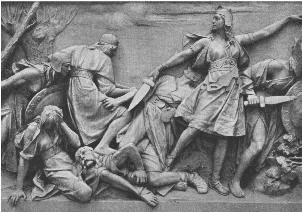
6 – Vojtěch Eduard Šaff, Dívčí válka II. – Výpad Vlastin , 1921

Jde o scénu příznačně pojmenovanou Výpad Vlastin . [obr. 6] Ve směru levé Vlastiny paže se scéna mění v Bitvu . [obr. 7] Boj zde ovládají muži. Ze středu útočí tři mužské svalnaté postavy – vladykové. Zobrazení této fáze boje, v němž dochází k odražení žen a k přechodu mužů do útoku, zahrnuje asi 12 postav, které vyplňují celý prostor. Opět prostřednictvím ztvárnění stromu, tentokrát však již zlomeného, posunuje umělec scénu k Vlastině porážce. [obr. 8] Umírající Vlasta je znázorněná jako ležící postava s dosud zdviženou hlavou, která v boji padá na tělo jiné, již mrtvé dívky. Pravou rukou si přidržuje ránu, s vědomím blížící se smrti. Nad Vlastou stojí její přemožitel, jeho vítězné gesto však není oslavné. Muž se lehce zaklání – odstupuje po zásahu nepřítele, svůj meč již drží v pravici daleko od Vlastina těla, avšak stále pevně. Levou rukou ukazuje na přemoženou Vlastu. Tuto Porážku sleduje další muž, patřící již do poslední scény, nazvané Smíření . [obr. 9] Jeho výraz je zamyšlený a naznačuje lítost nad umírající ženou. Postava je však odvrácena od obrazu konečného usmíření, které Šaff zobrazil ve formě výše sedícího starého muže. Dle vavřínu a vojvodské hole lze usuzovat, že jde o Přemysla, pozorujícího pár v pravém rohu výjevu. Stojící muž zde pohybem pravé paže vyzývá klečící ženu, aby se postavila. Ta beze zbraně přijímá svoji