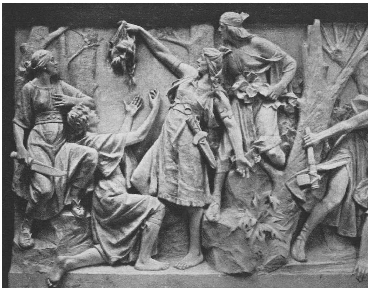
5 – Vojtěch Eduard Šaff, Dívčí válka II. – Vítězosláva , 1900–1901

Druhá část reliéfu, kterou bychom mohli označit jako Vlastin příběh, začíná scénou nazvanou Vítězosláva . [obr. 5] Zde dívka na důkaz vítězství vyzdvihuje odříznutou mužskou hlavu. Její tři družky zobrazené kolem ní – každá pojata z jiného úhlu – směřují své pohledy k její pravé ruce, v níž dívka za vlasy drží uřatou hlavu nenáviděného muže. Druhé scéně vévodí Vlasta, její výraz odpovídá sebevědomé ženě-vůdkyni, která přivádí své družky do rozhodujícího boje s muži. Ve fázi přenesení váhy v kroku, s rozpaženými pažemi v nestejně výšce, naznačuje výzvu k boji, přičemž pravici jako by ukazovala dívkám směr. Žena otáčí hlavu zpět a její pohled, směřující do dálky, je výzvou k následování. Očima ani nezavadí o scénu, která probíhá v její těsné blízkosti. Ve směru otočení její hlavy autor umístil poněkud níže několik bojujících těl s naznačením ženské převahy.