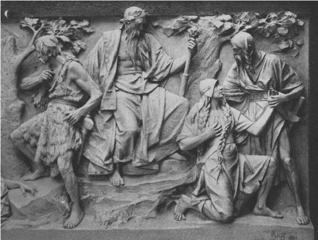
9 – Vojtěch Eduard Šaff, Dívčí válka II. – Smíření , Praha 1900–1901

povídá Josefu Svatopluku Macharovi a je odkazem na básnickou sbírku Zde by měly kvést růže . 45 Opakování odkazu či užití jednoho modelu pro více postav reliéfu se nezdá příliš pravděpodobné u díla, které jinak autor pojal po všech stránkách poměrně logicky. Navíc v případě utaté hlavy je podoba s Macharem pouze v rovině jistého obecného typu.