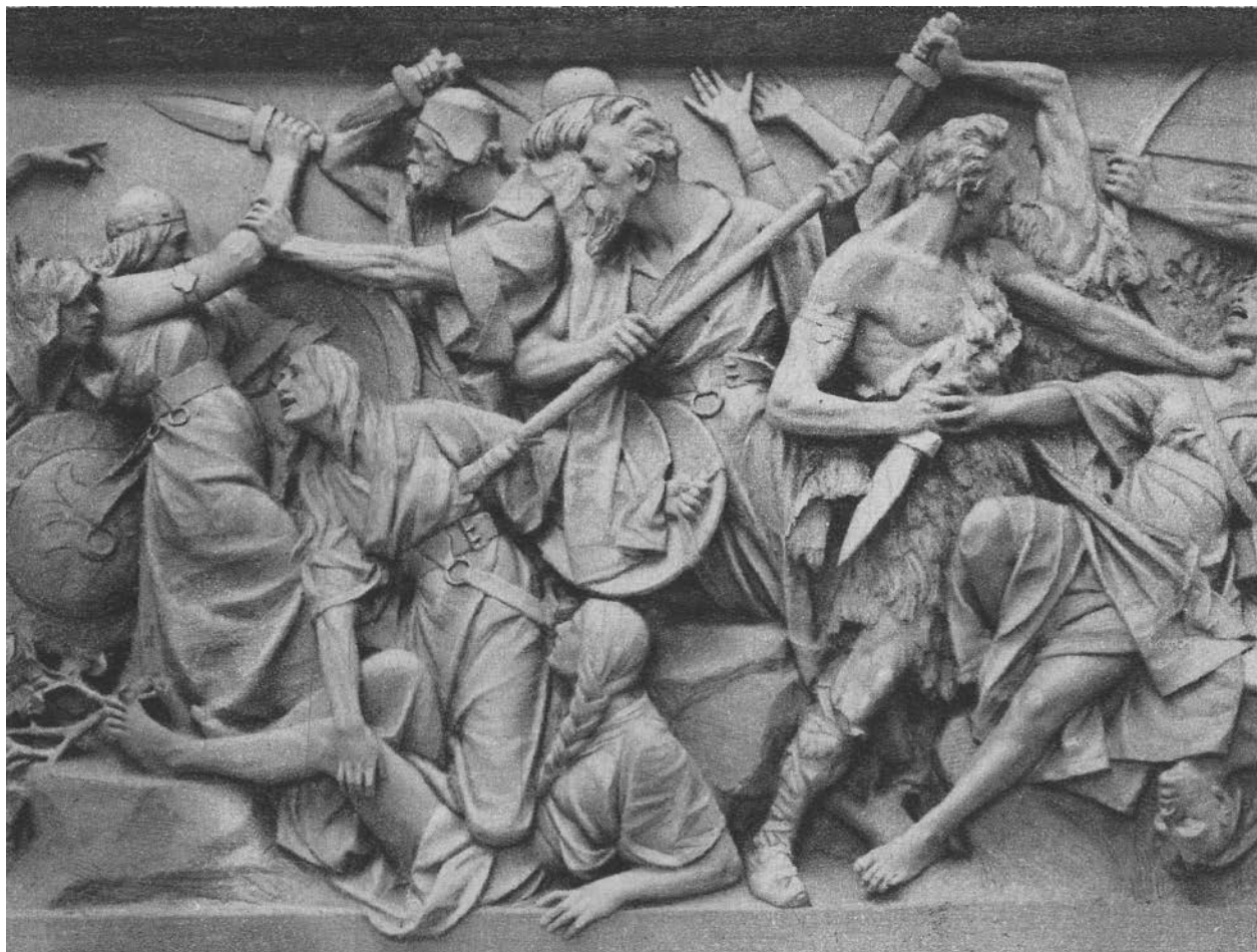
7 – Vojtěch Eduard Šaff, Dívčí válka II. – Bitva , 1900–1901

V druhém díle již jednotlivé výjevy neodděluje v celé ploše, avšak zachovává náznak rozčlenění na začátku a konci příběhu. Využívá zmíněnou horizontální výškovou linii, pomocí níž dosahuje nejen větší přehlednosti, ale i monumentálnějšího vyznění celku. Šaff volí v prvním díle působivé typy postav. V jeho představě slovanského vzezření mají svalnatí muži dlouhé husté kníry, jsou rozčuchaní nebo si naopak zaplétají copánky, ženy, bytosti z masa a kostí, pak zobrazuje s dlouhými hustými vlasy zapletenými v copy. Slovanské rysy se však v druhém díle trochu ztrácejí, k čemuž přispěla i volba modelů. Obecně se zdá, že i přes realistické, někdy spíše naturalistické, pojetí dívek a mužů jsou postavy první části jemněji modelovány a zároveň jsou propracovanější jak z hlediska tvaru, tak i pohybu. Právě onu jemnost, zejména u zobrazení žen, nenacházíme v dílu druhém. Postavy jsou zde až na výjimky strnulější a mnohem více naturalisticky podané. Již po dokončení první části byl Šaffovi vyčítán „bezohledný