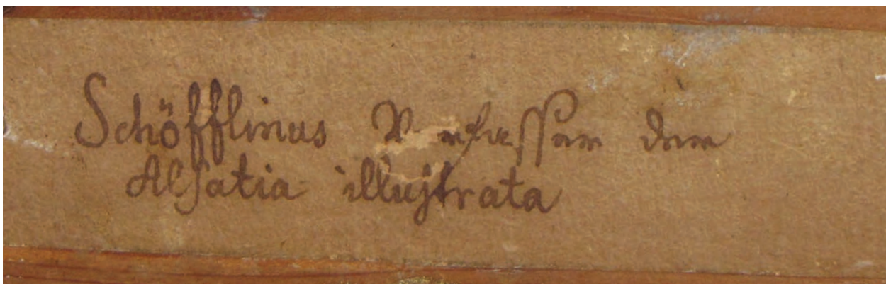
10 – Štítek s nápisem „Schöfflinus Verfasser der / Alsatia illustrata“ na rubu obrazu salmovské obrazárny, inv. č. RA 1444