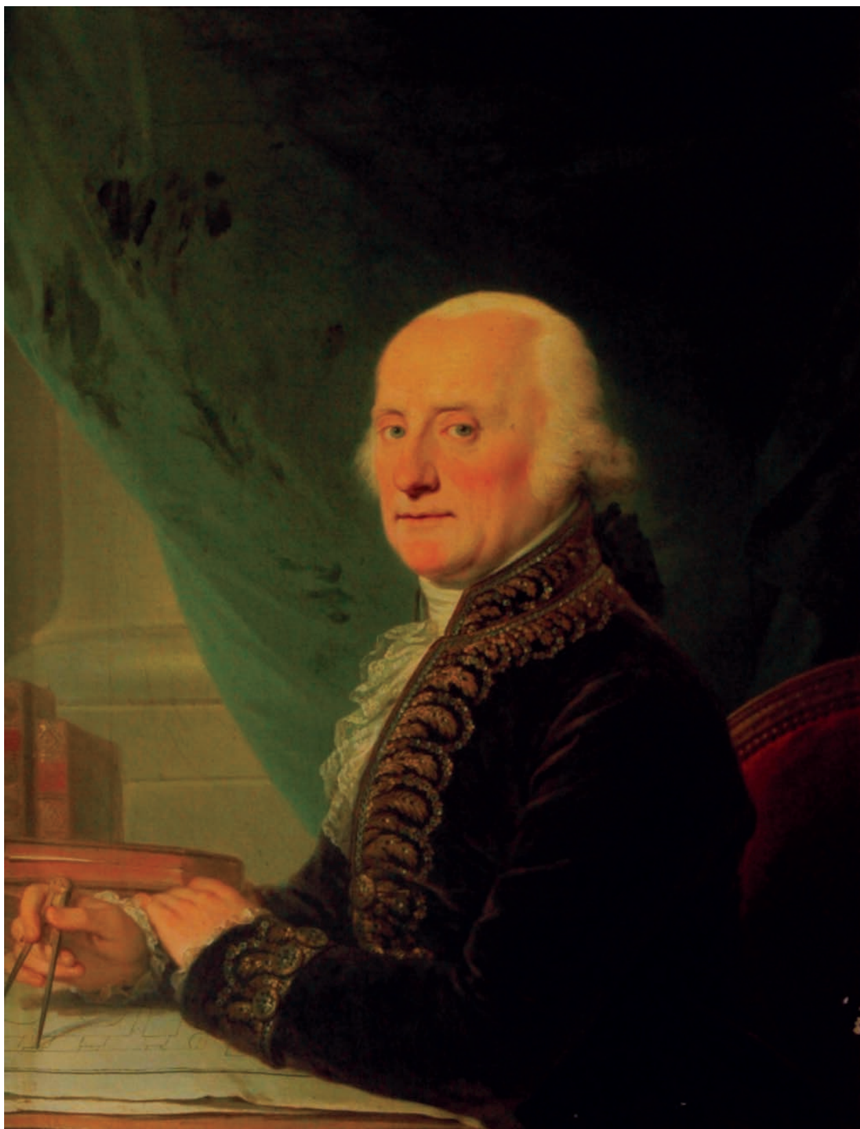
16 – Johann Baptist Lampi st., Karel Josef kníže ze Salm-Reifferscheidtu (1750–1838), po 1800. Státní zámek Rájec nad Svitavou