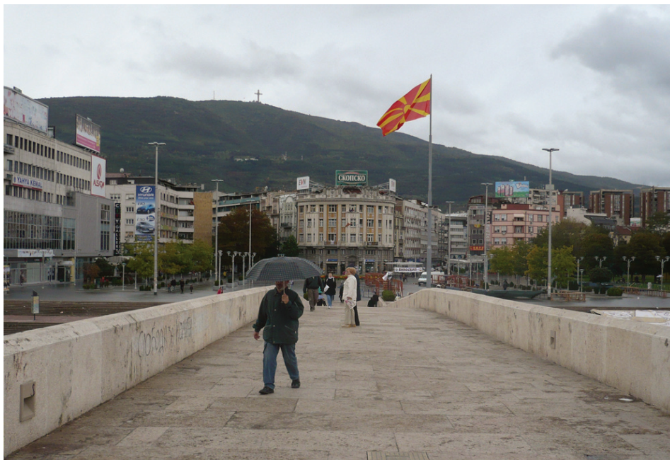
Po Kamenném mostě na Náměstí Makedonie