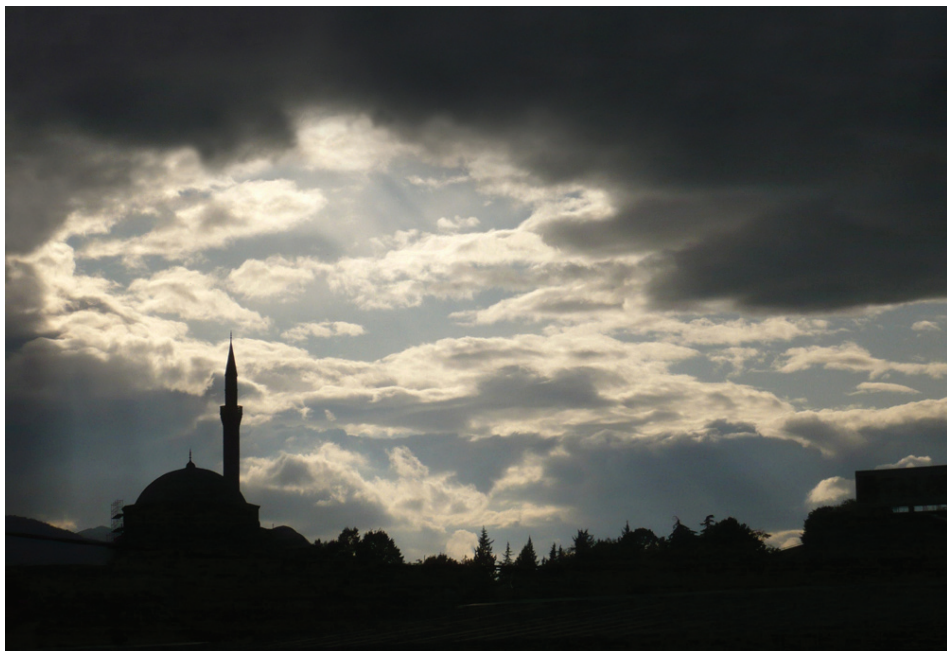
Obrysy v podvečerním slunci