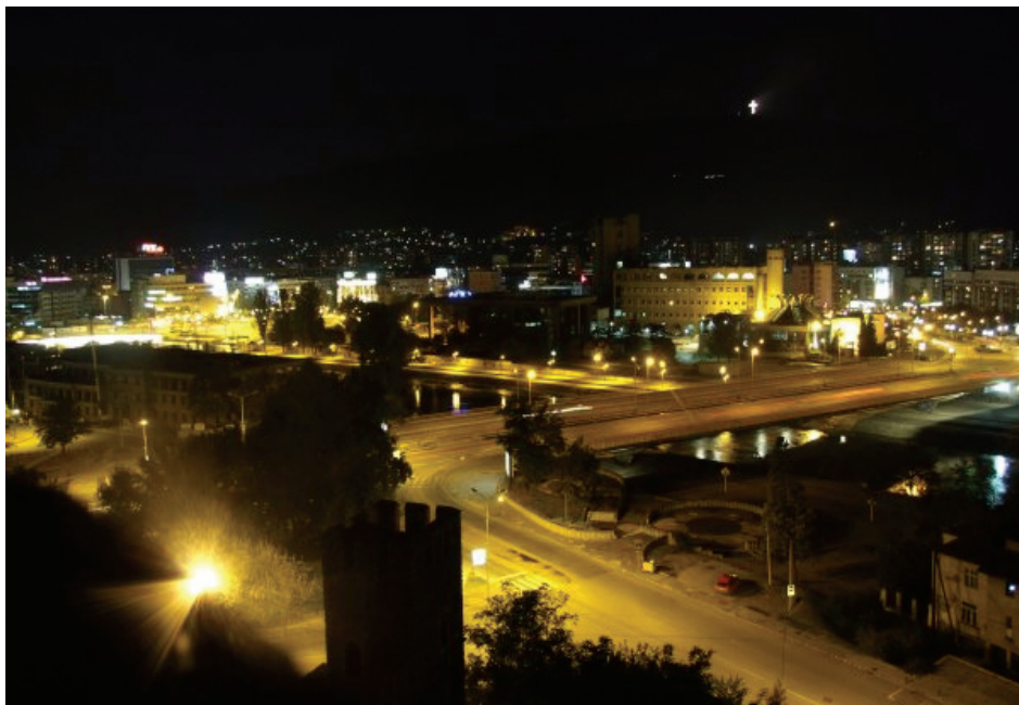
Noční panorama z pevnosti Kale