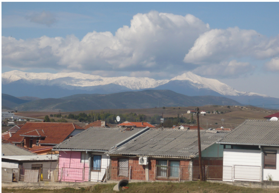
V Šutce teplo, na horách sníh