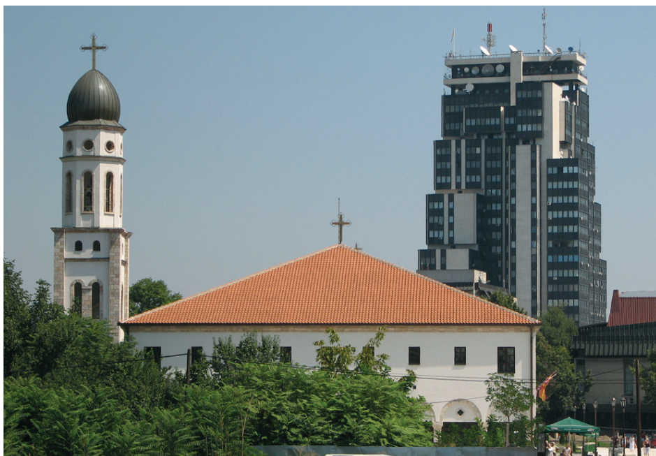
Chrám Nejsvětější Bohorodičky