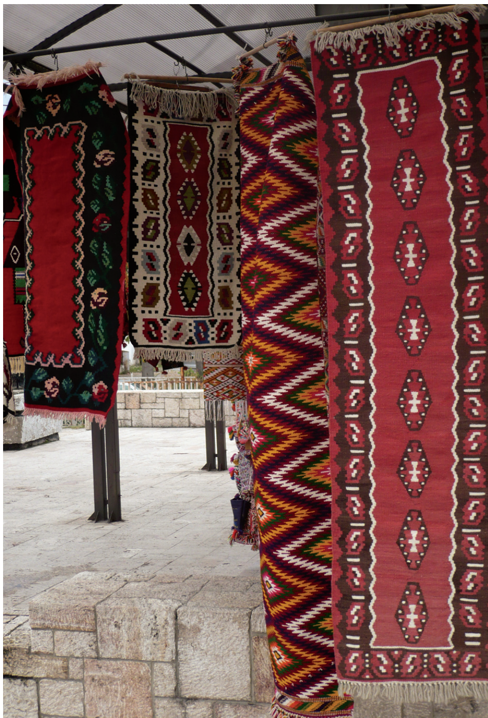
Červená a černá vévodí tradičným koberecům