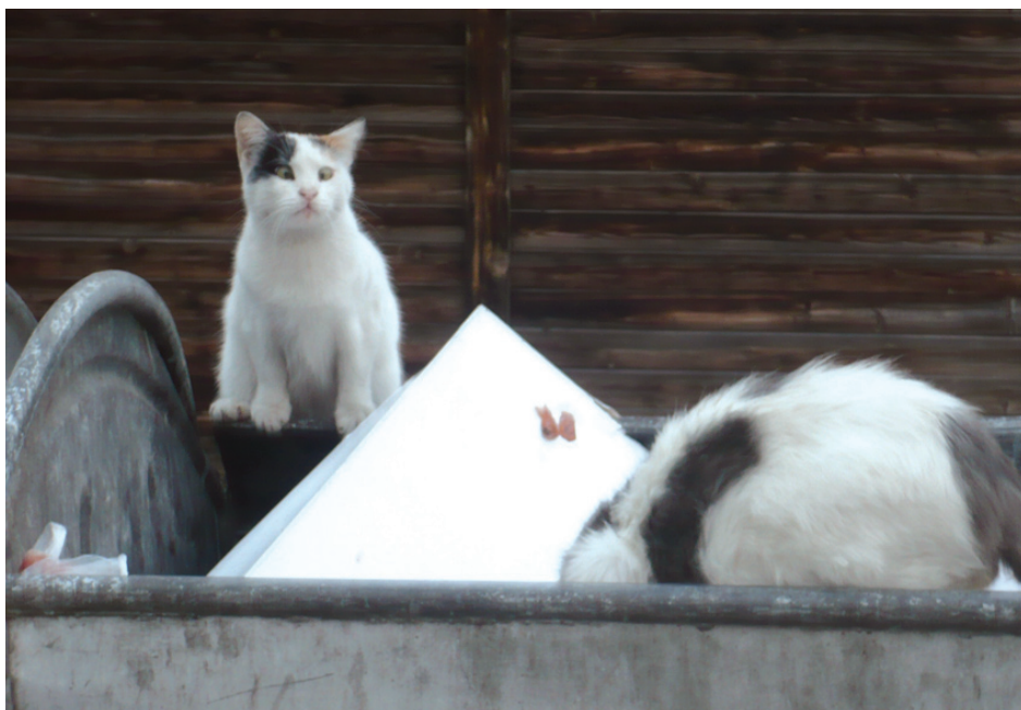
Typický obrázek skopských kontejnerů