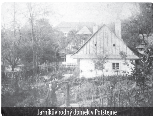
Jarníkův rodný domek v Potštejně