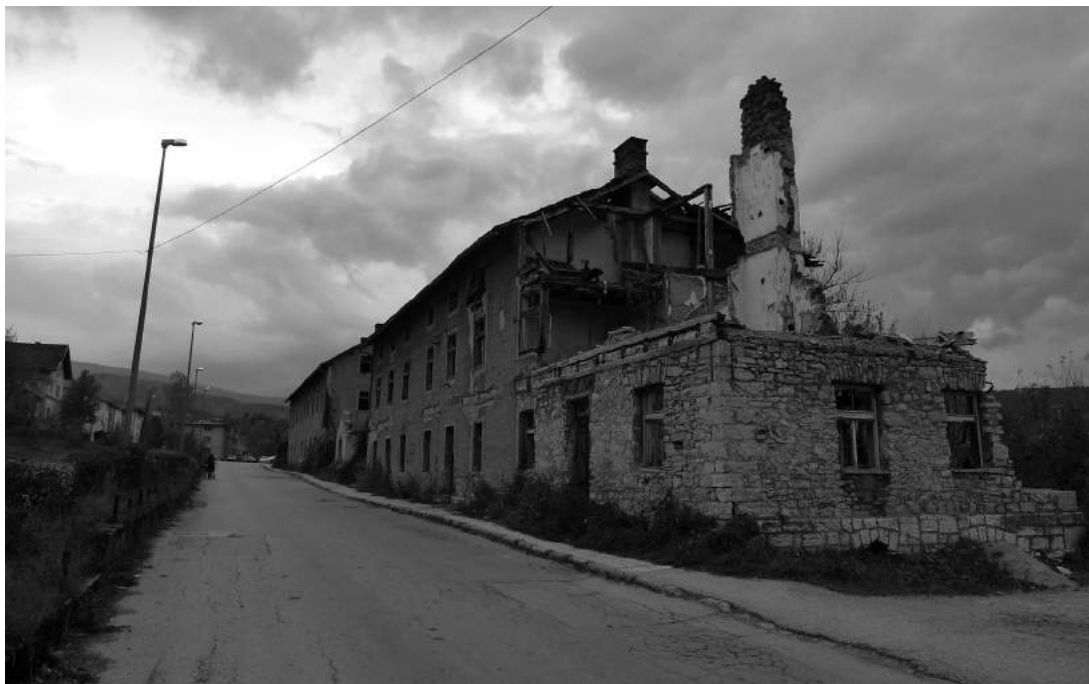
Polorozpadlý dům v Drvaru

ních žádostech úmyslně pomalu, přičemž v mnoha případech odmítaly z nárokovaných domů vykázat ilegální uživatele. Restituci majetku navíc provázela celá řada pochybení, zmatků a omylů, které poukazyvaly na nepřilíživé působení Komise.