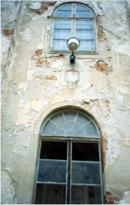
Obr. 7. Jižní průčelí vstupní věže s tesaným erbem, vpravo stopy rýsované rustiky, 1997. Abb. 7. Südfassade des Eingangsturms mit Wappen, rechts Spuren der sich abzeichnenden Rustika, 1997.

pasů, pod nimiž se navenek otvírala přízemí obou bočních rizalitů. U východního spočívají pilířky na patečních kamenných přitesaných kvádrech a z cihel jsou i zaddívky otvorů pod pasy a mezi pilíři.