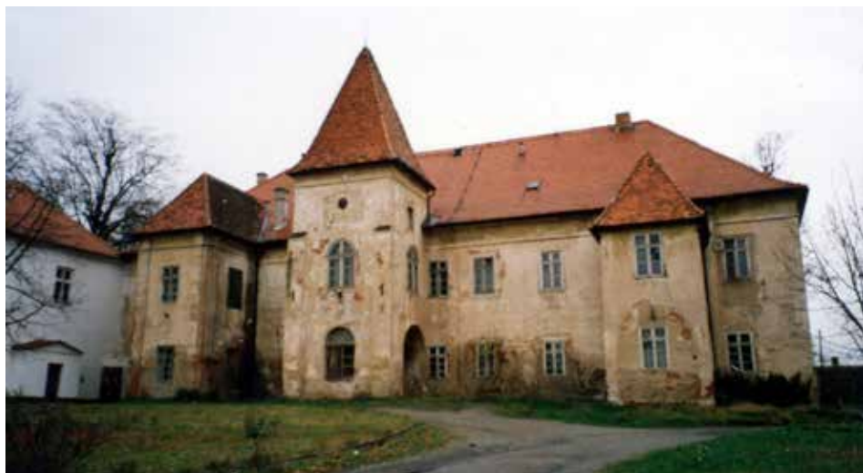
Obr. 4. Zámek, celkový pohled od jihu, 1997. Abb. 4. Schloss, Gesamtansicht von Süden, 1997.