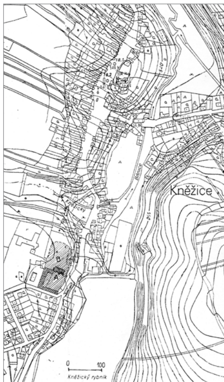
Obr. 1. Kněžice na základní mapě 1 : 5 000. Kostel s farou (proboštvím) stojí na pahorku v severní části obce, tmavě položená dependencie s mřížkováným dvorem (A) se nachází nad rybníkem, panský okrsek, v němž stála tvrz, zahrnuje i šrafované plochy (B).

Abb. 1. Kneschitz auf der Grundkarte 1 : 5 000. Die Kirche mit Pfarrei (Probstei) steht auf dem Hügel im nördlichen Teil der Gemeinde, die dunkel abgesetzte Dependence mit gerastertem Hofe (A) befindet sich oberhalb des Fischteichs, das Gebiet der Gutsherrschaft, in dem die Feste stand, umfasst auch die schraffierten Flächen (B).