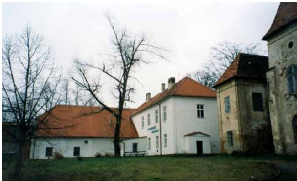
Obr. 6. Západní část zámku (vpravo) a upravený relikt hospodářského dvora, 1997. Abb. 6. Westlicher Teil des Schlosses (rechts) und hergerichtetes Relikt des Wirtschaftshofes, 1997.

Kněžický zámeček tvoří bloková patrová budova obdélného půdorysu se vstupní věží poněkud mimo osu jižního průčelí a se dvěma hlubokými rizality při jeho koncích. Zastřešen je valbovou střechou. Věž krytá stanovou střechou je v přízemí otevřená do stran obloukovými pasy a zámek převyšuje o výšku podstřeší. Boční rizality jsou nestejně vysoké a byly v přízemí původně otevřené do všech stran. Jsou nižší než věž vstupní a jejich valbové stříšky vybihají ze střechy hlavní budovy zámku. Dispozičně tvoří přízemí důsledný podélný dvojtrakt, severní je příčně předělen poměrně pravidelně, jižní obsahoval dva větší prostory na koncích a široký prostor vstupního vestibulu se schodištěm měl po stranách ještě dva příčné trakty. Předělený východní sousedí s pozůstatky zdi patrně staršího (renesančního) schodiště.