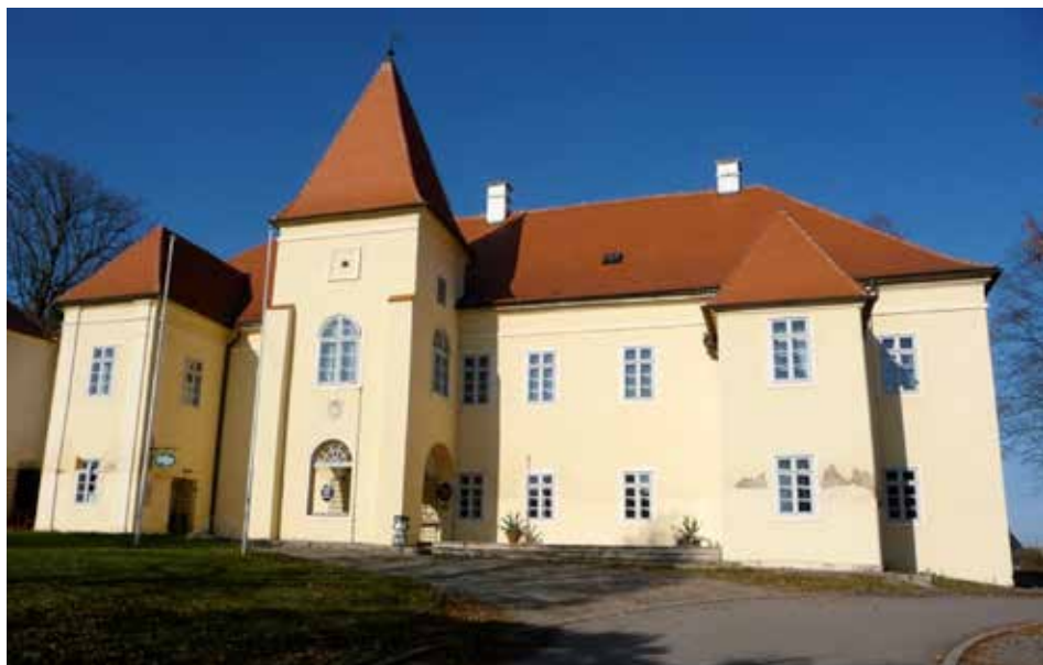
Obr. 9. Zámek od jihu po revitalizační památkové obnově, 2016. Abb. 9. Schloss von Süden nach erfolgter Denkmalsanierung, 2016.