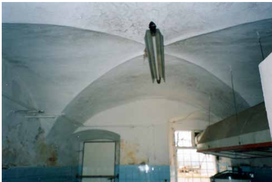
Obr. 8. Stlačená křížová klenba ve třetí místnosti od východu v severním traktu přízemí, 1997.