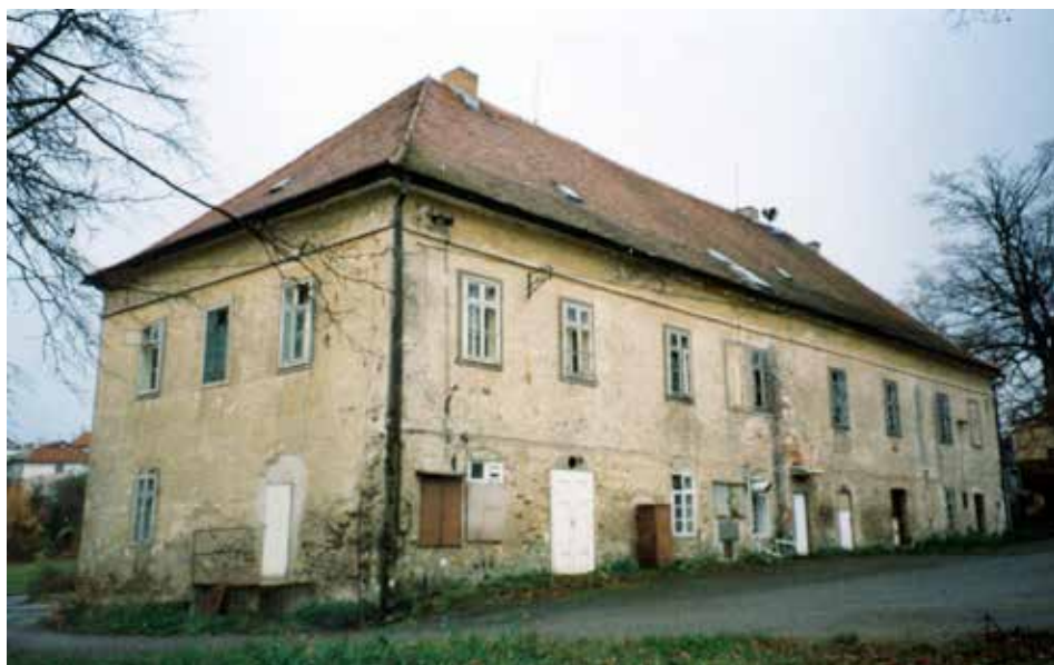
Obr. 5. Zámek, celkový pohled od severovýchodu, 1997. Abb. 5. Schloss, Gesamtansicht von Nordosten, 1997.

se, že Jan Drha z Dolan a Kněžic, jenž ještě krátce před smrtí v roce 1446 přikoupil rudolecké panství, jehož součástí byla tvrz, využíval nově získané sídlo. Jednoduchou kněžickou tvrz, možná i poškozenou, nechal zpuštnout on, nebo jeho syn, který byl knězem (ZDB XIII, č. 12; XII, č. 457).