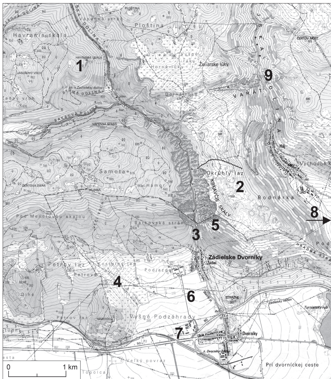
Obr. 1. Sídľisková aglomerácia v okolí Zádielskej tiesňavy (neskorá doba bronzová, doba halštatská).

1 - hradisko Havrania skala; 2 - Zádielske hradisko; 3, 6 - osady; 4 - miesto nálezu náramku; 5 - Kostrová jaskyňa; 7 - pohrebisko (doba bronzová mladá, neskorá); 8 - jaskyňa Kamenná tvár; 9 - Slainová jaskyňa.